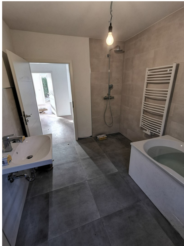
Hauptbad Ansicht 2