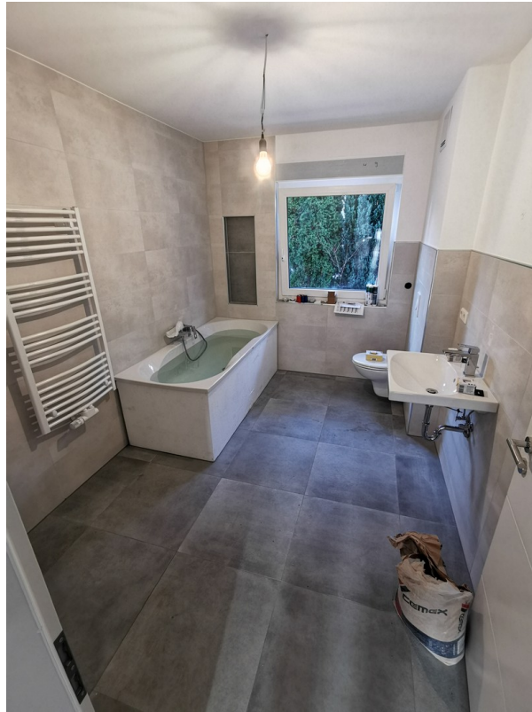
Hauptbad Ansicht 1