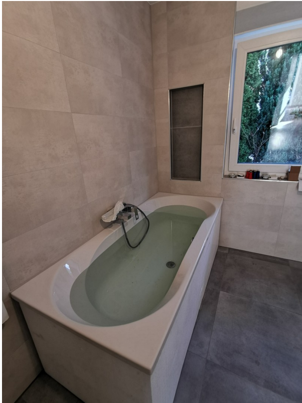
Badewanne 1,80 m