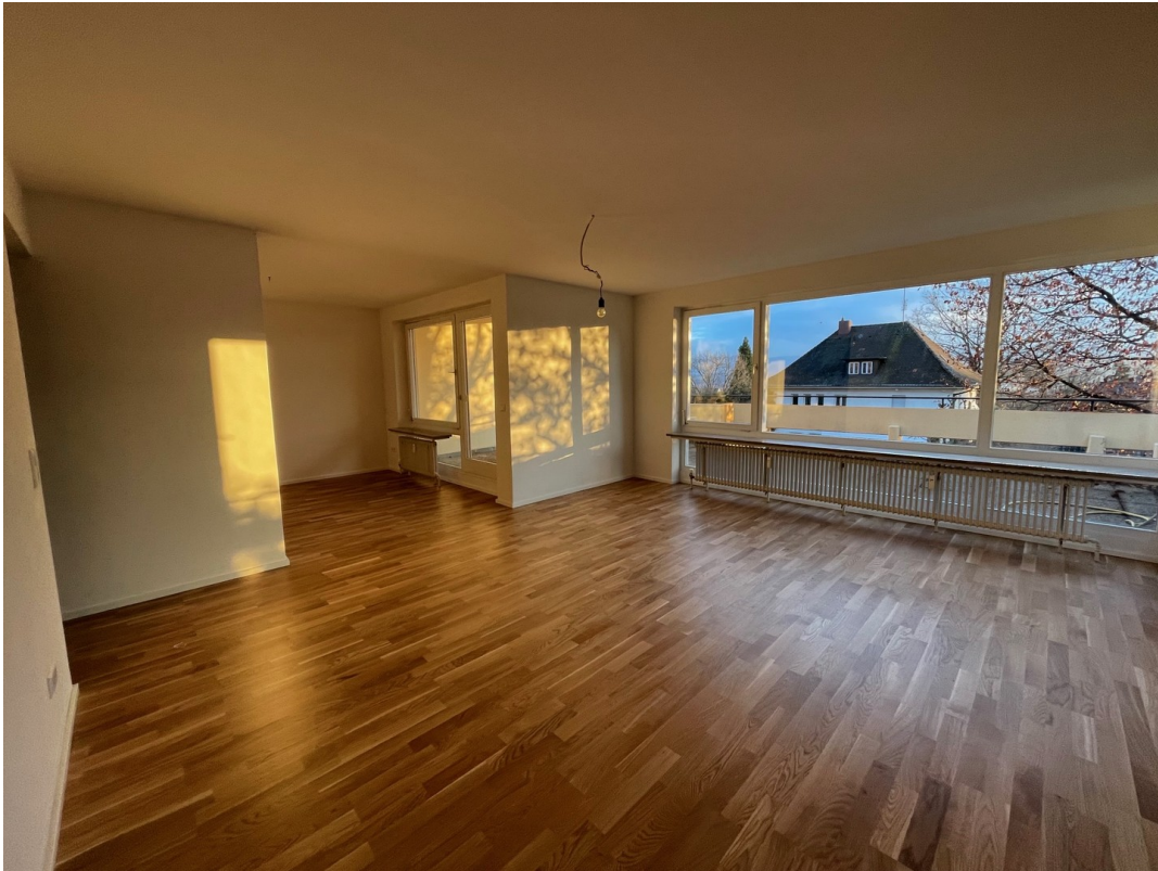
Wohn- und Esszimmer 1