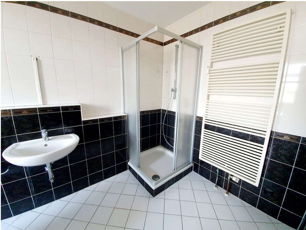
Badezimmer - Dusche