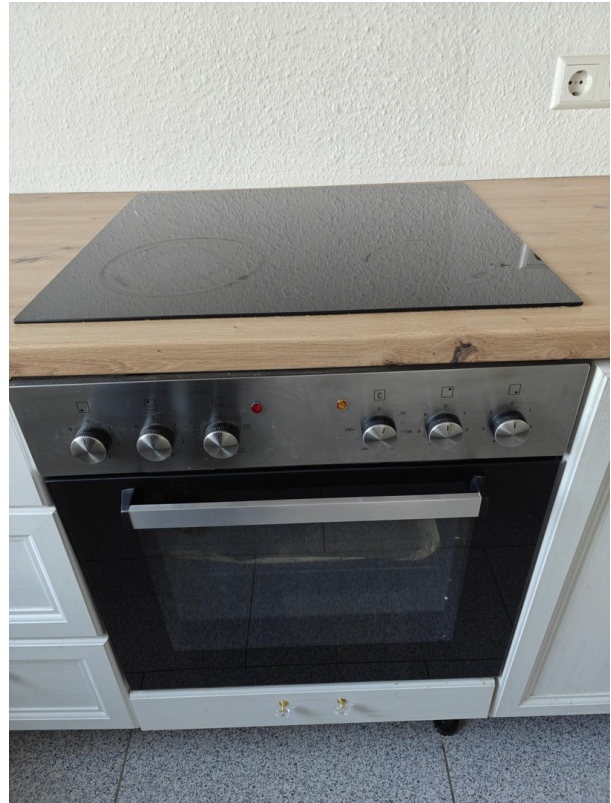
Herd + Ofen