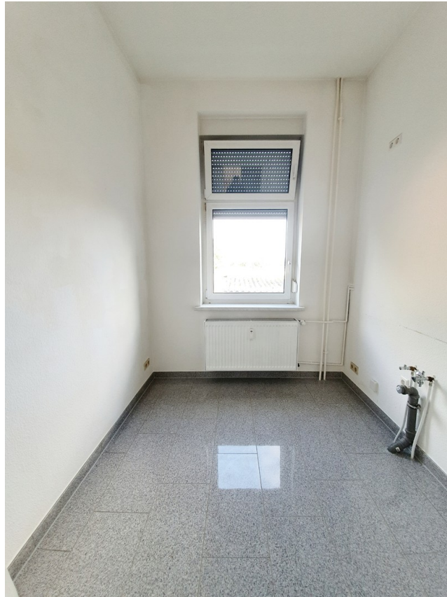
Küche (vor Einbau der EBK)