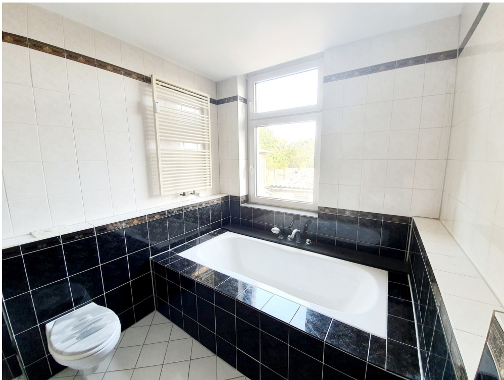
Badezimmer - Badewanne