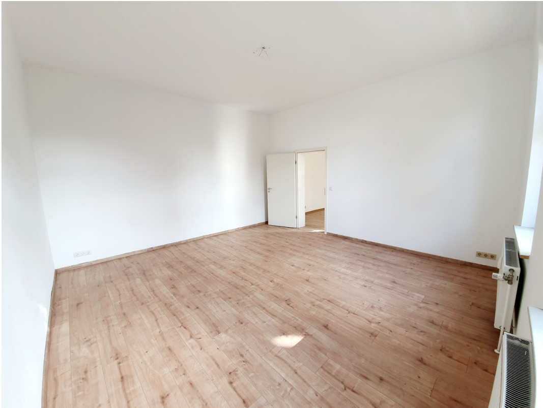
Zimmer 2 - Schlafzimmer