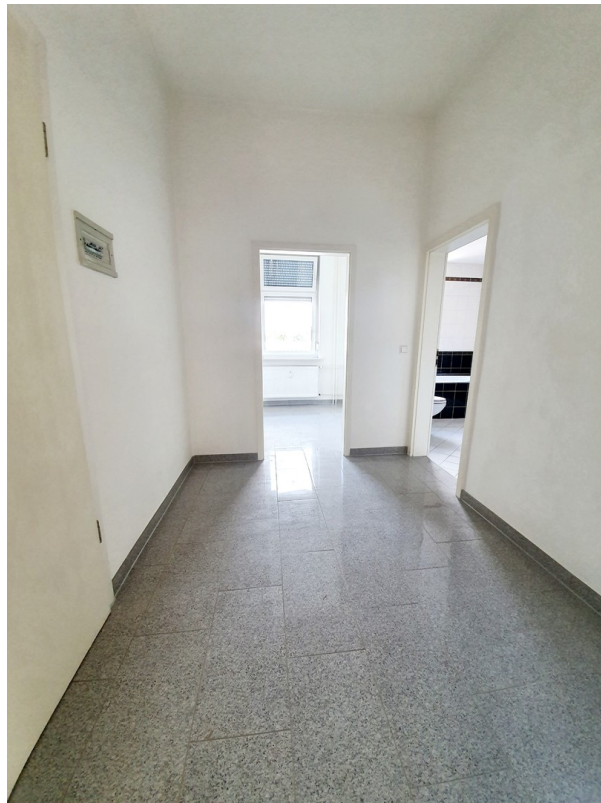
Flur mit Blick zur Kü. und Bad