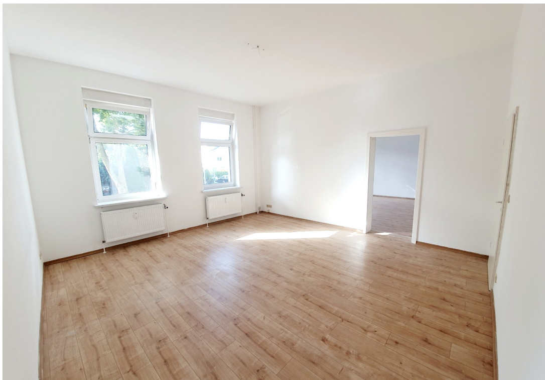
Zimmer 1 - Wohnzimmer