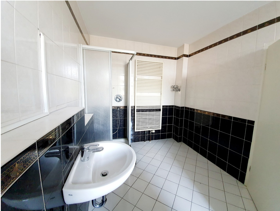
Badezimmer - Dusche