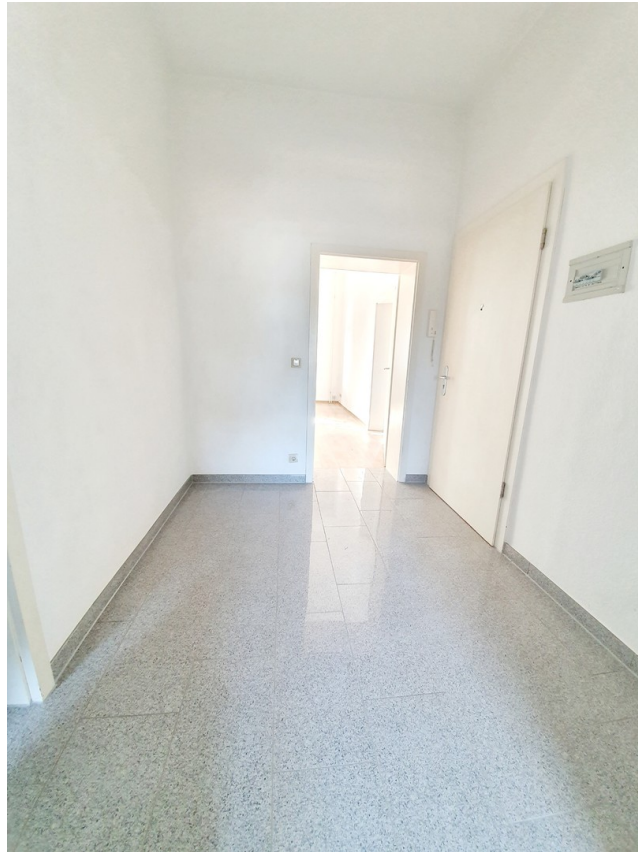
Flur - Blick zum Wohnzimmer