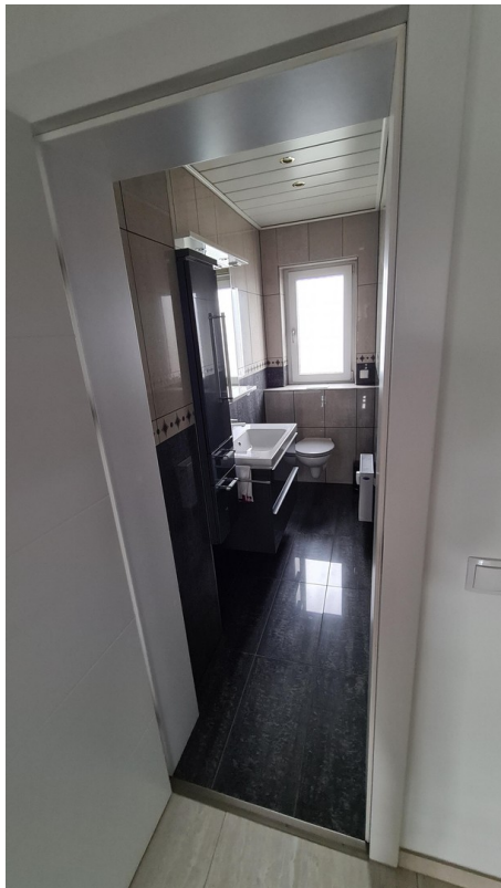
WC 1 OG