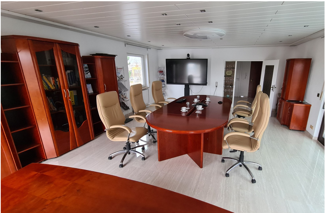
Konferenzraum 1 OG