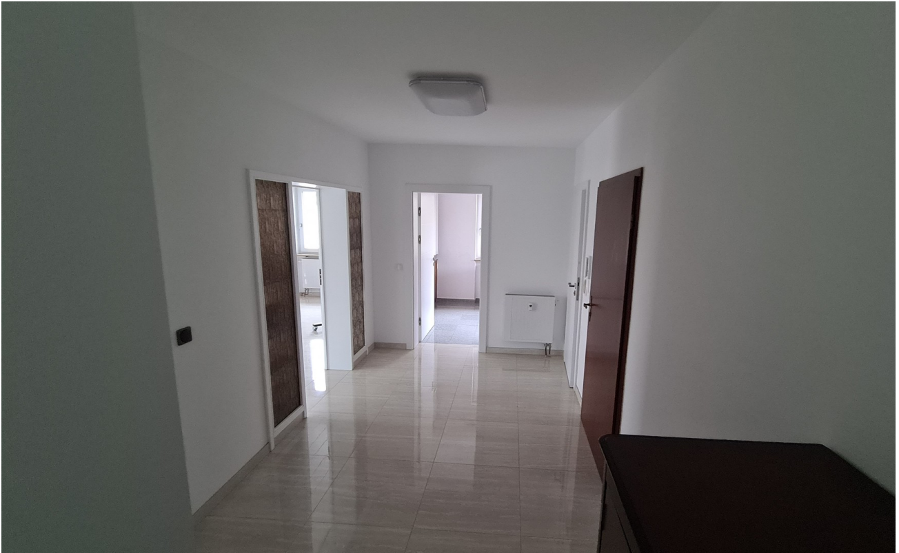
Flur 1 OG