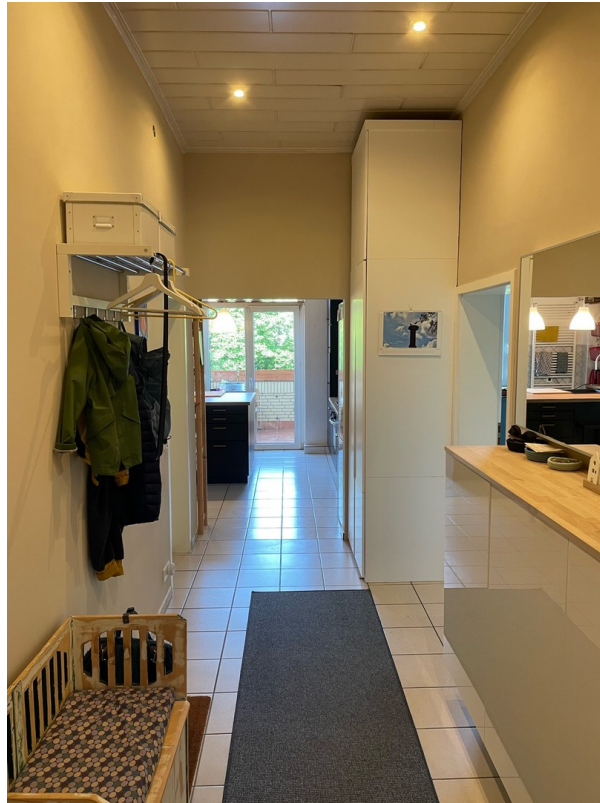
Flur Rtg Küche