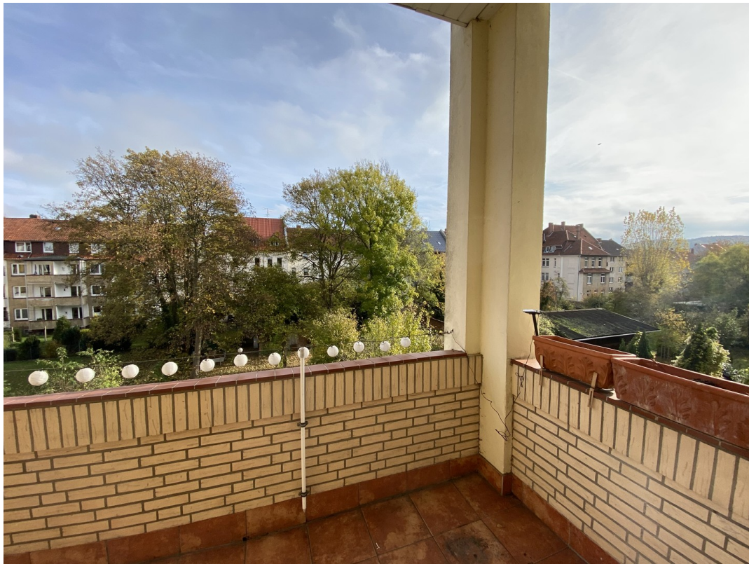
Balkon und Innenhof