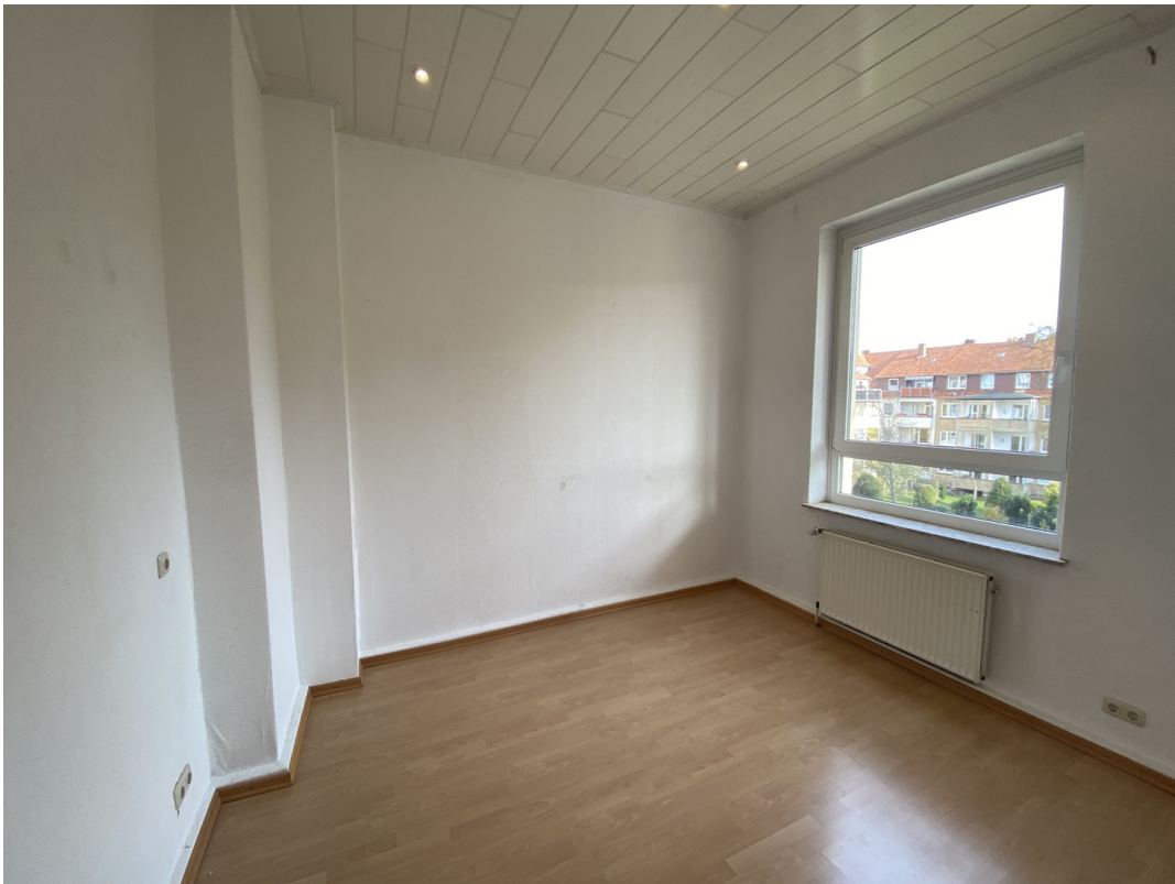
kleines Zimmer zum Innenhof