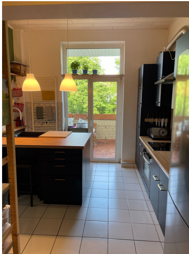
Küche mit Balkonausgang