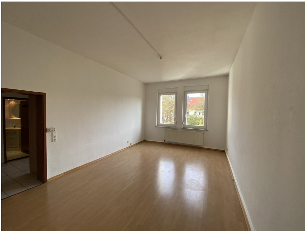
großes Zimmer zum Innenhof