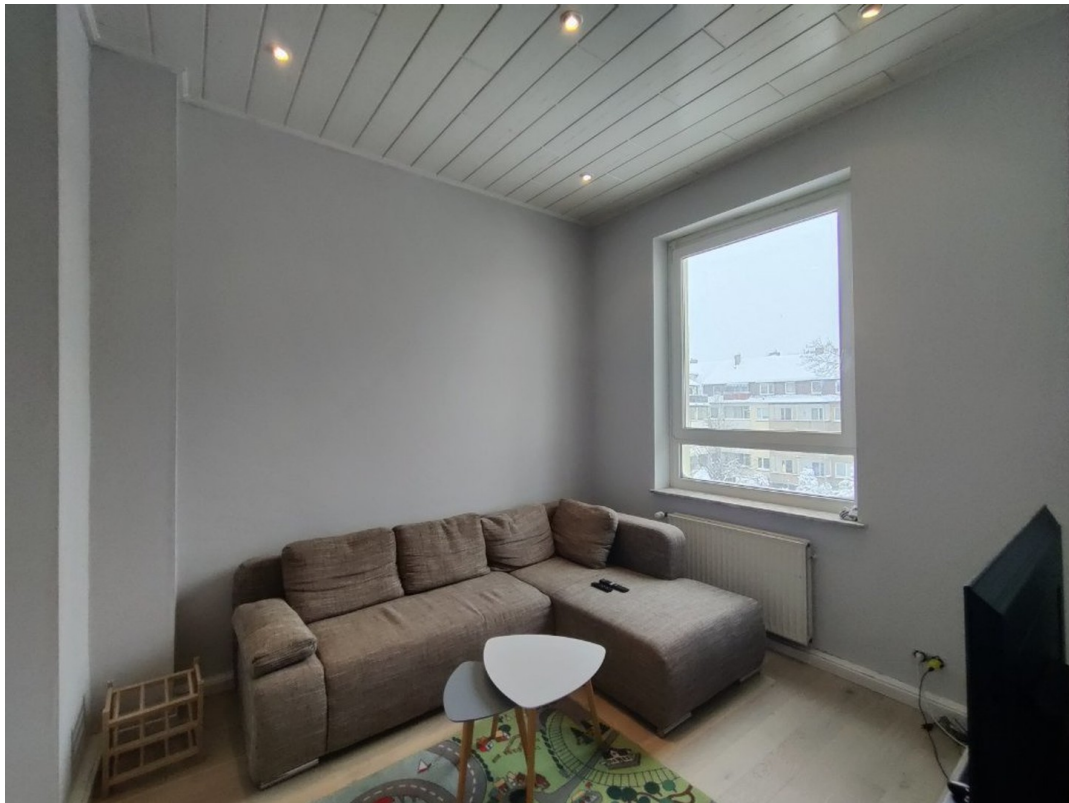
Kleines Zimmer eingerichtet