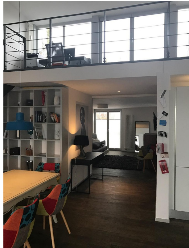
Essbereich, Galerie, SZ