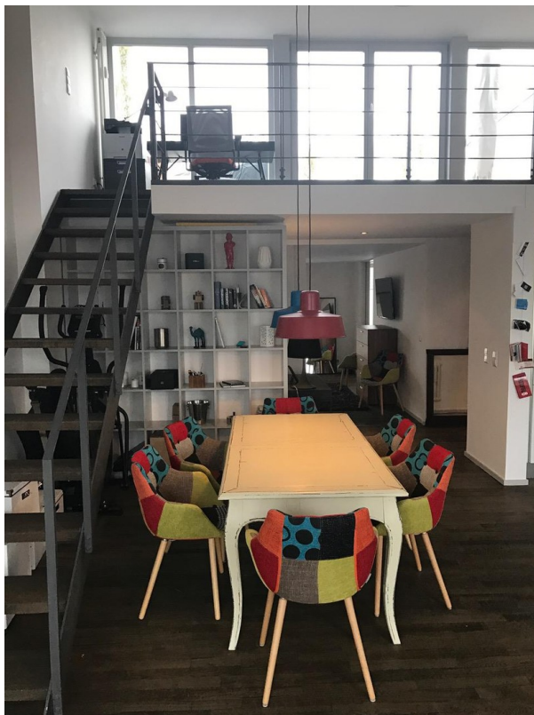
Essbereich und Treppe 2