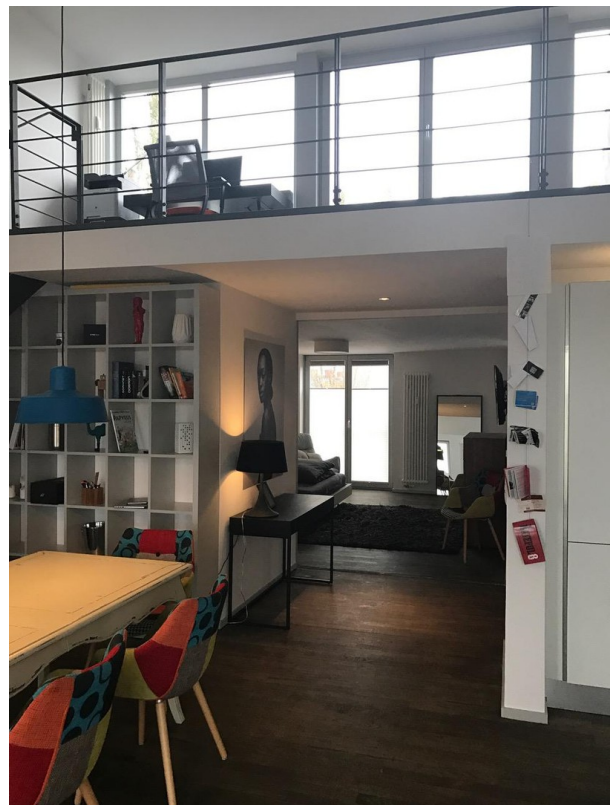
Essbereich, Galerie, SZ