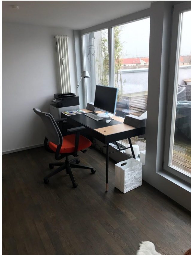
Arbeitsplatz auf Galerie