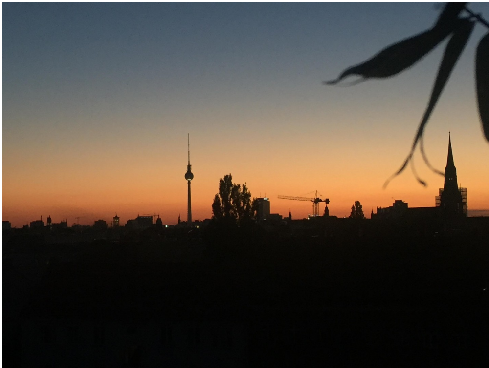
Blick von Terrasse im Sommer