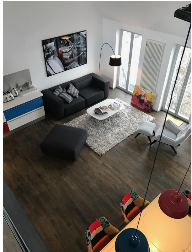
Wohnbereich von Galerie