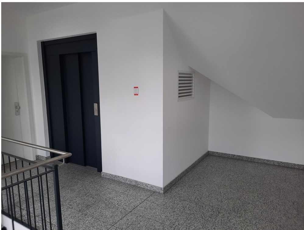
Vorraum mit Aufzug