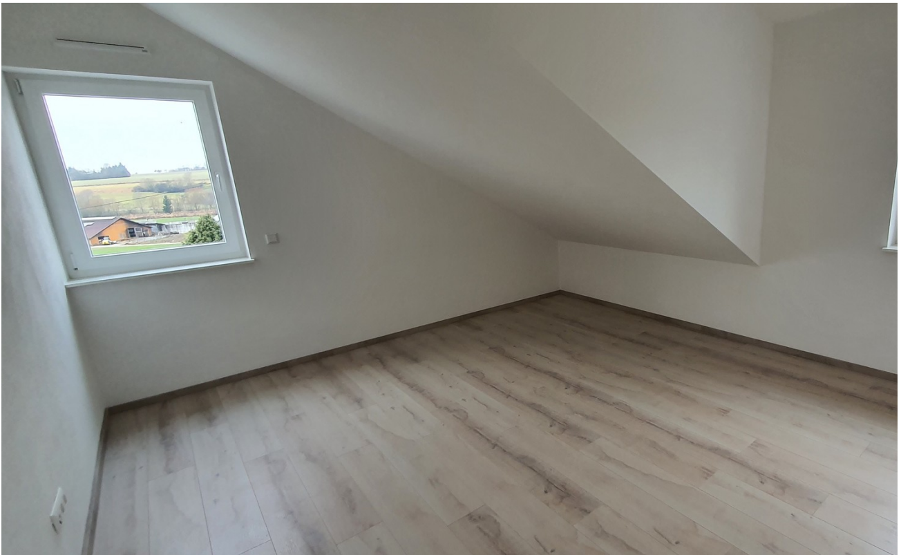
Büro / Gast