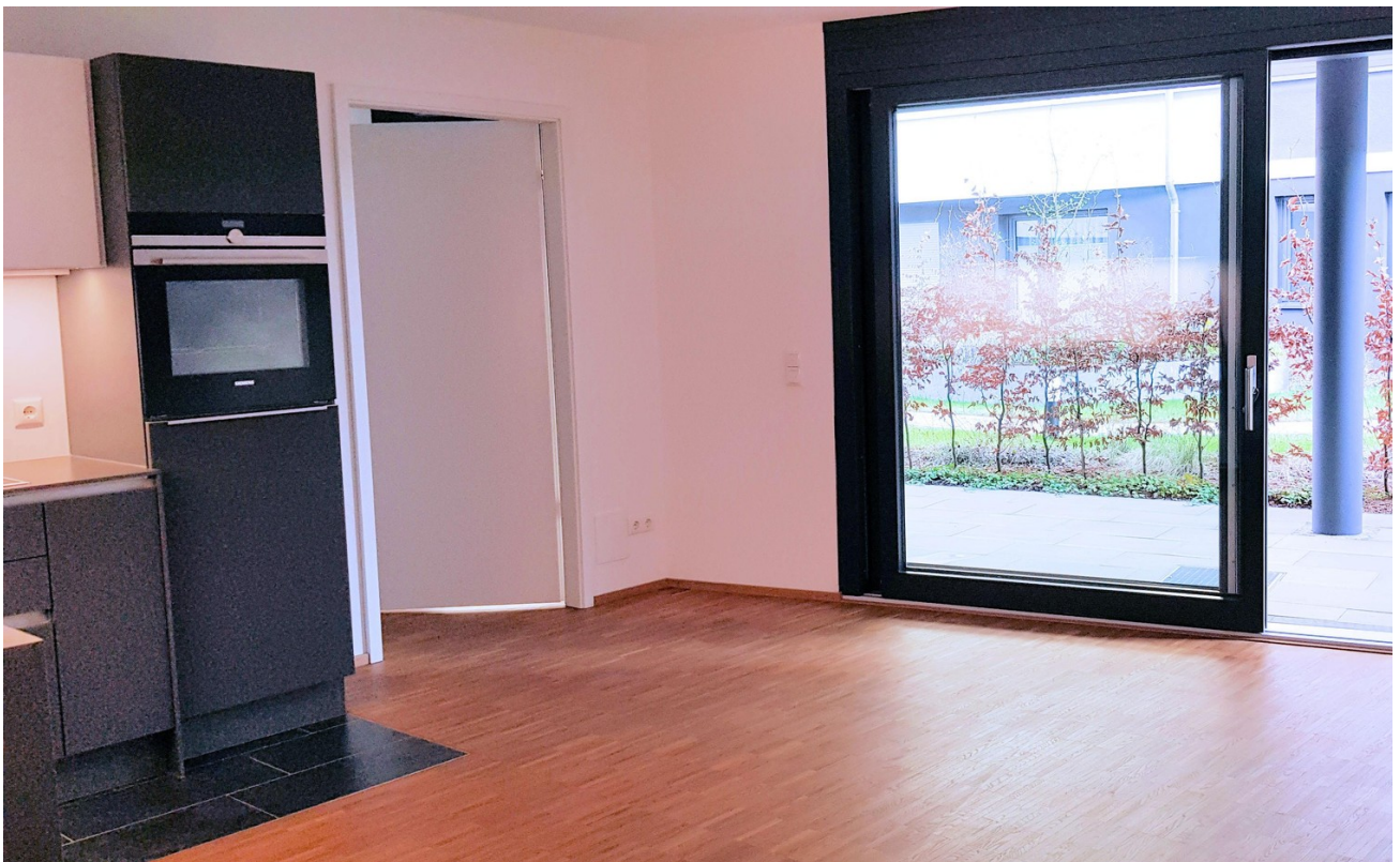
Wohnen, geöltes Holzparkett