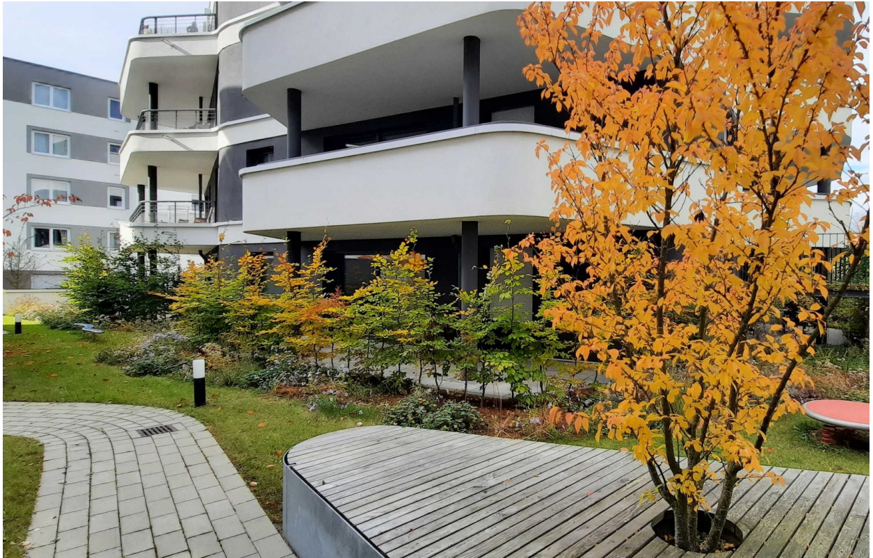
Terrasse und Außenanlage