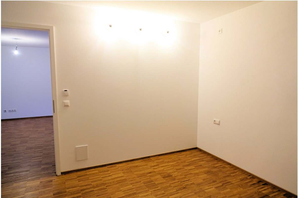
Schlafen, geöltes Holzparkett