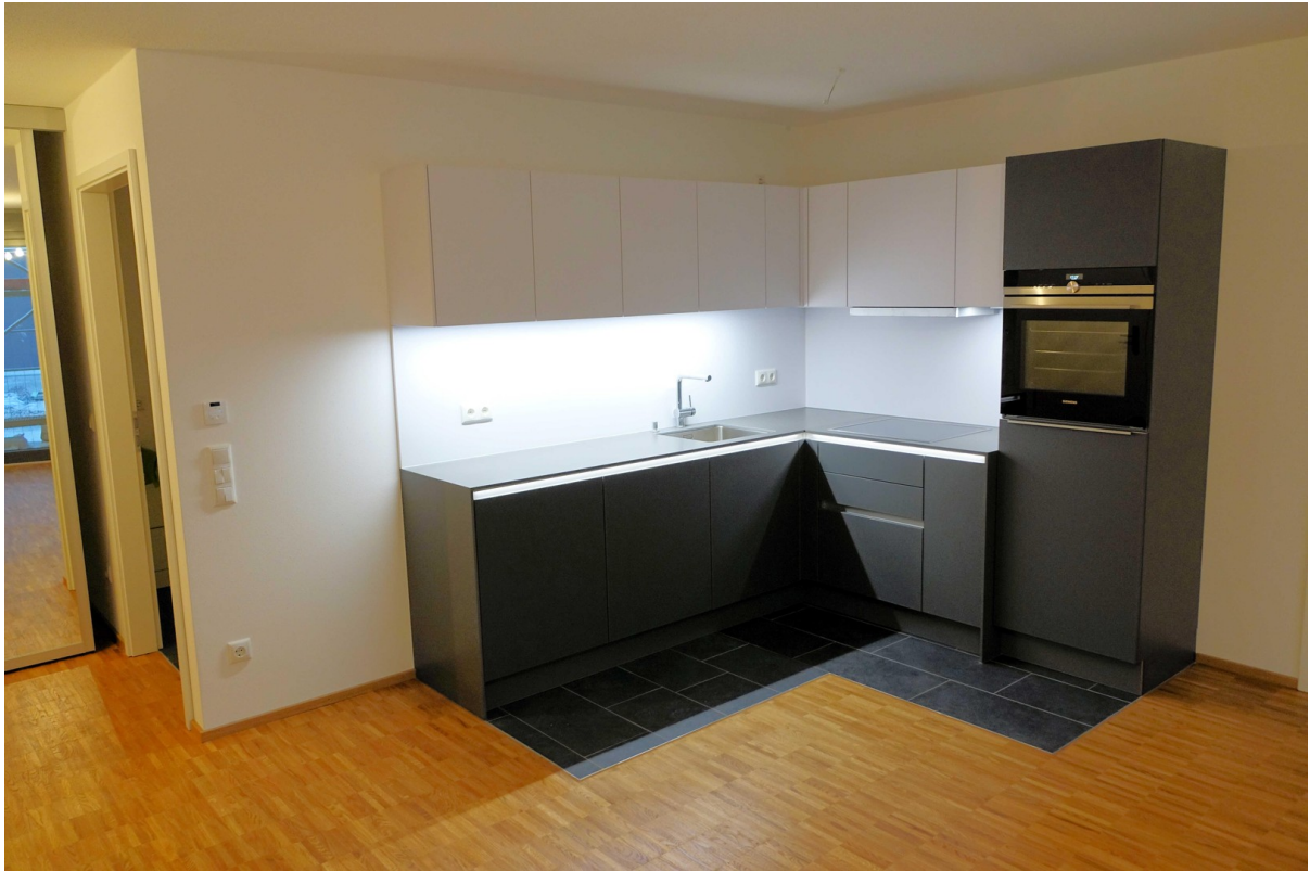
Wohnküche mit Lichtkonzept