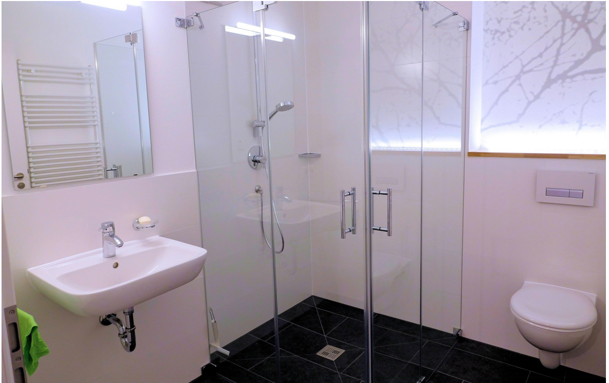
Badezimmer mit Lichtdesign