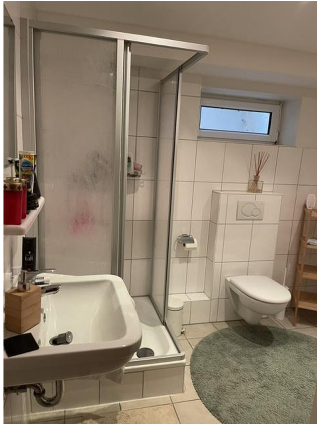
Duschbad im Keller