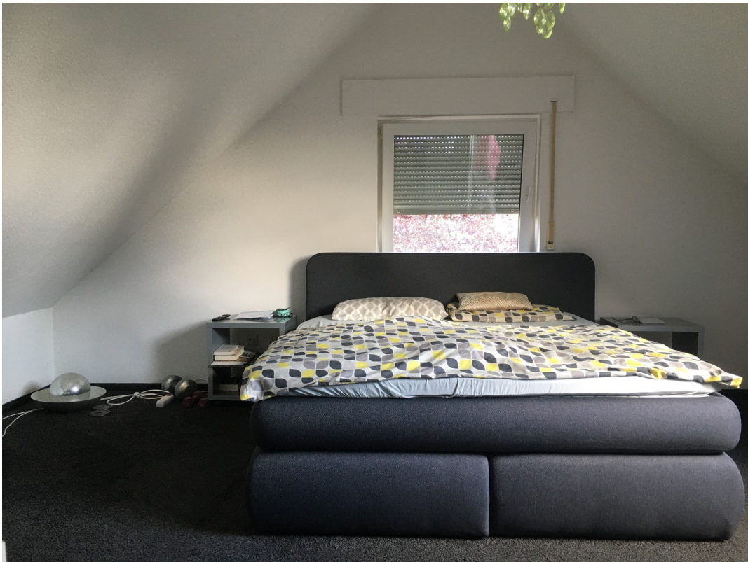
großer Raum im DG