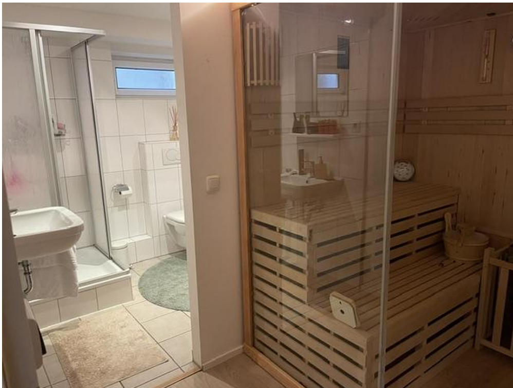
Keller mit Sauna