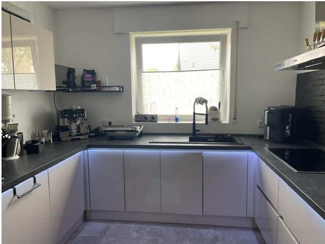
Küche, die gerne verkauft wird