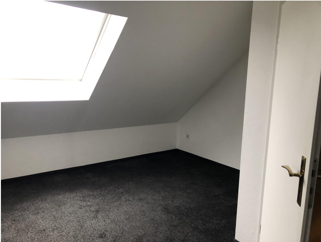
großer Raum DG