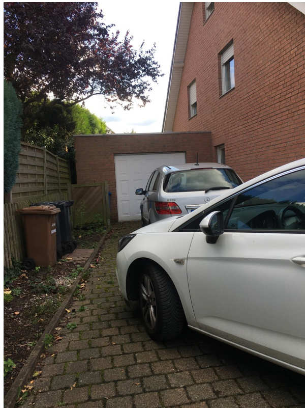
gr. Garage mit 2 Stellplätzen