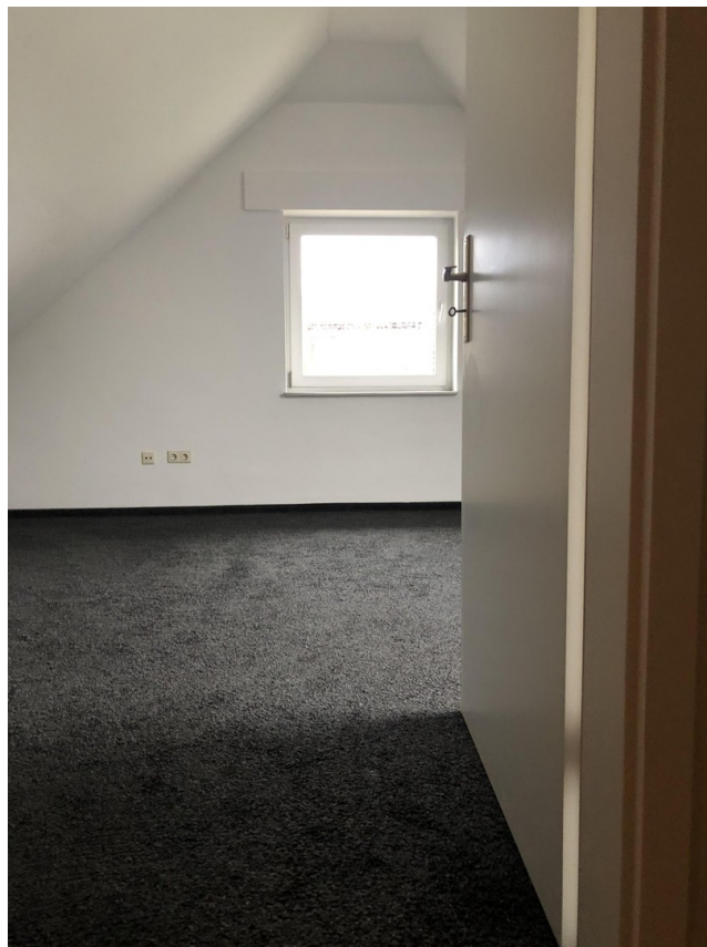
großer Raum DG