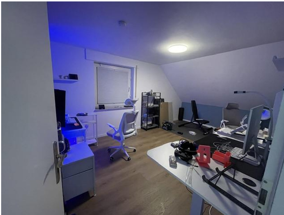
2. Schlafzimmer 1. OG