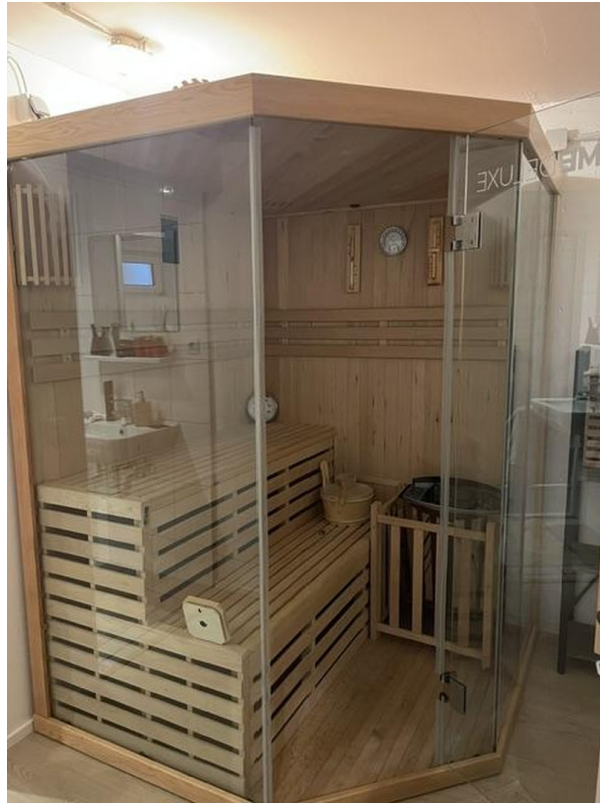
Sauna, die gerne verkauft wird