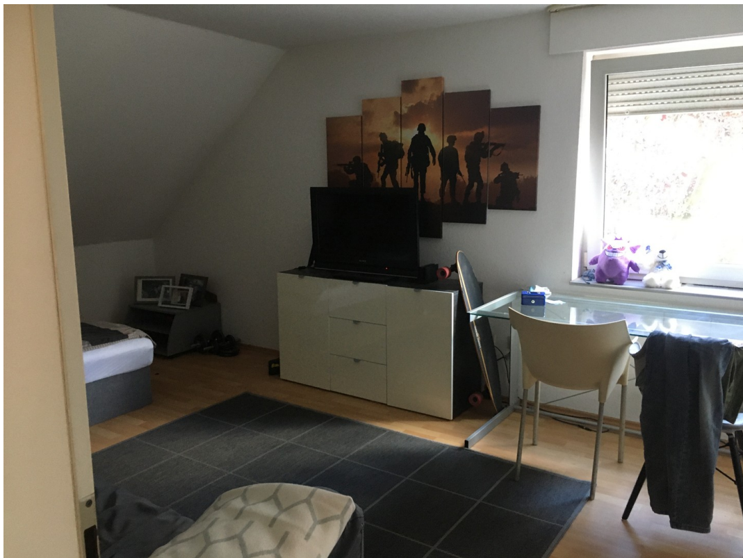
1. Schlafzimmer 1. OG