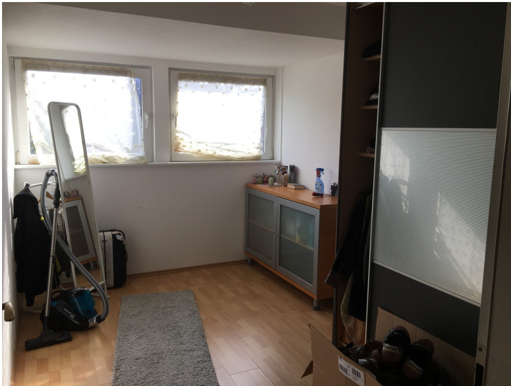
3. Schlafzimmer 1. OG