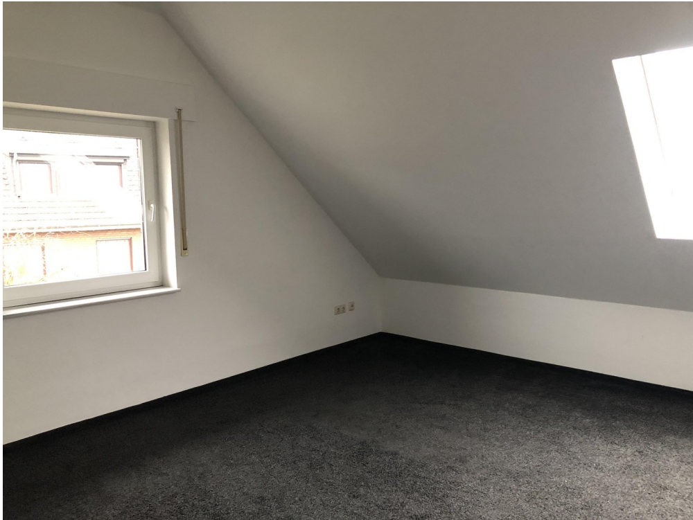
großer Raum DG