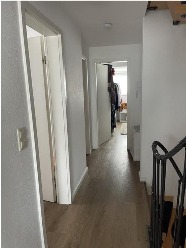
Flur oben 1. OG