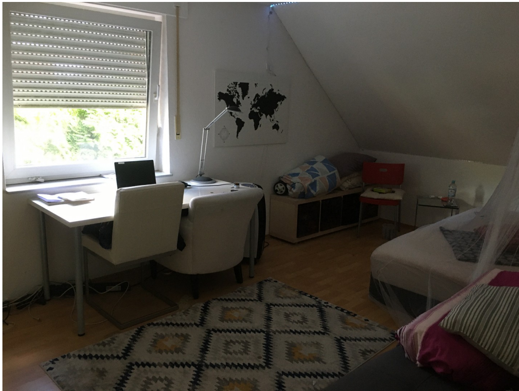
2. Schlafzimmer 1. OG