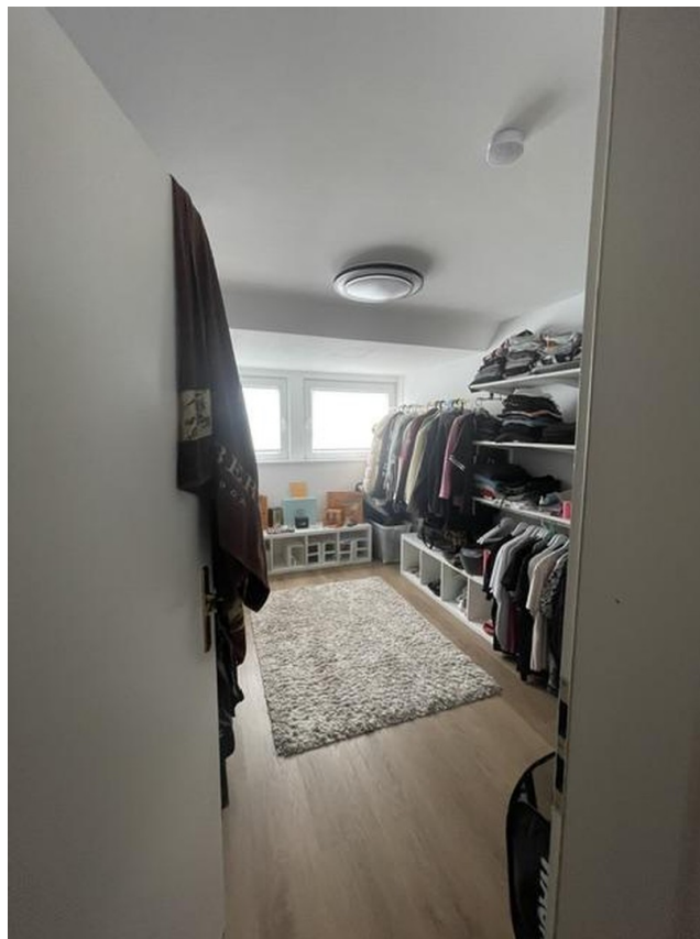
3. Schlafzimmer 1. OG