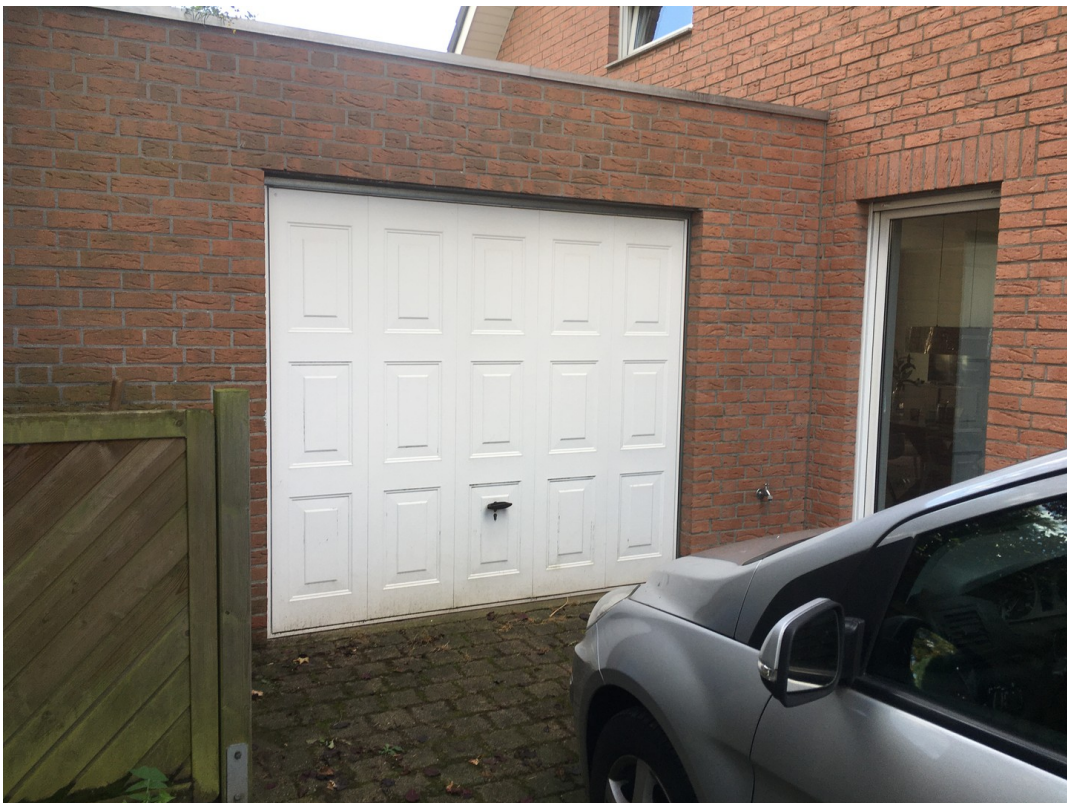
Garage mit direktem Hauszugang