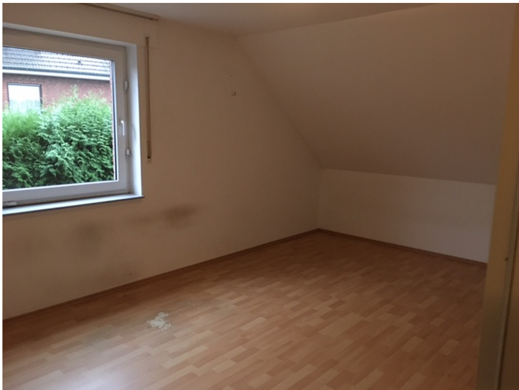
2. Schlafzimmer leer 1. OG