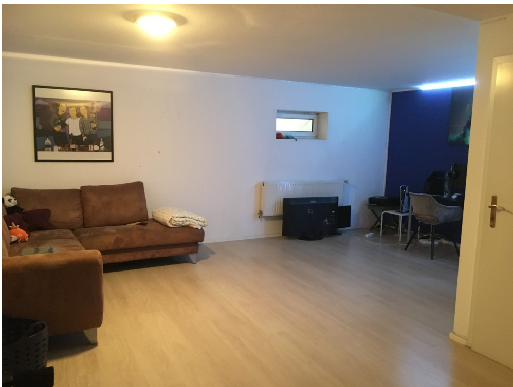
sehr gr. Raum im Keller