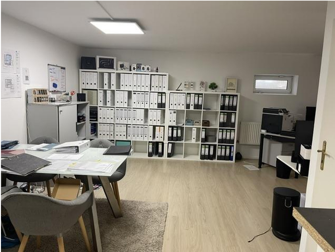
sehr gr. Raum im Keller