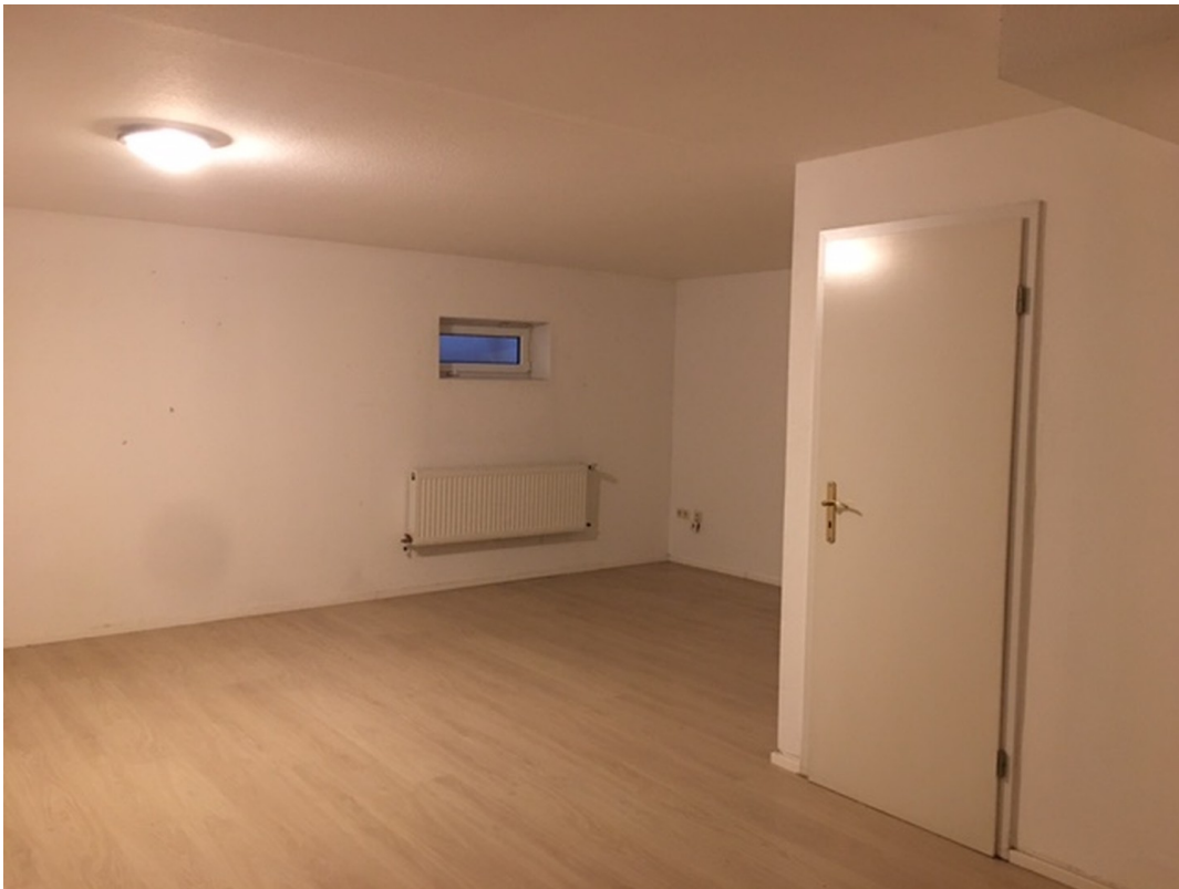
sehr großer Kellerraum, leer