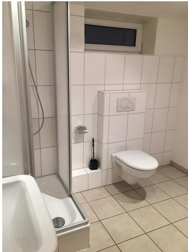
Duschbad im Keller