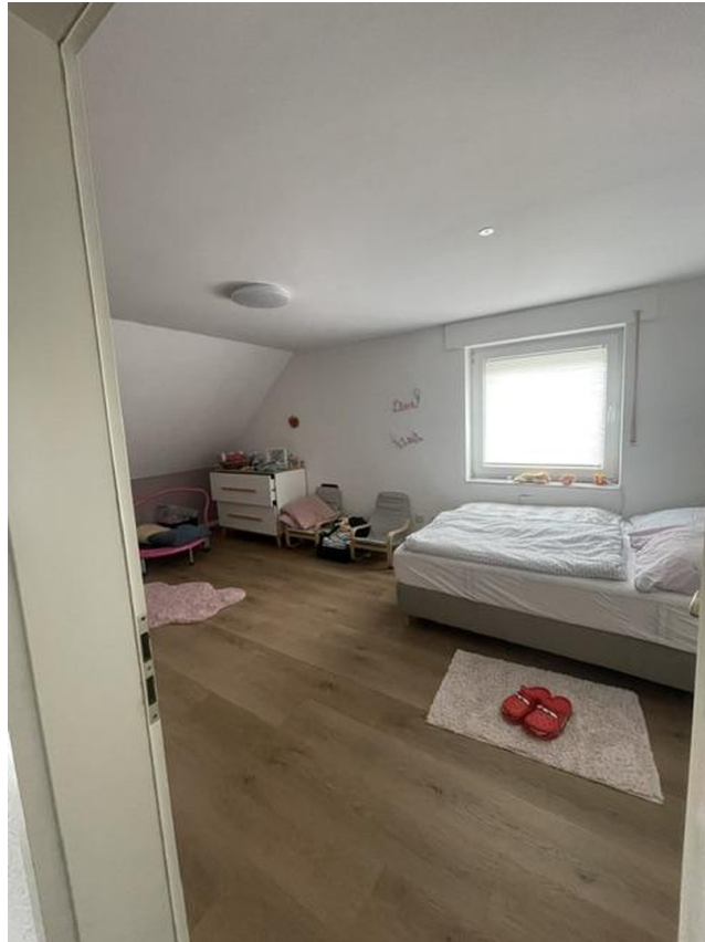
1. Schlafzimmer 1. OG