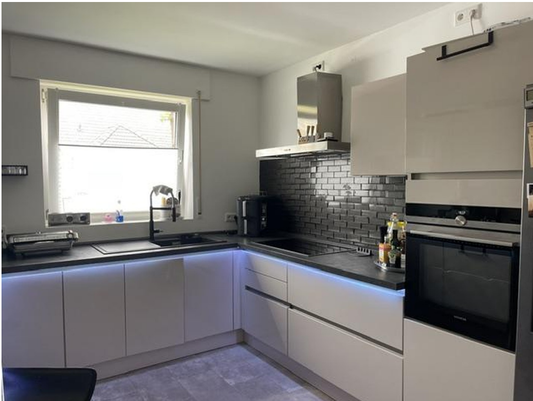
Küche, die gerne verkauft wird