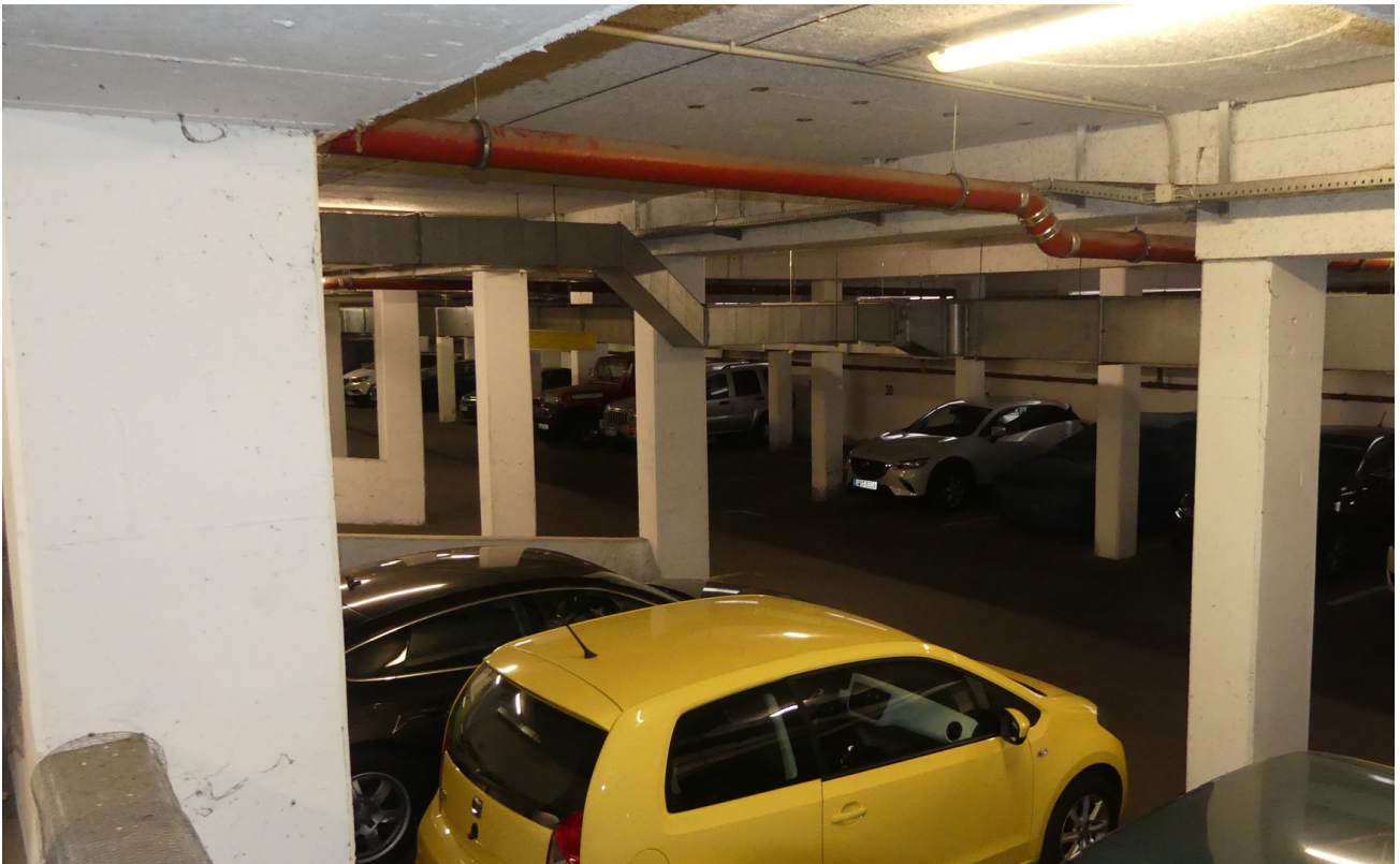
Tiefgarage direkt vom Lift aus