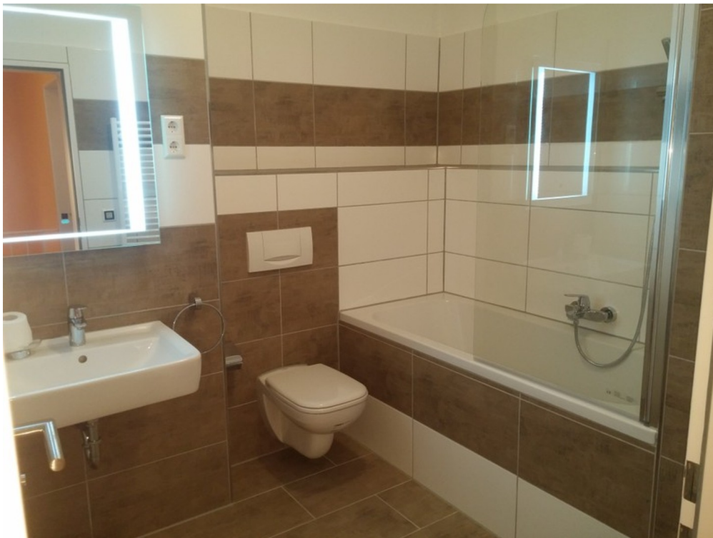
Wohlfühloase mit Regendusche