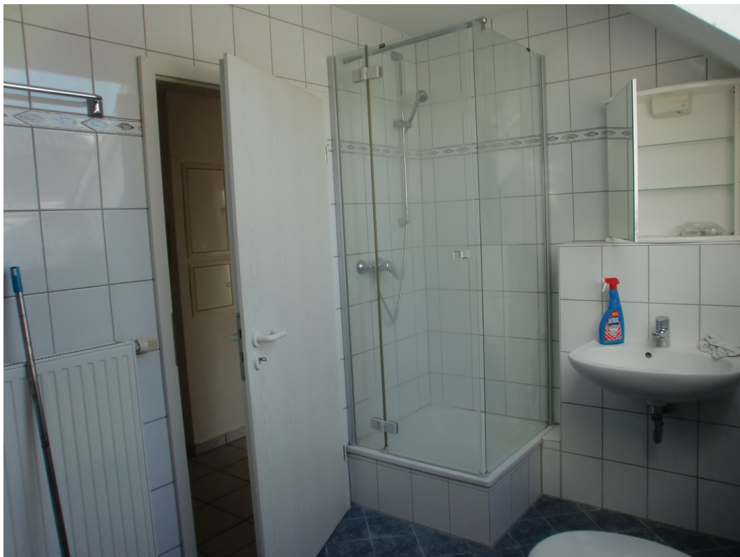
Bild mit Dusche