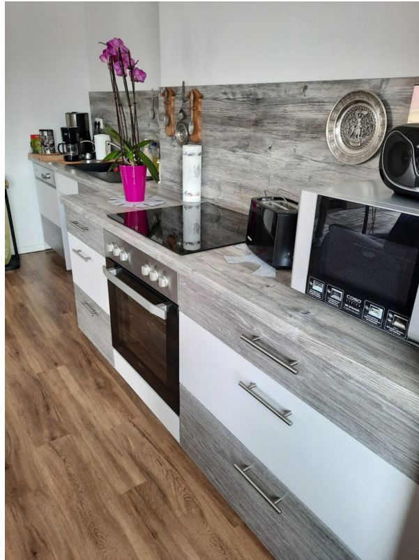
Einbauküche des Vormieters