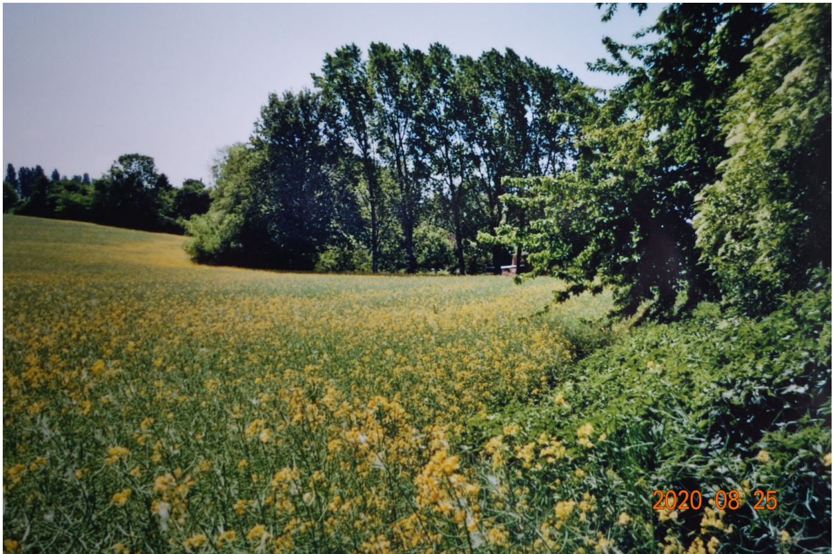
Blick aufs Feld