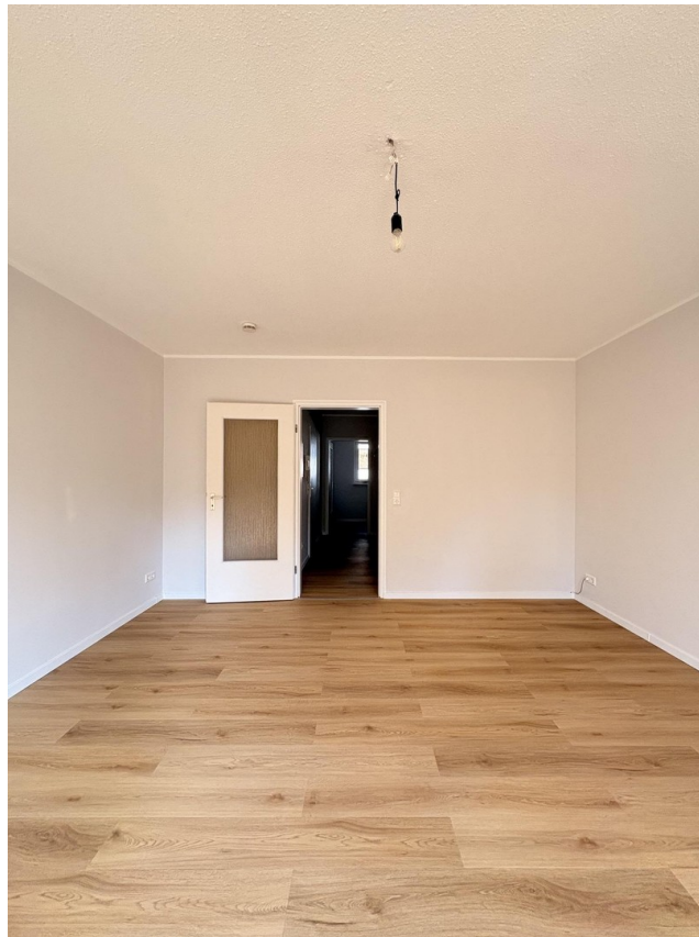
Wohnraum zum Flur