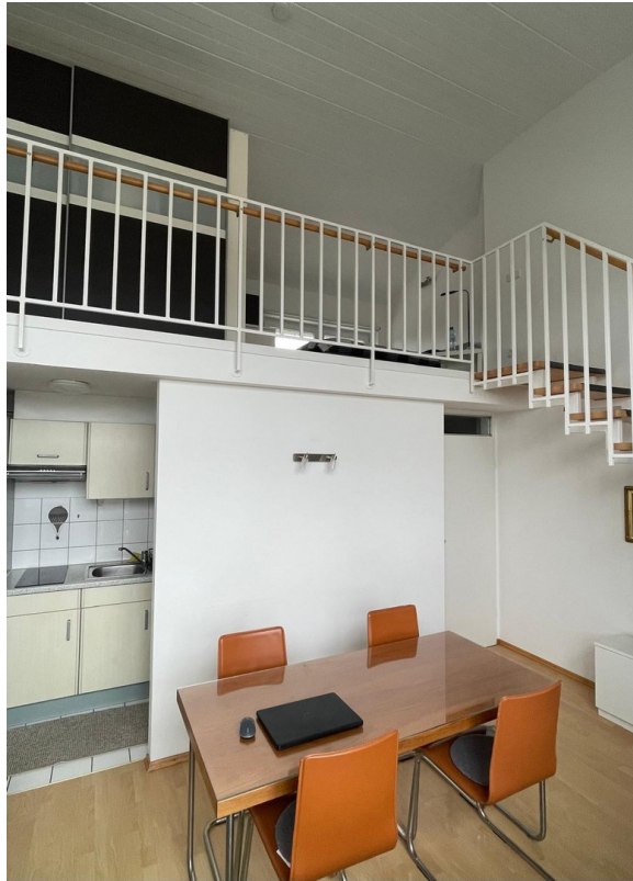
Ess- & Wohnbereich