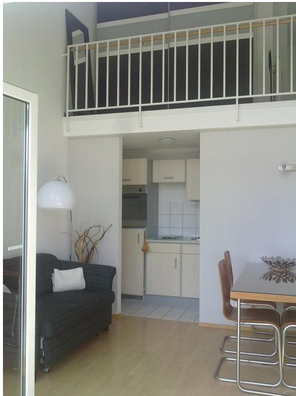
Ess- & Wohnbereich