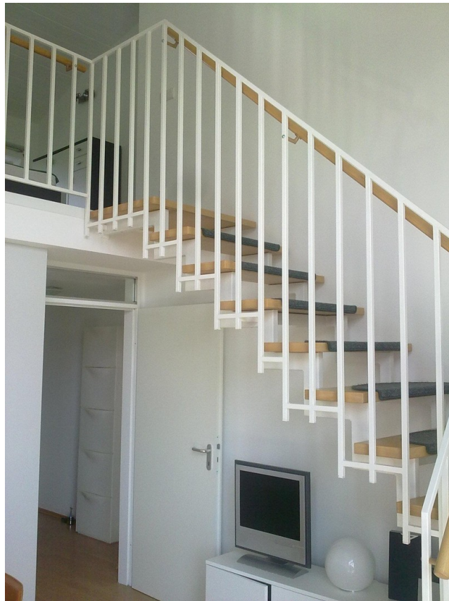
Treppe zur Galerie