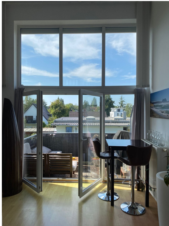
Blick zum Balkon