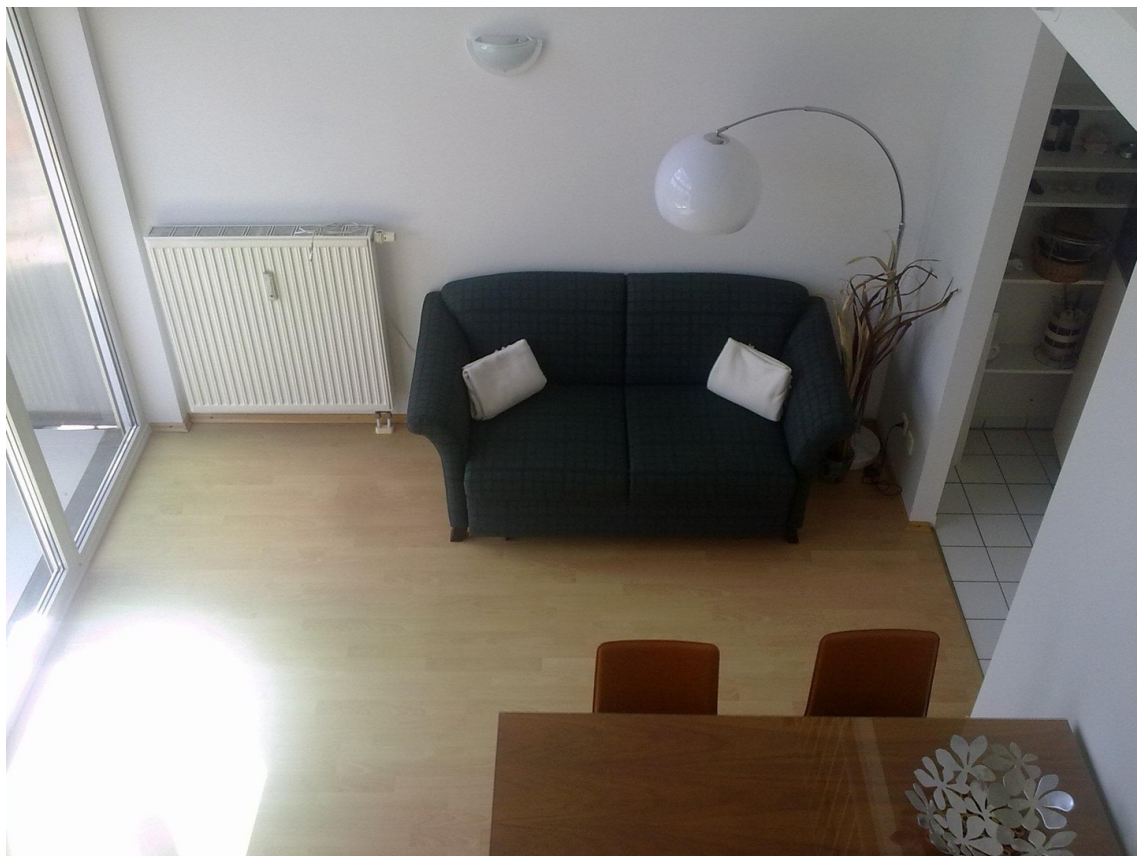
Blick von der Galerie