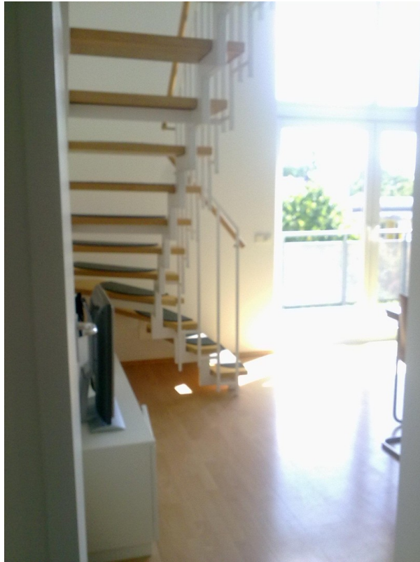
Blick vom Flur in das WZ