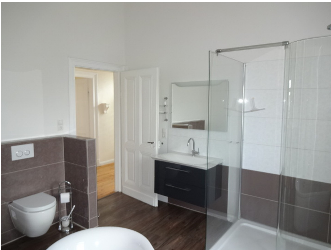
Hauptbad im Obergeschoss