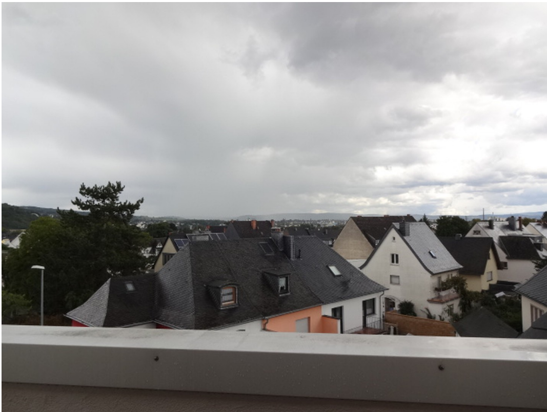
Aussicht von der Dachterrasse