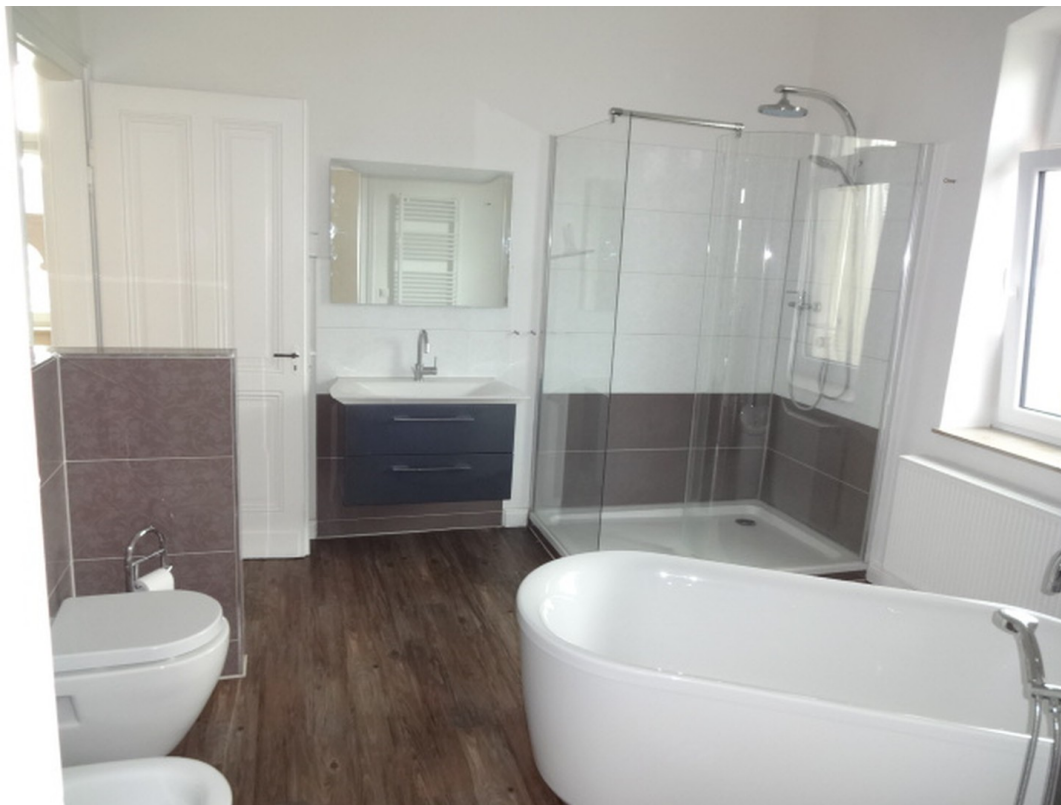
Hauptbad im Obergeschoss