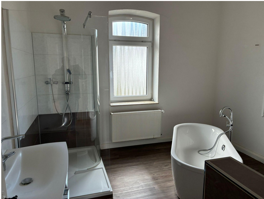
Hauptbad im Obergeschoss