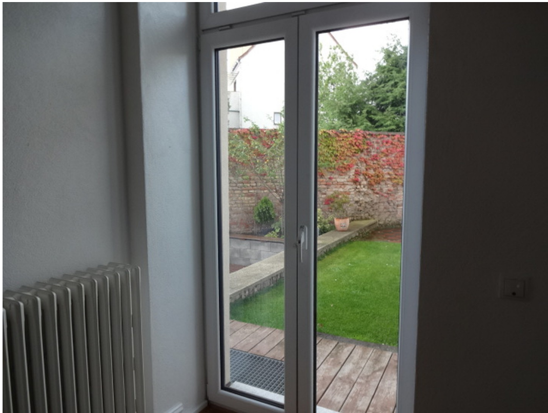
Blick aus der Küche