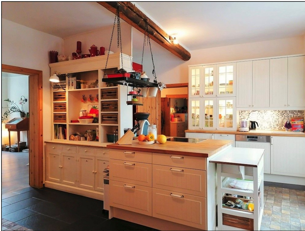
Komplett ausgestatte Küche