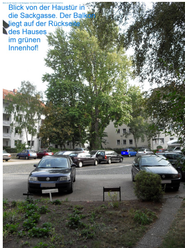
vor dem Haus