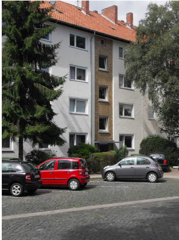
Ansicht Haus von vorn