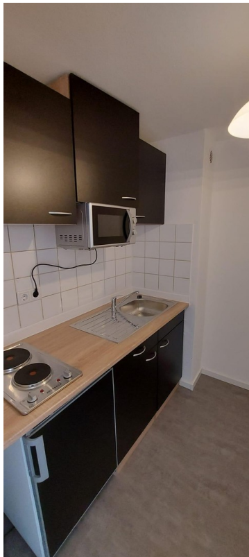
Küche zzgl. 40,00 Euro mtl.