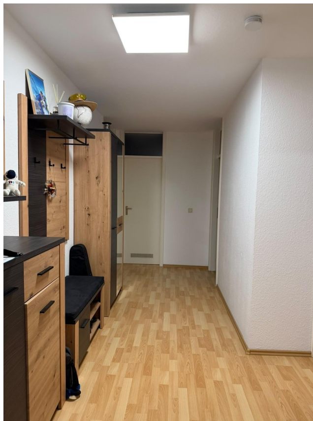
Flur- und Eingangsbereich