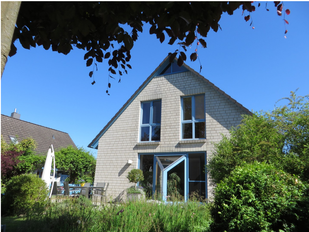
Blick v. Rondell mit Blutbuche