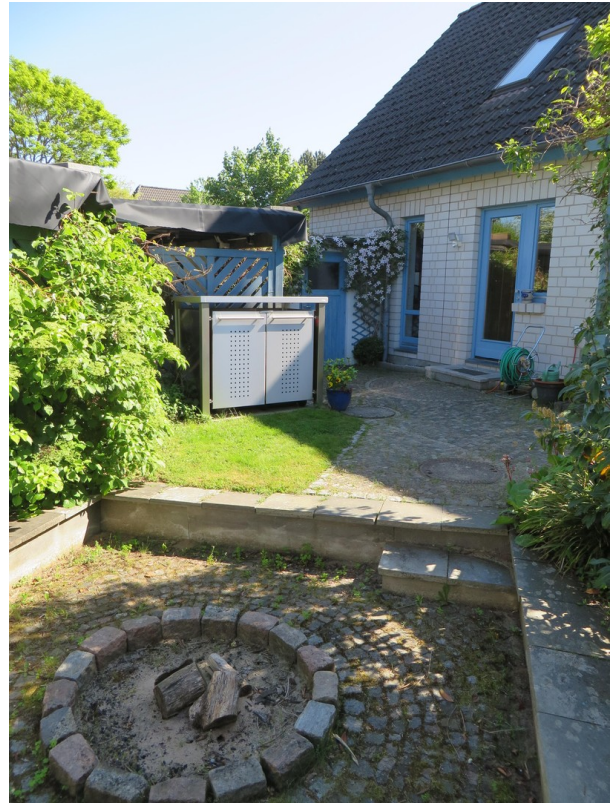
Innenhof m. Feuerstelle - West