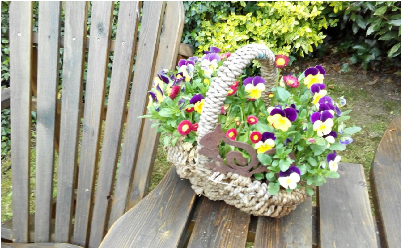
Vielen Dank für Ihr Interesse