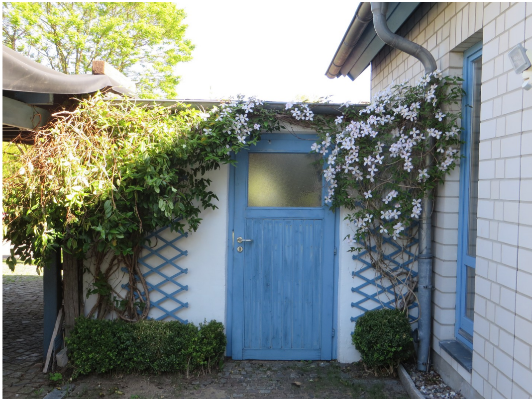
Innenhof - Abstellraum