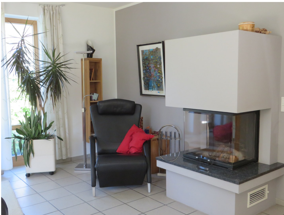
Wohnzimmer - Kaminecke