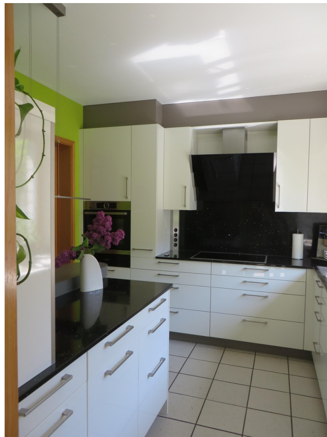
Küche - Blick v. Essbereich