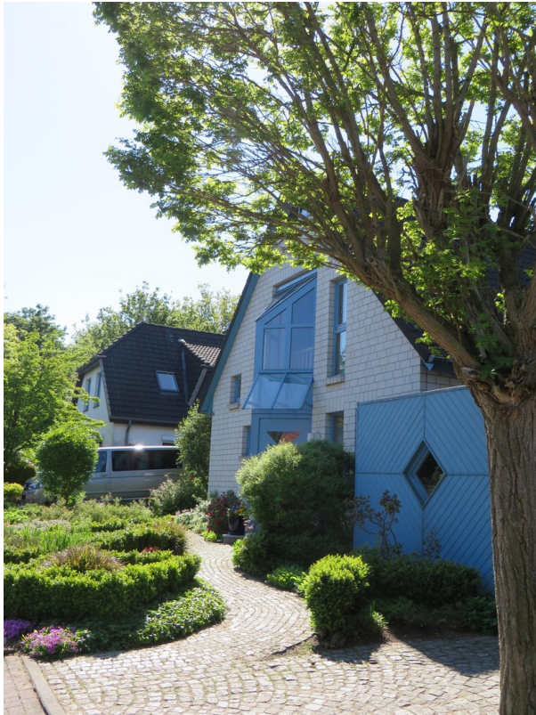
Blick von der Auffahrt