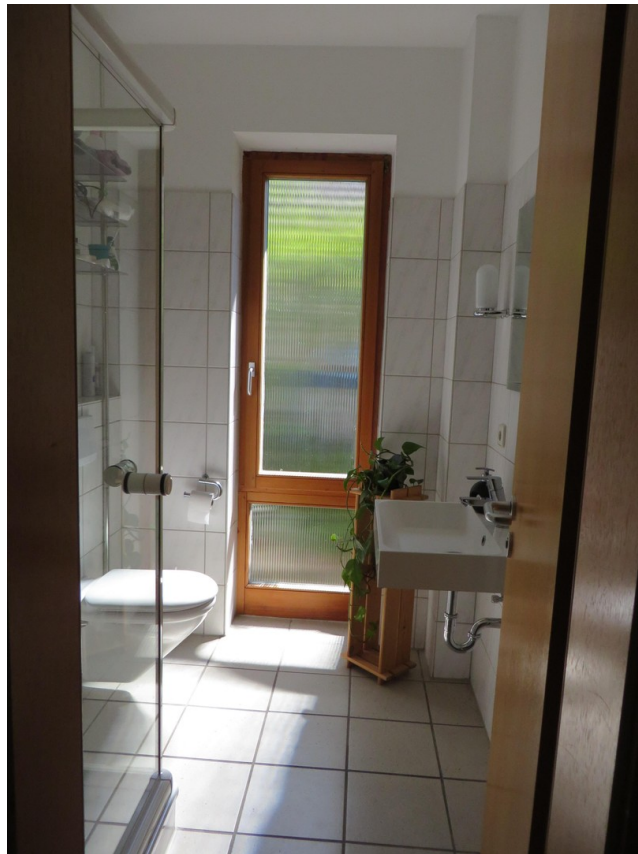
Gäste WC , EG