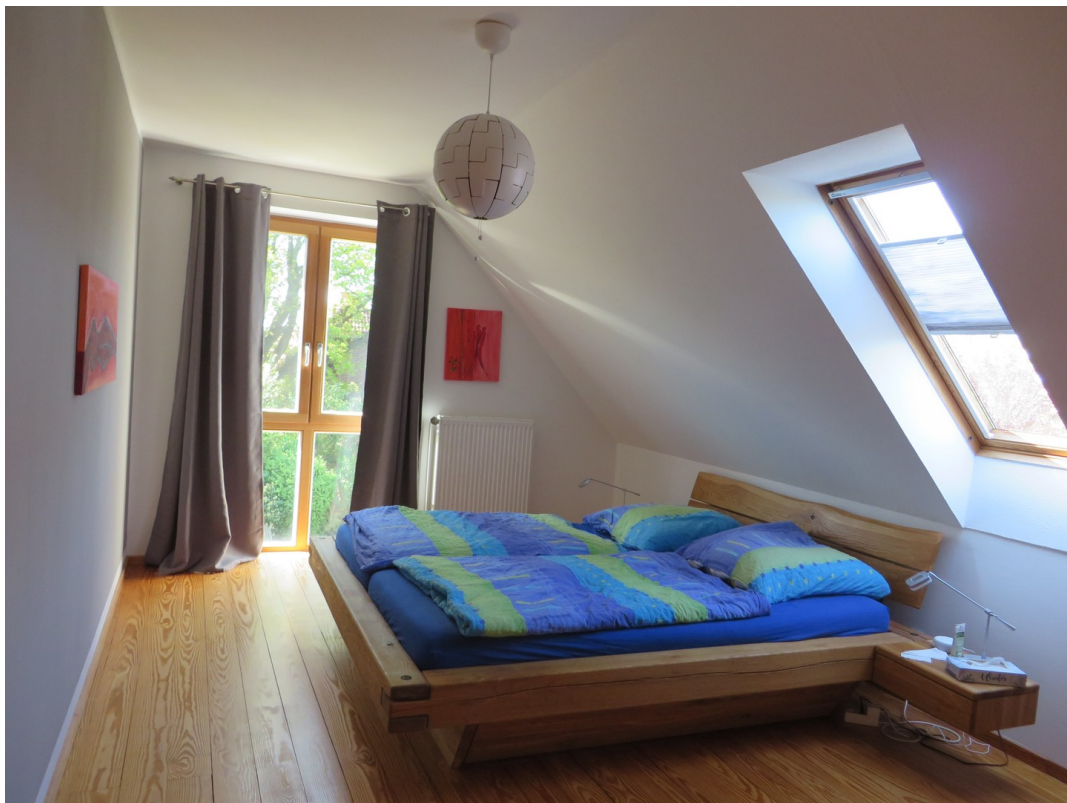
Zimmer 2 OG, Süden