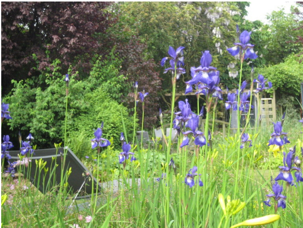
wenn die Lilien blühen