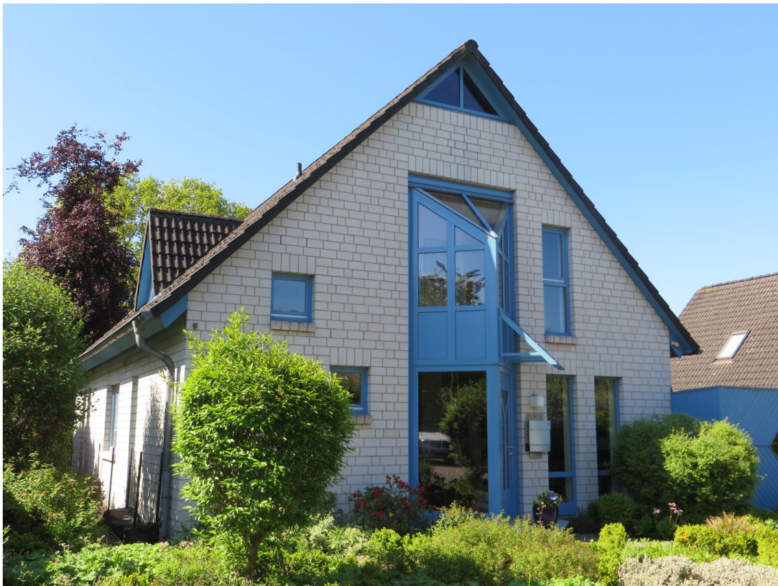
Nord / Ostseite