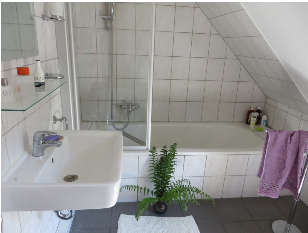
Bad OG, Osten