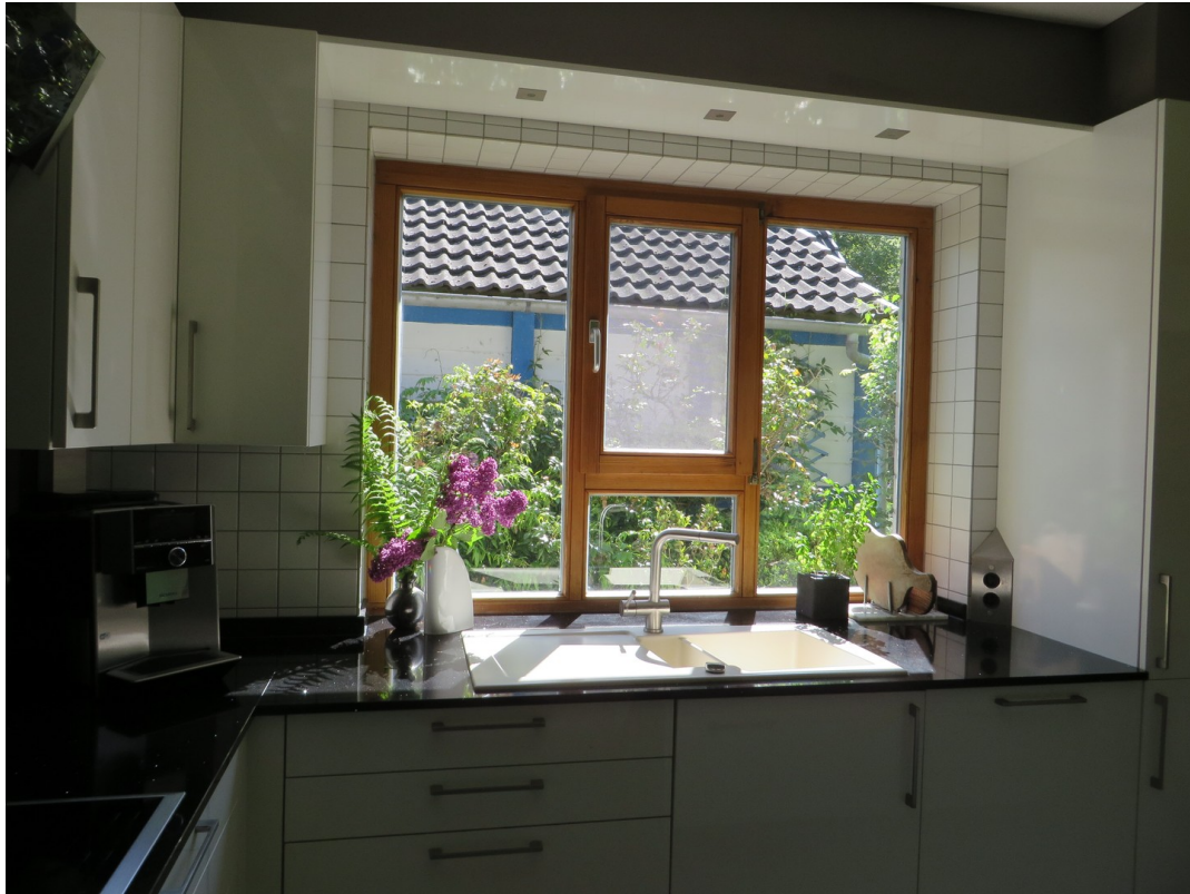
Küche - Blick gen Osten