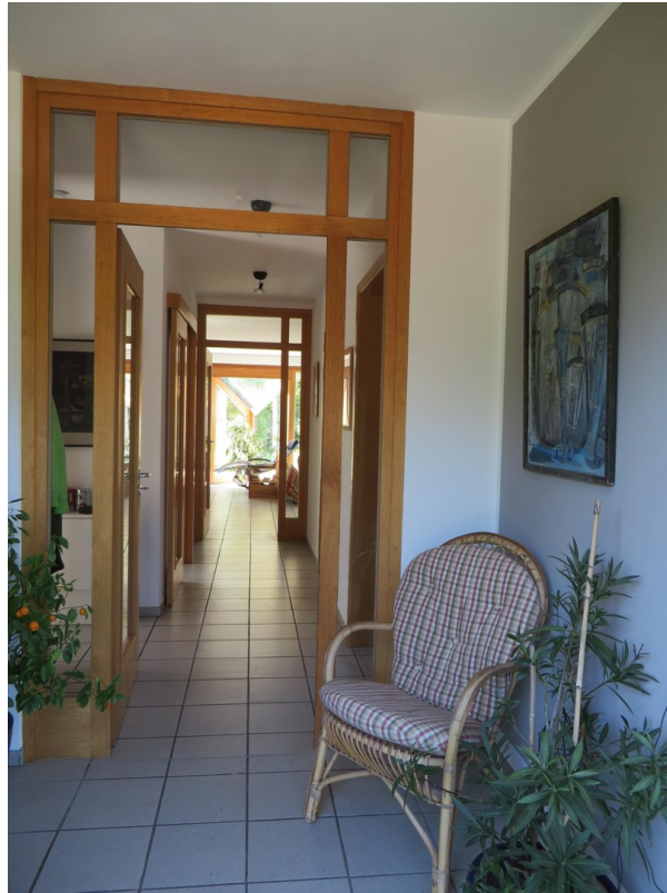
Eingang - Vorraum - Flur