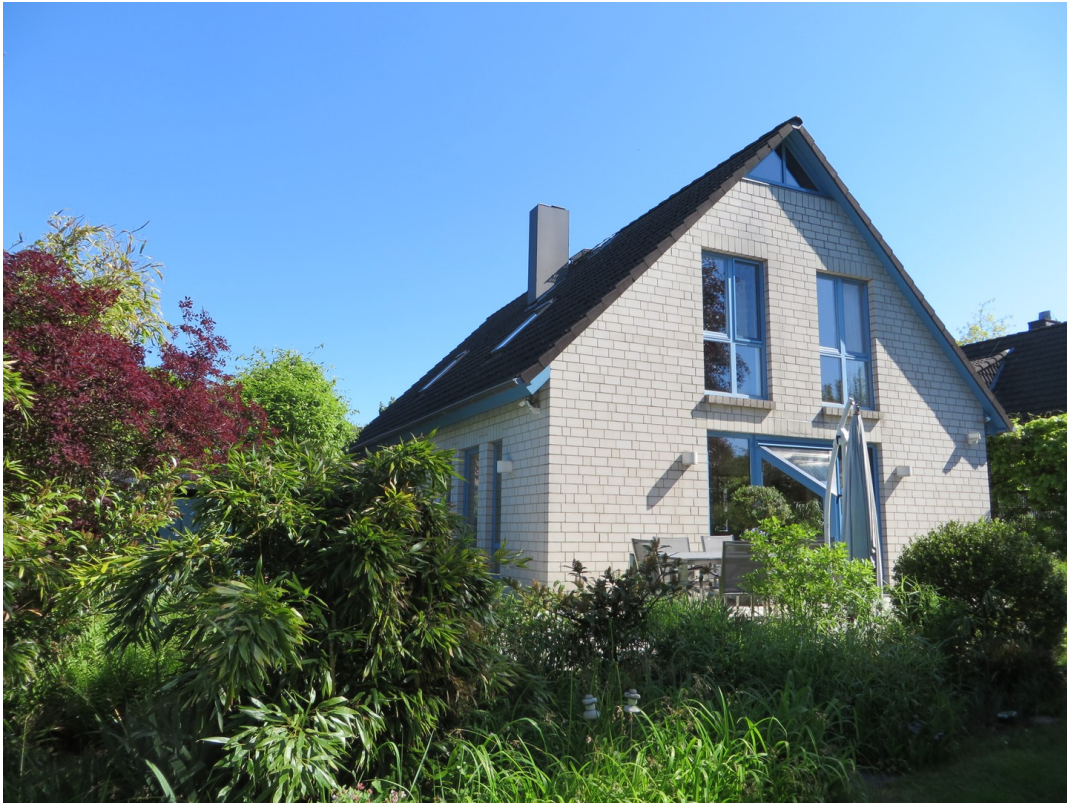
Süd- u. Westseite