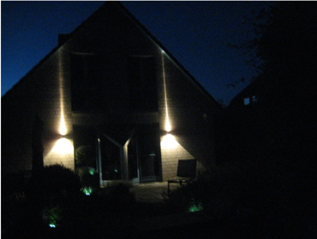
Eleganz und Romantik