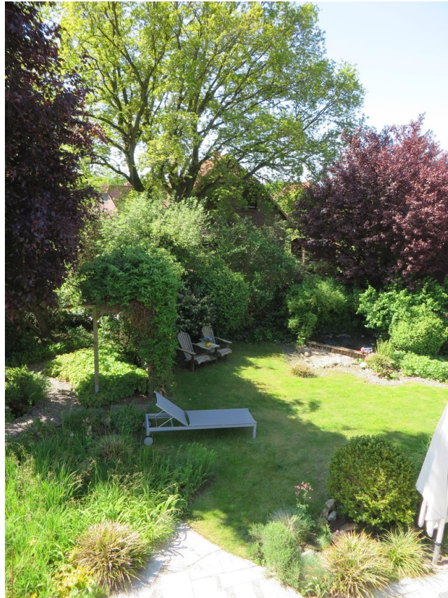
Blick in Südgarten