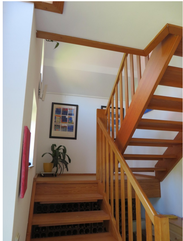
Vollholztreppe zum OG