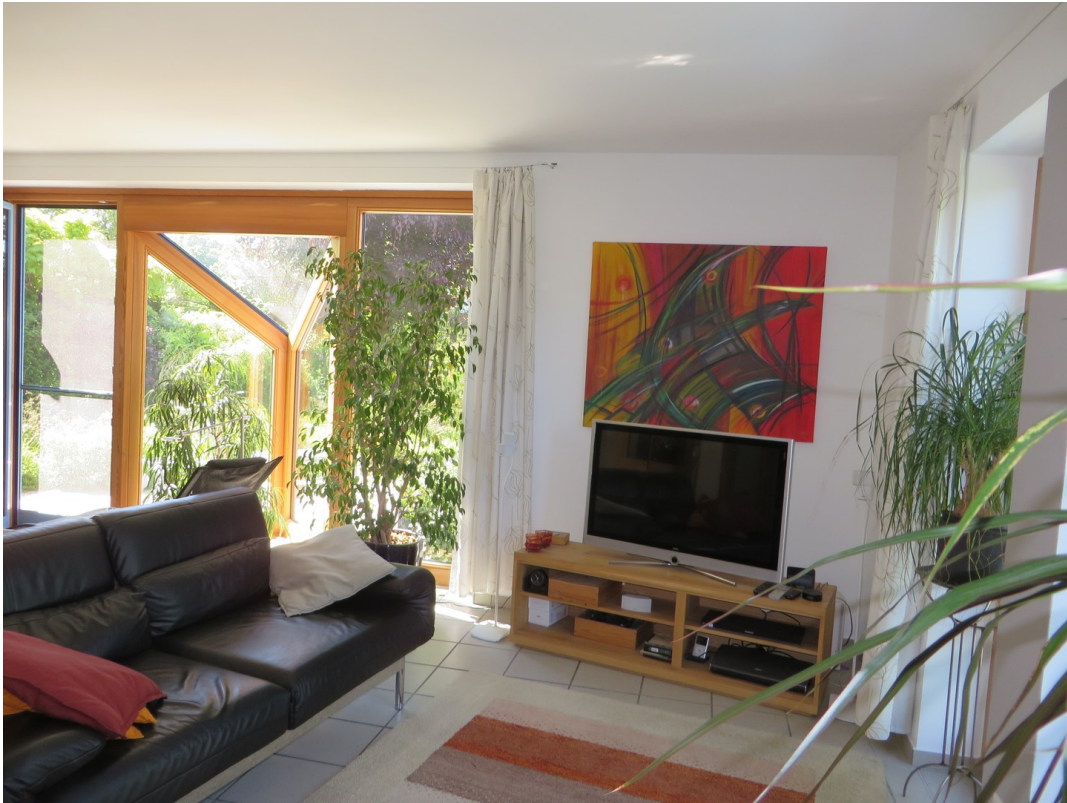
Wohnbereich, Süd + West