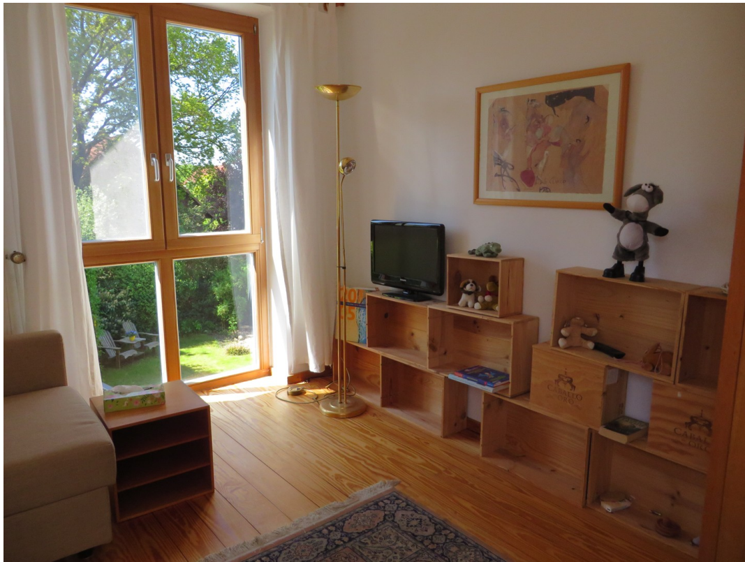
Zimmer 1 OG, Süden