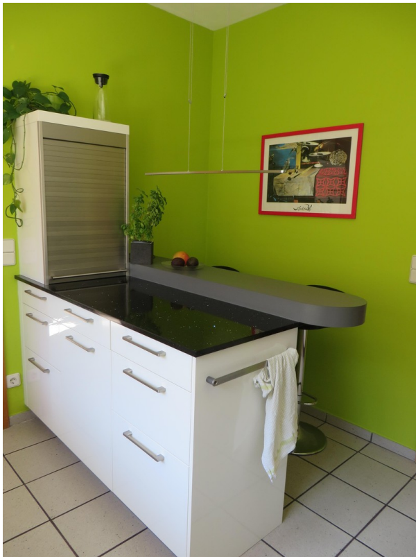
Küchenblock mit Tresen