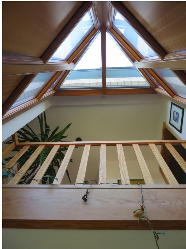
Eingang - von unten nach oben