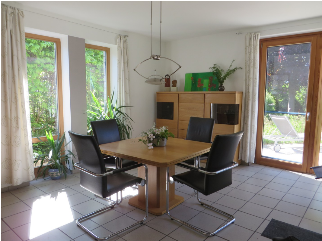
Essbereich - Ost u. Süd