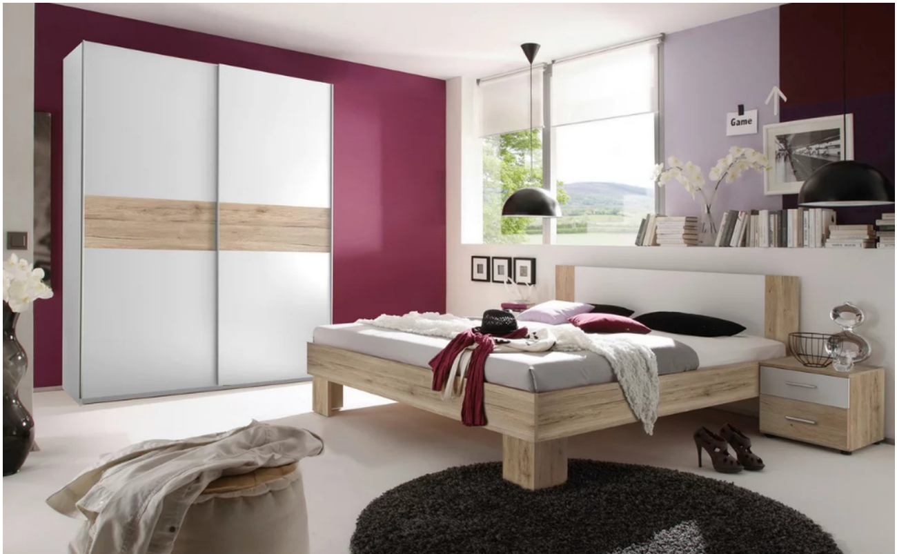
Bett in Schlafzimmer