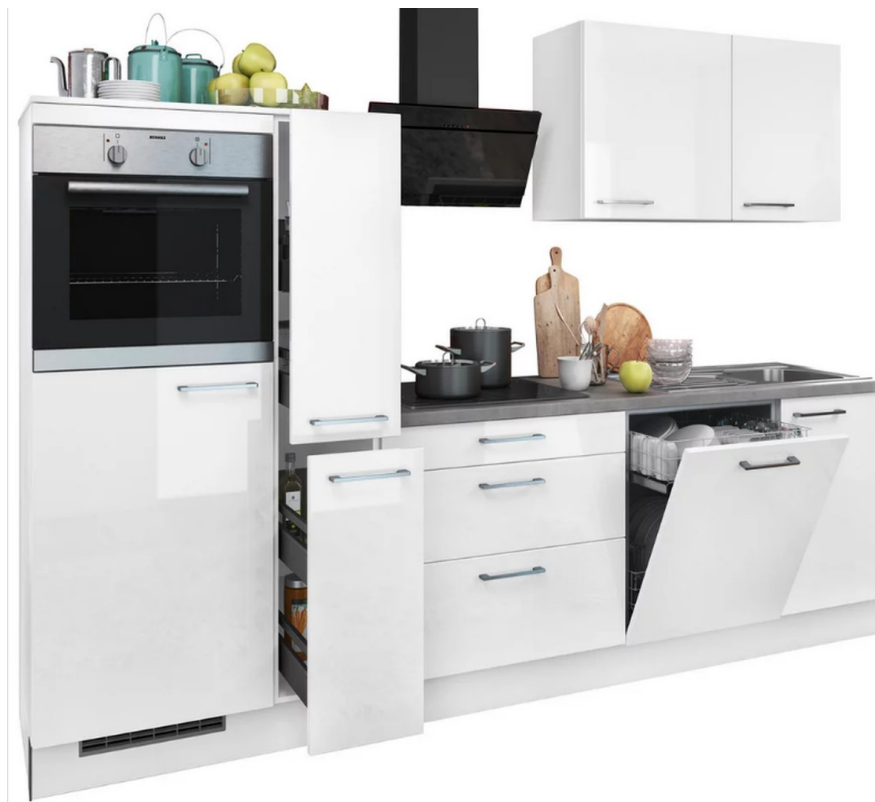
moderne Küche-> Geschirrspüler