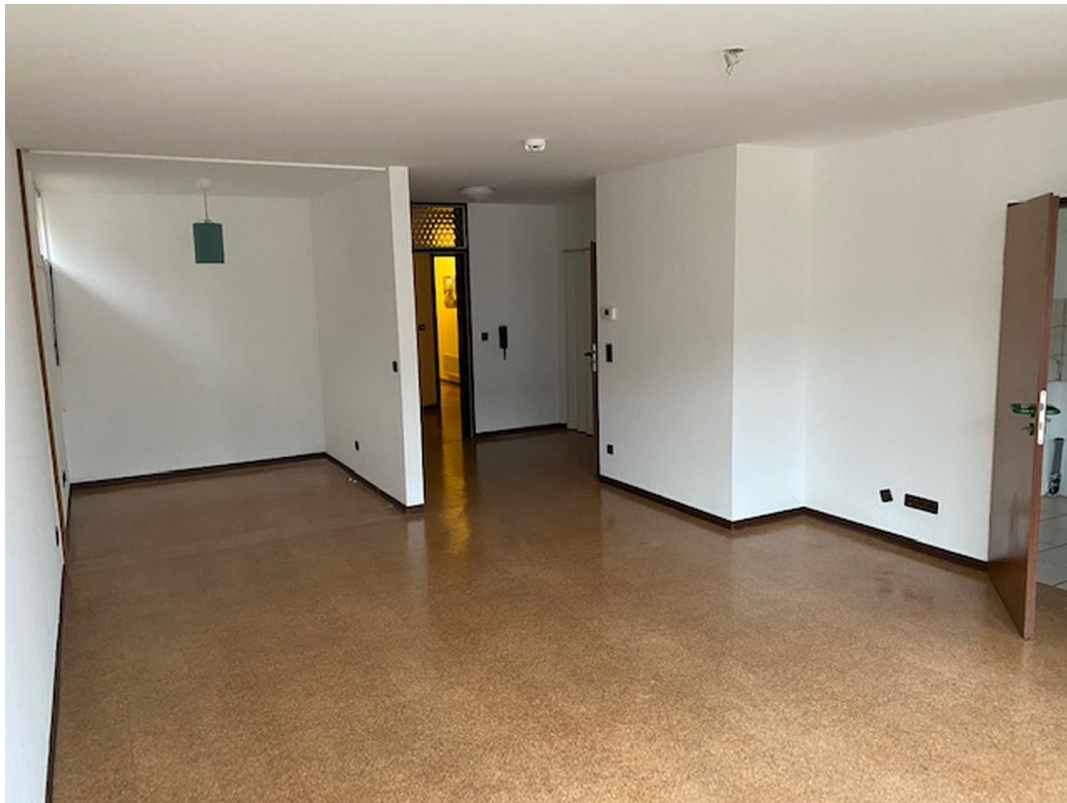
Beispiel 1,5-Zimmer Apartment