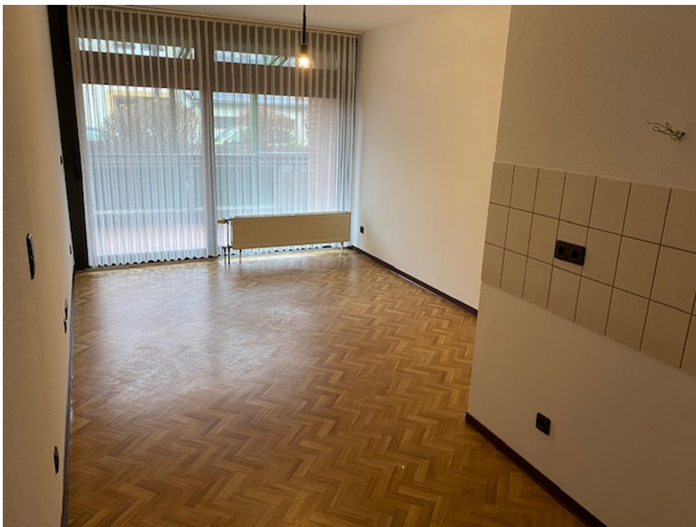
Beispiel Apartment unmöbliert