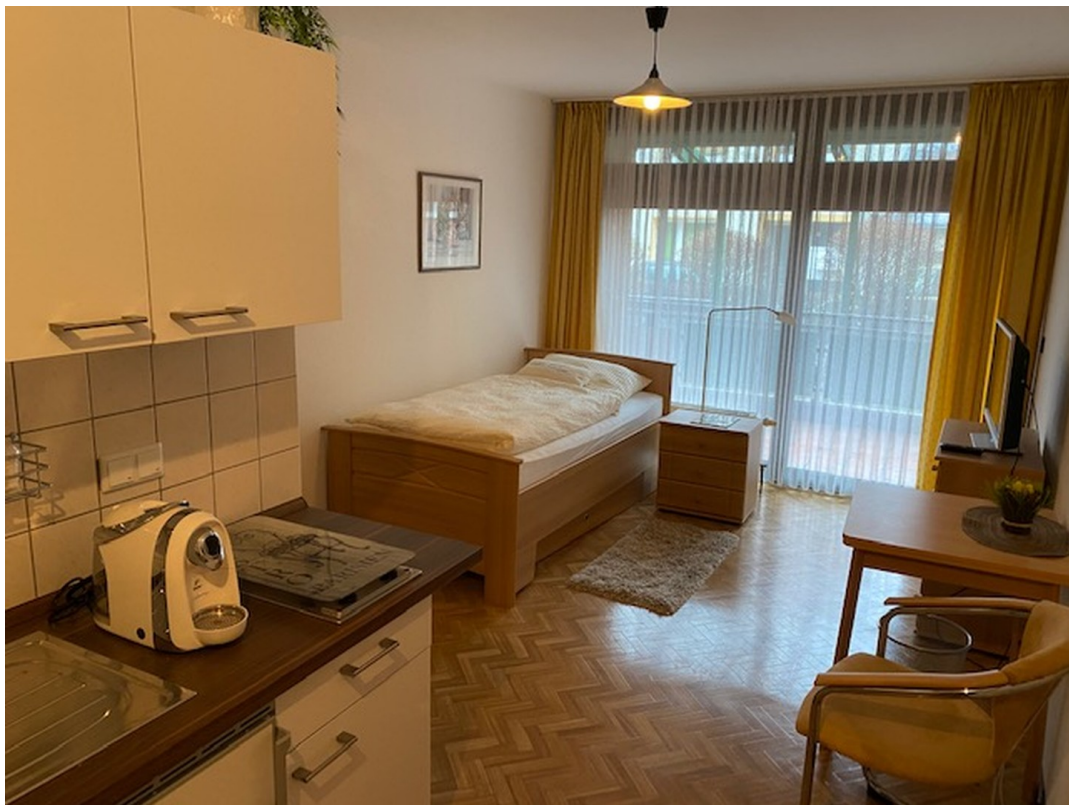
Beispiel Apartment möbliert