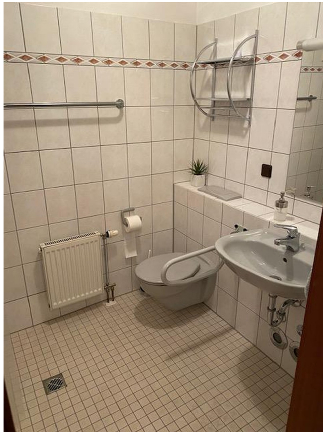
Beispiel Badezimmer Apartment