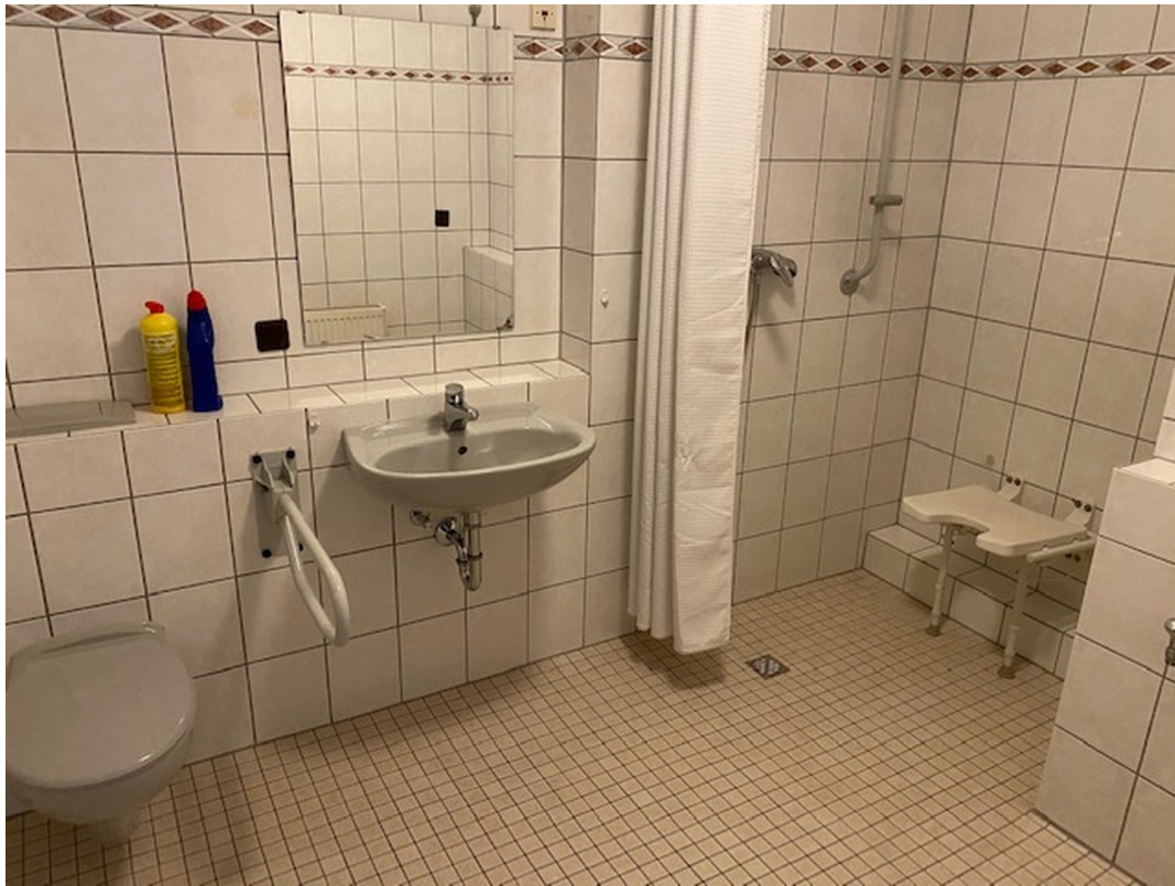
Bad 1,5-Zimmer Apartment