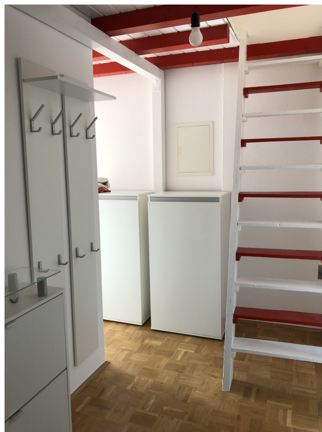
Garderobe, Aufgang Empore