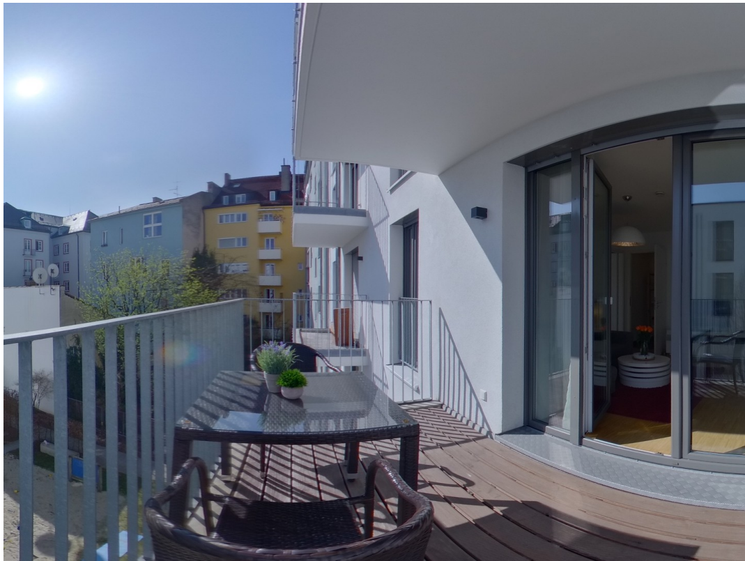
Balkon zum Innenhof