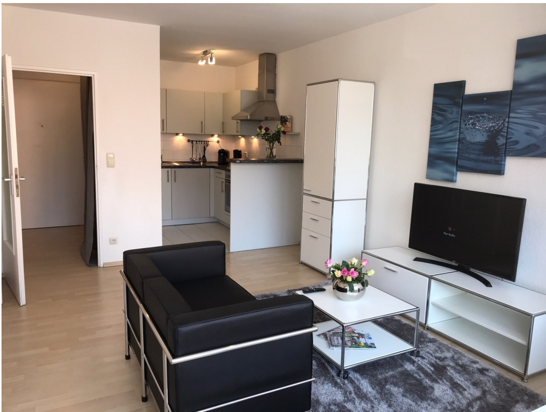
Blick vom Fenster