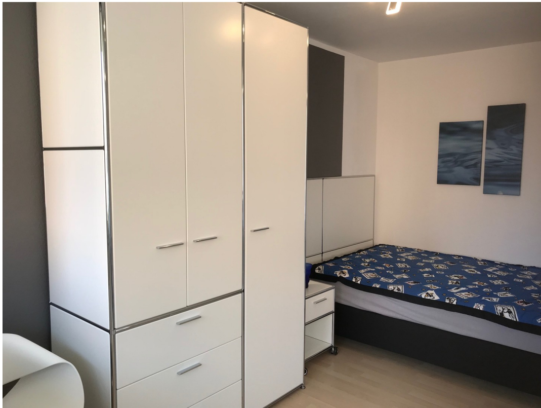
Blick ins Schlafzimmer