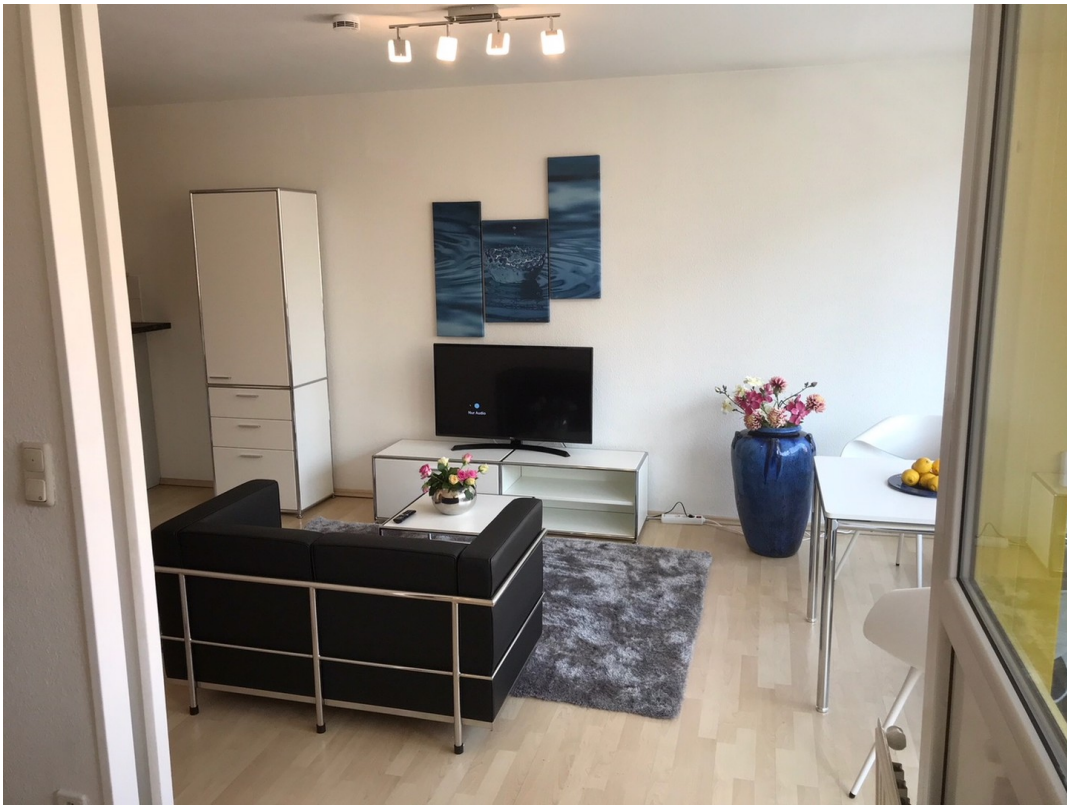
Blick vom Schlafzimmer