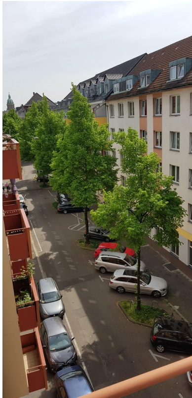
Fully furnished apartment