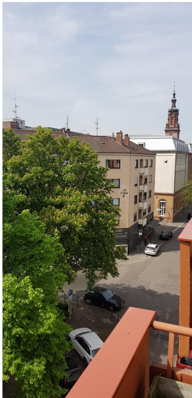
Mannheim City apartment