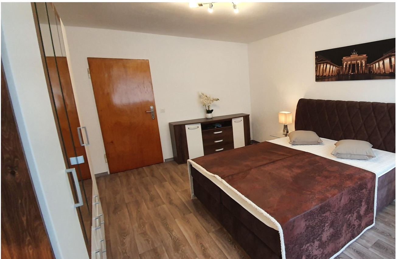
Bedroom with a double bed