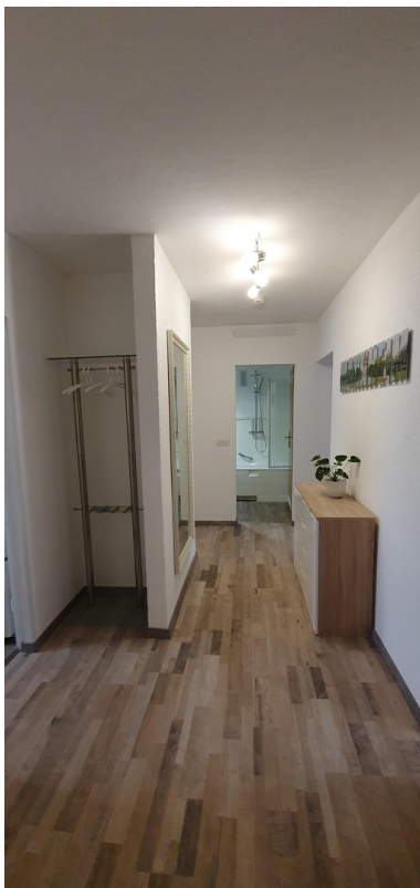
Furnished Apartment Mannheim