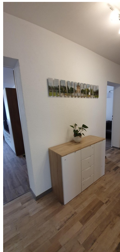
Wohnen auf Zeit Mannheim