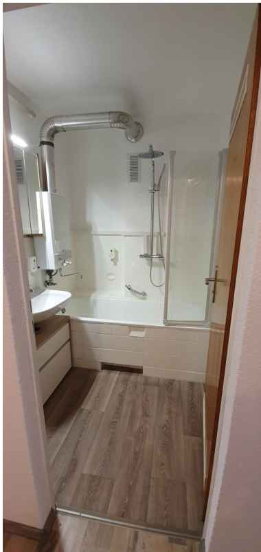
Bad / Bathroom