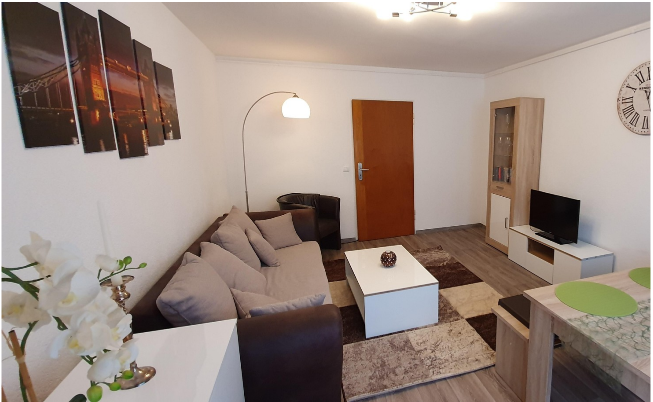
Bedroom sofa sleeping function