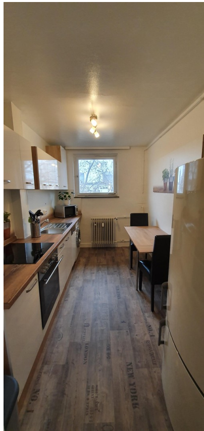
Küche / Kitchen