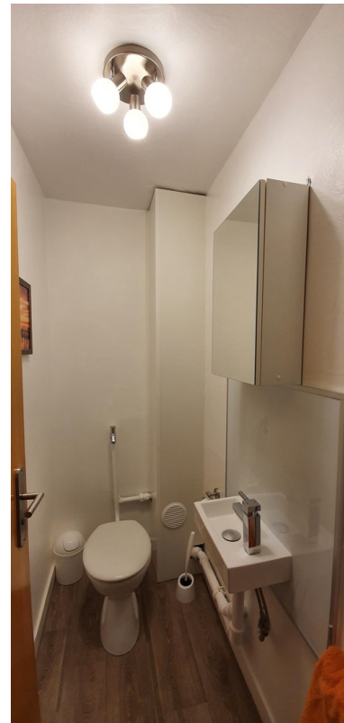
Toilette / Toilet