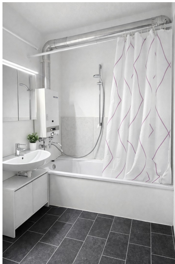
Bad / Bathroom