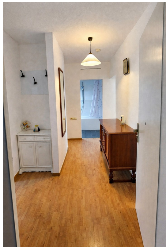
Furnished Apartment Mannheim