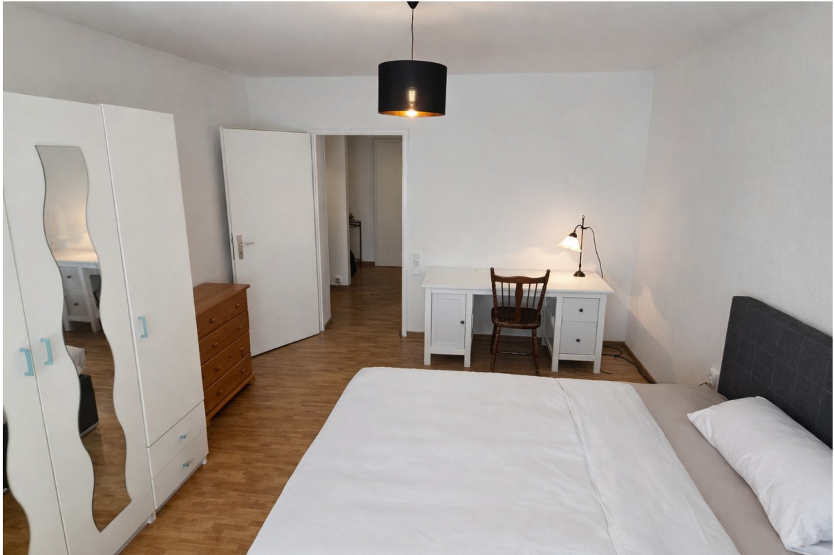
Bedroom with a double bed