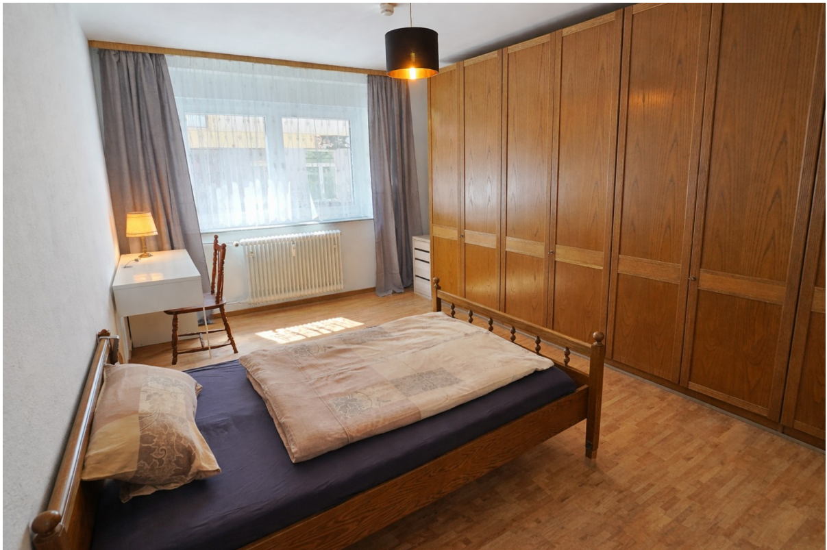
Schlafzimmer mit einem Bett