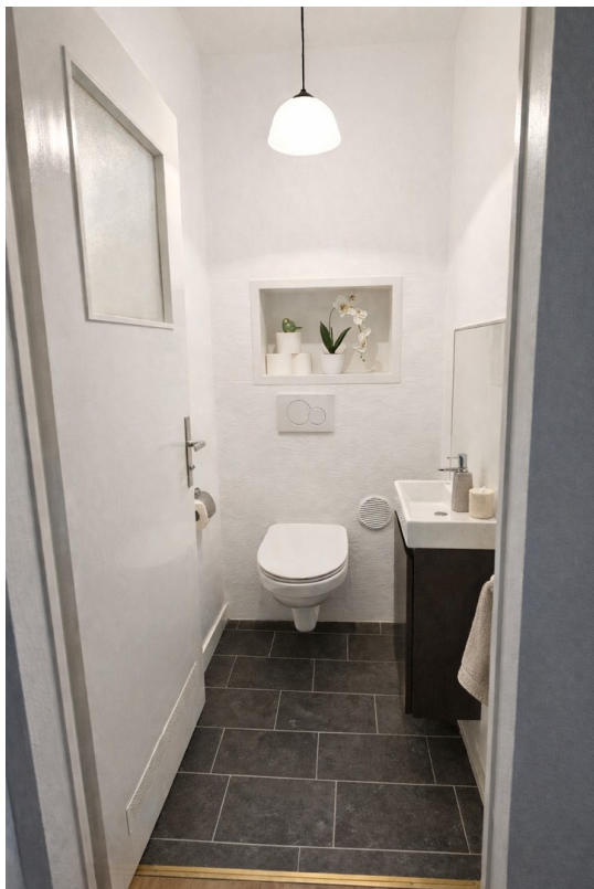
Toilette / Toilet