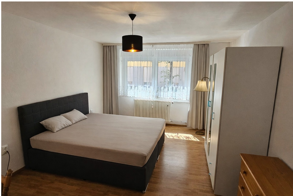
Schlafzimmer mit Doppelbett