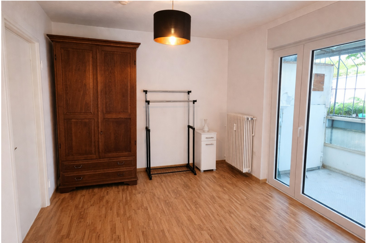
Wohnen auf Zeit Mannheim