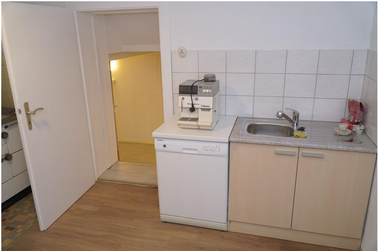
Küche in OG