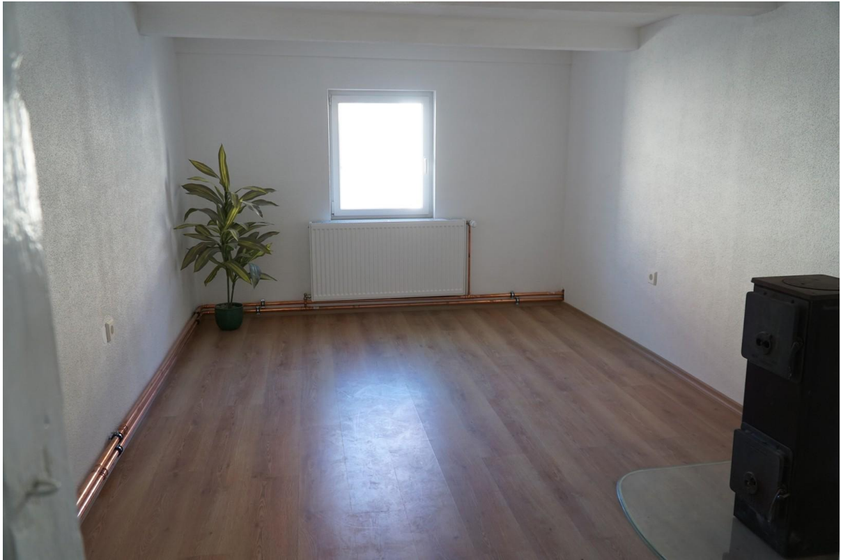
Schlaf-/Kinderzimmer in OG