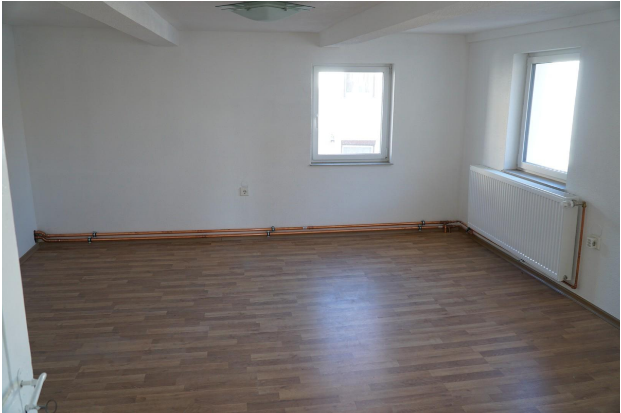
2. Schlaf/Kinderzimmer in OG