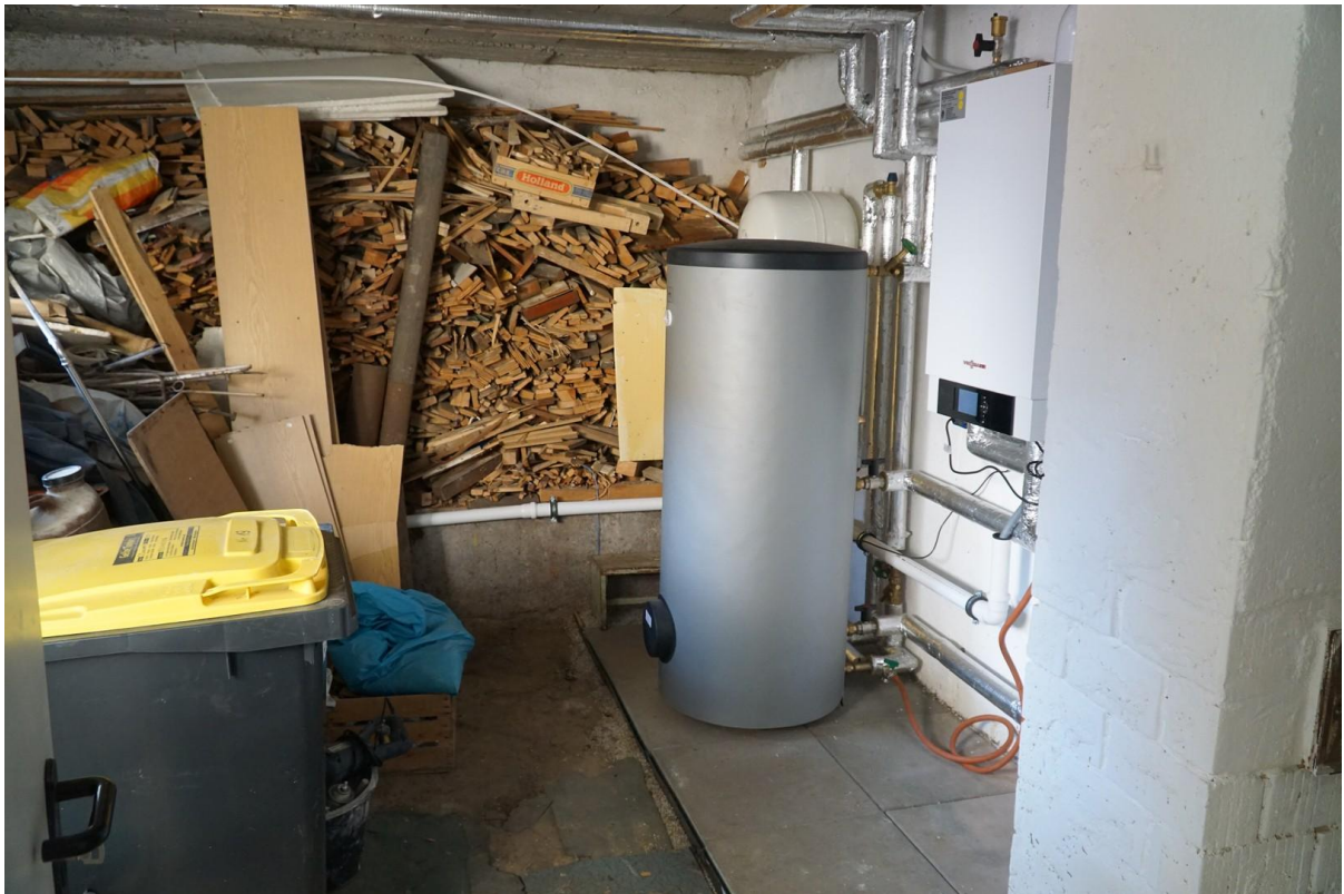
Abstell- und Technikraum