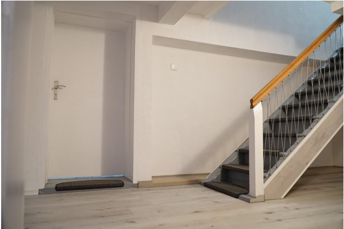
Treppe und Tür richtung Bad