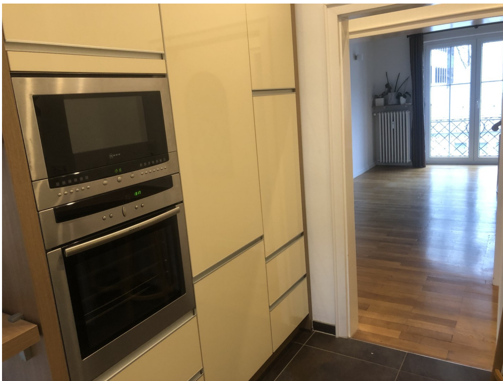
Küche 1. OG