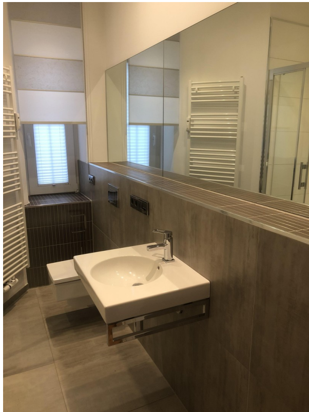
Badezimmer 1. OG