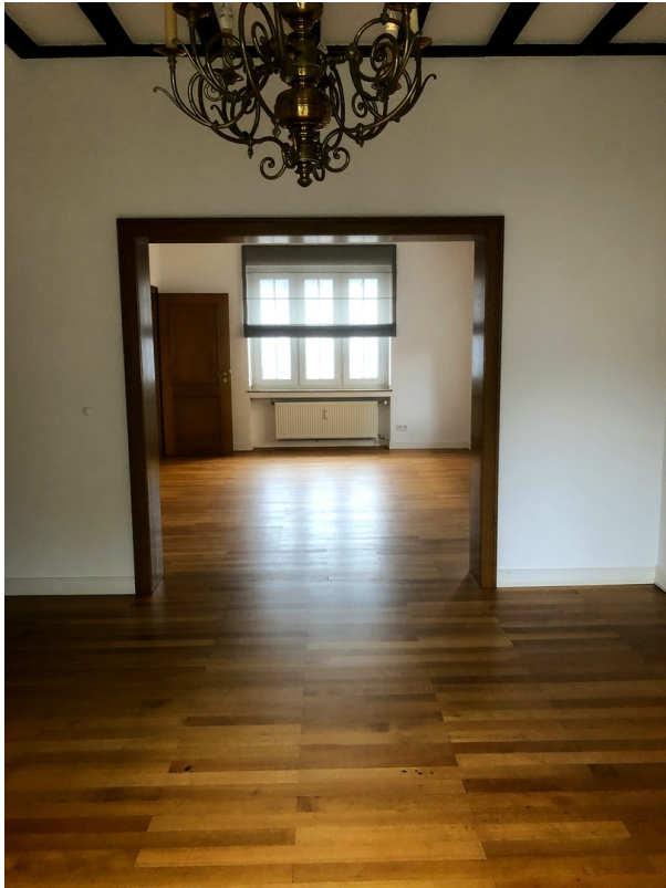
Wohn-/Esszimmer 1. OG