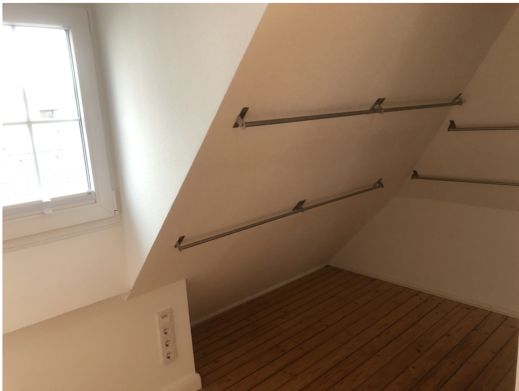
Elternschlafzimmer 2. OG(4)