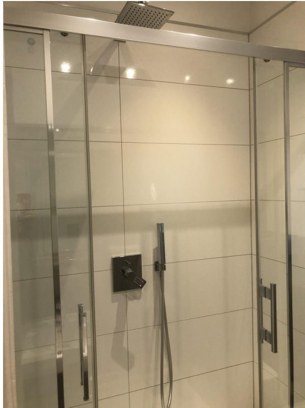
Dusche 1. OG