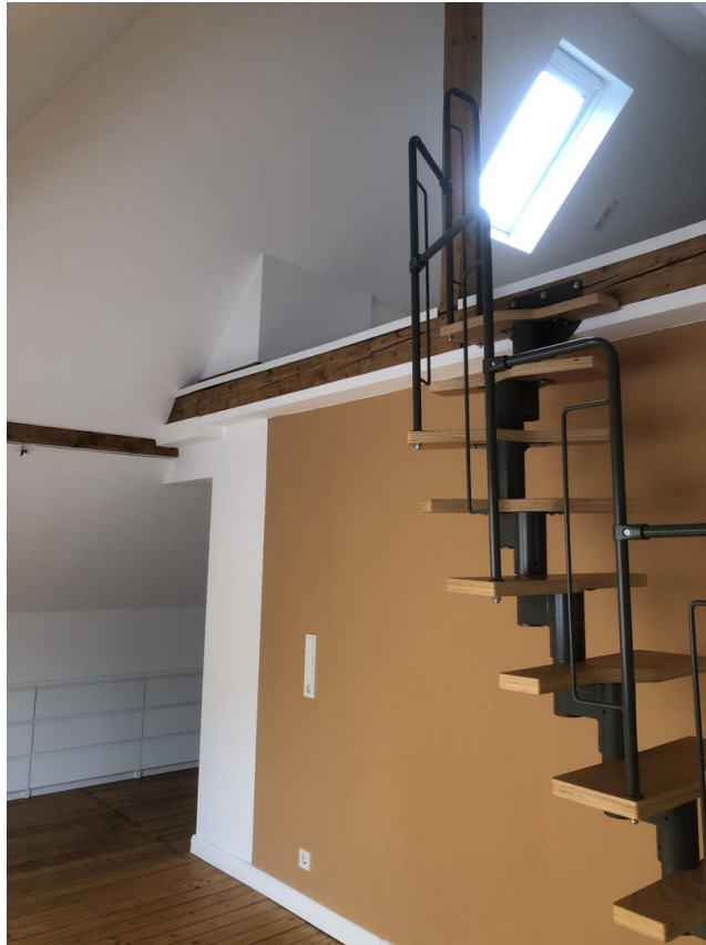
Treppe ins offene Dachgeschoss