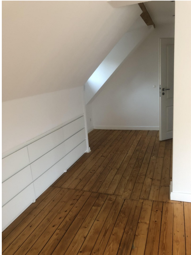
Elternschlafzimmer 2. OG (1)