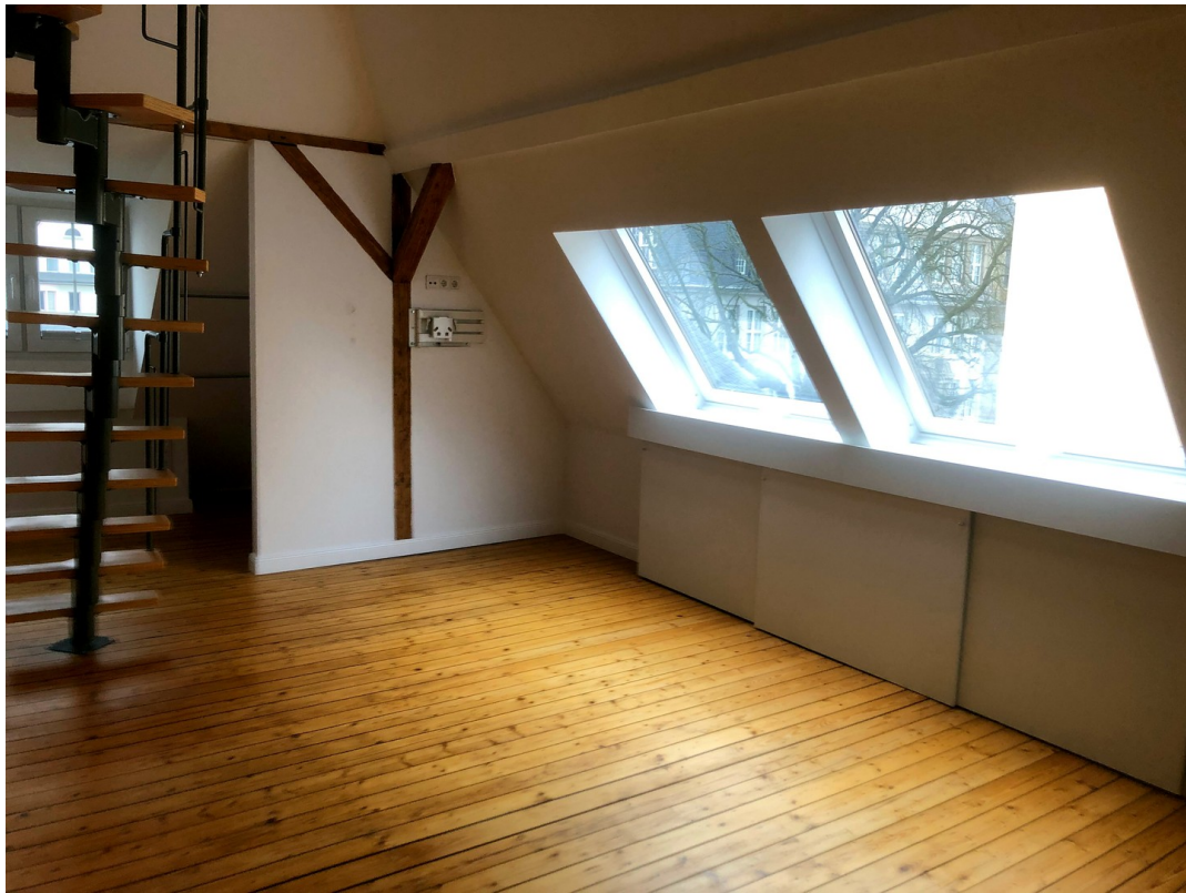
Elternschlafzimmer 2. OG (3)