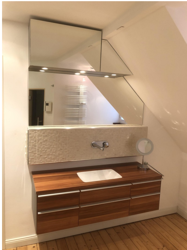
Familienbadezimmer 2. OG (2)