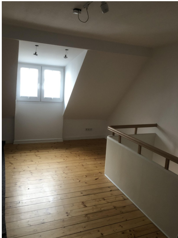
Diele 2. OG