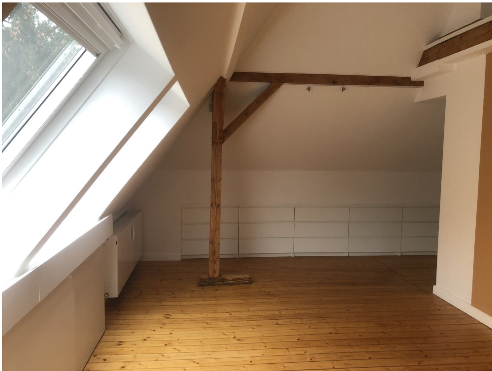
Elternschlafzimmer 2. OG(2)