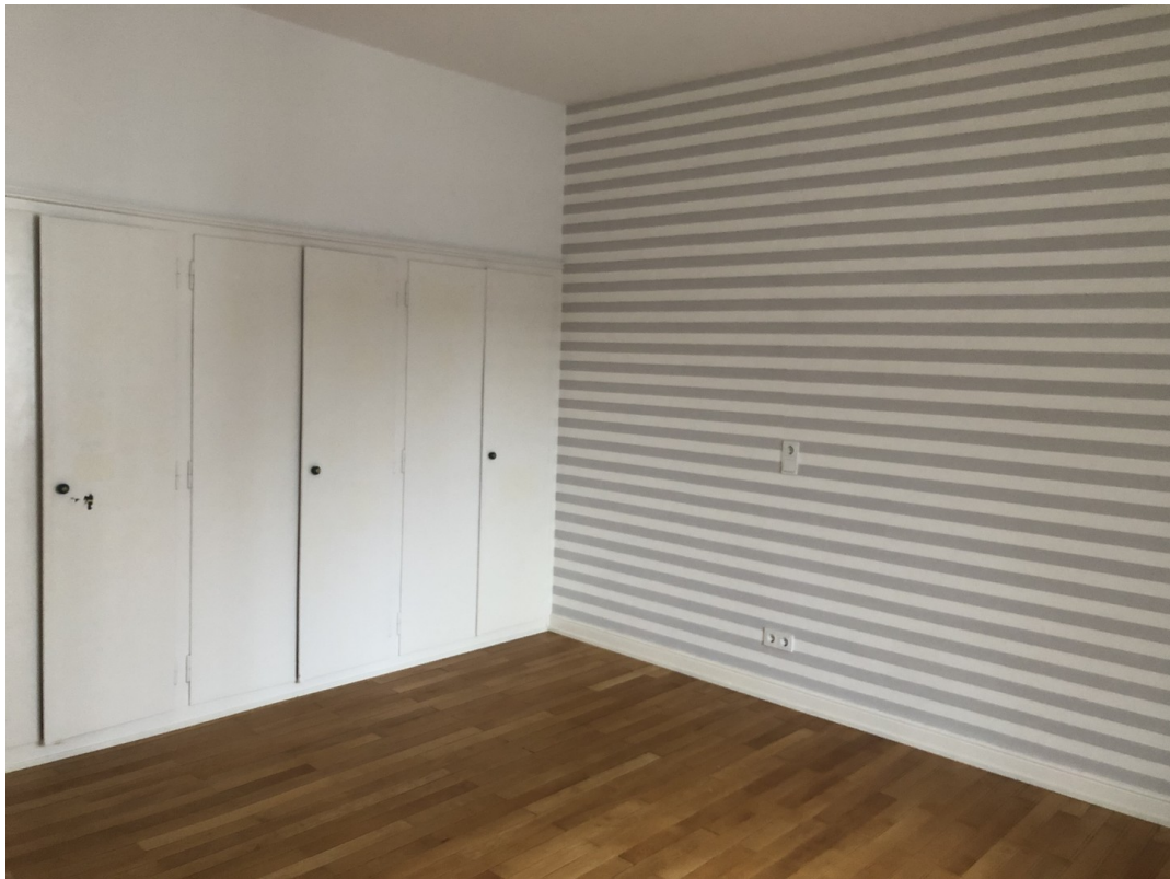
Kinderzimmer 1. OG