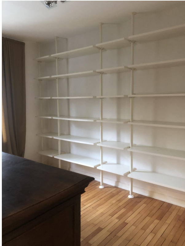
Ankleide/Büro 1. OG