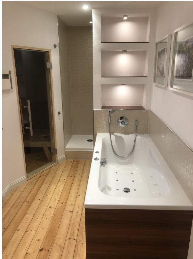
Familienbadezimmer 2. OG (1)