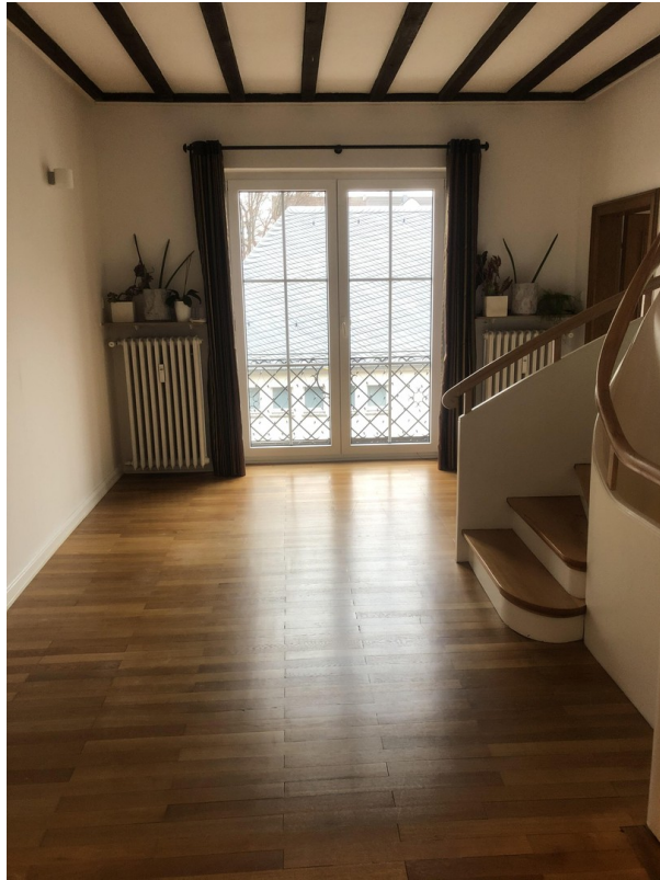
Diele 1. OG