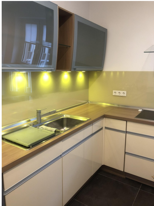
Küche 1. OG