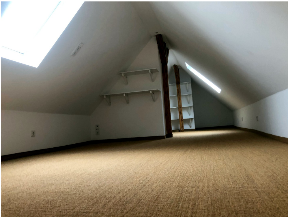
Dachgeschoss 3. OG