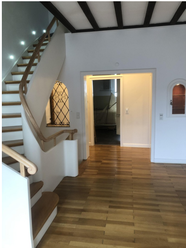
Treppe 1. OG