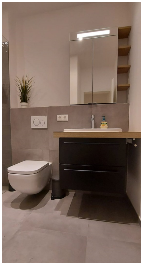
Badezimmer mit Schrank 1