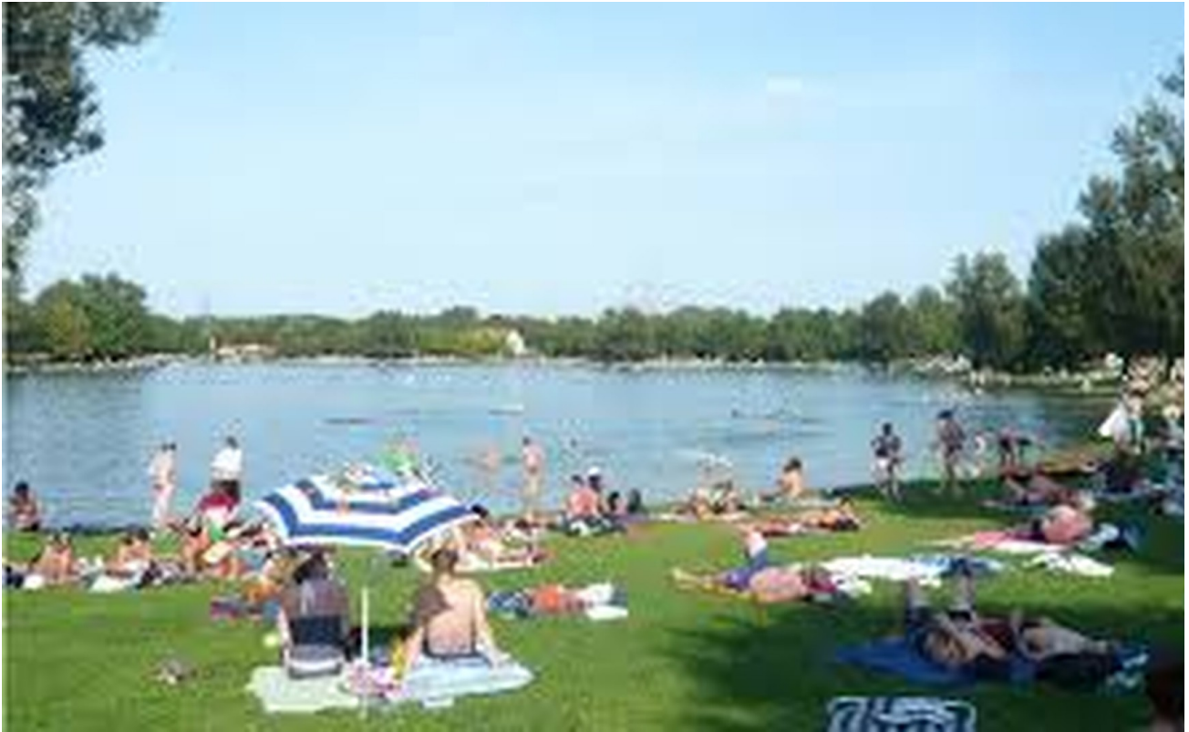
Feringasee 10 min. zu Fuß