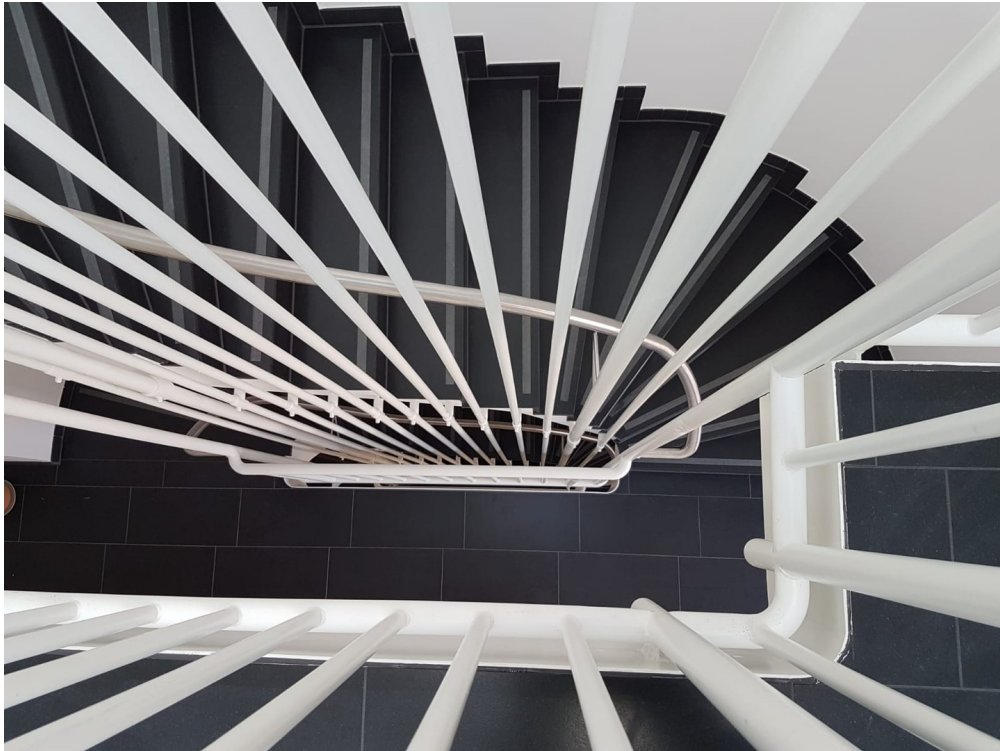
Treppenhaus Hohe Standard