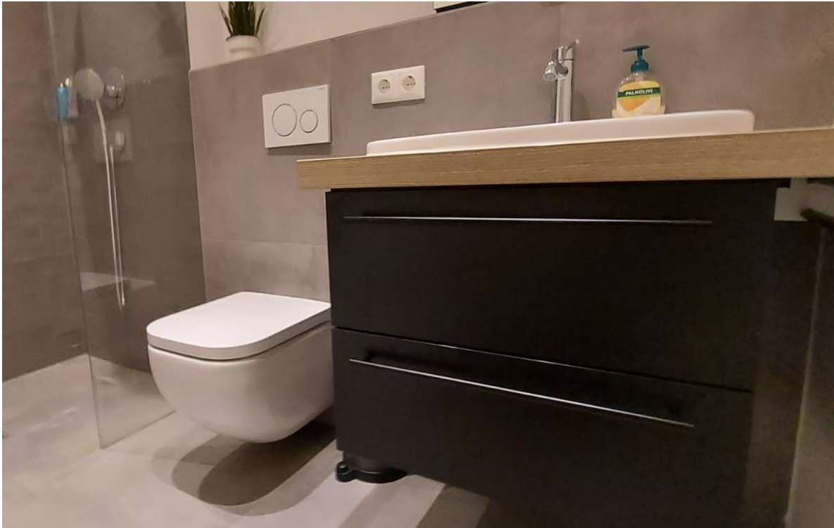
Badezimmer mit Schrank 2