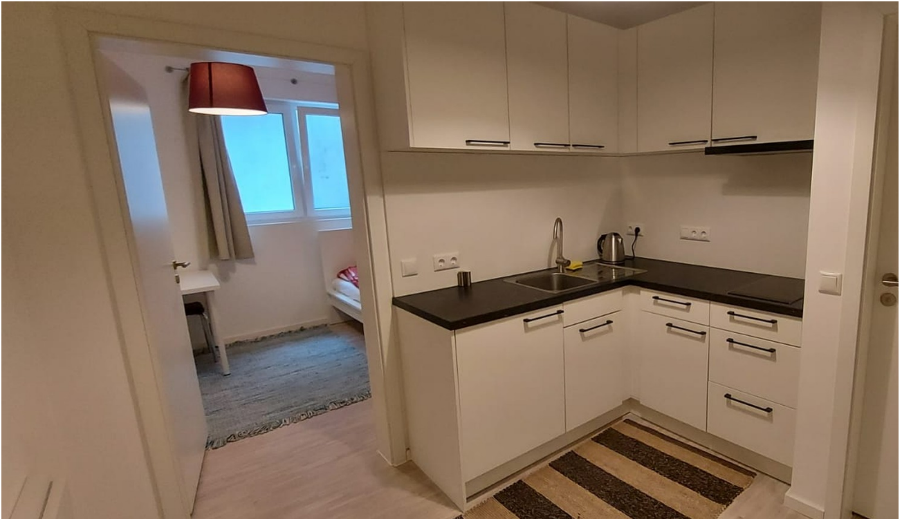
Einbau Küche 1