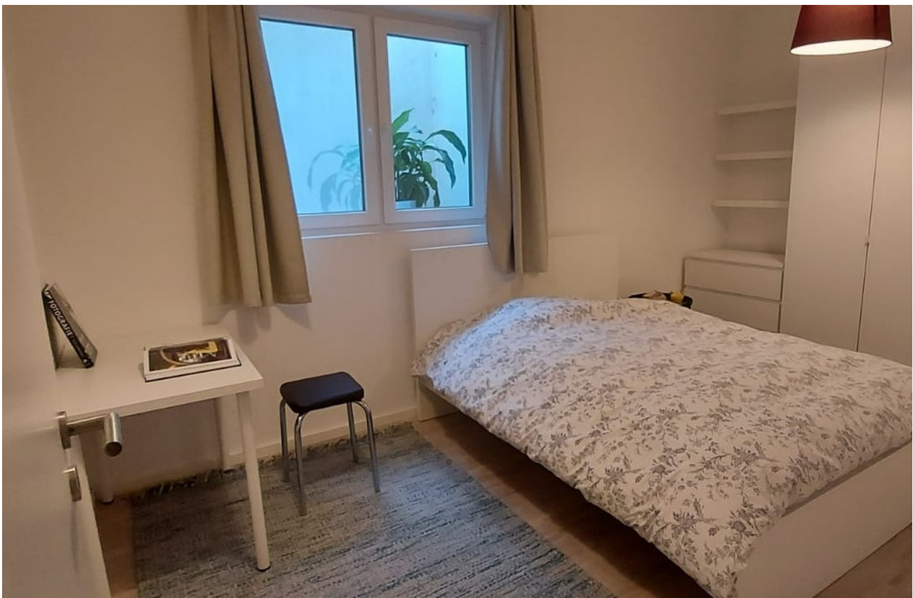
Bett 140 x 200 Große Schrank