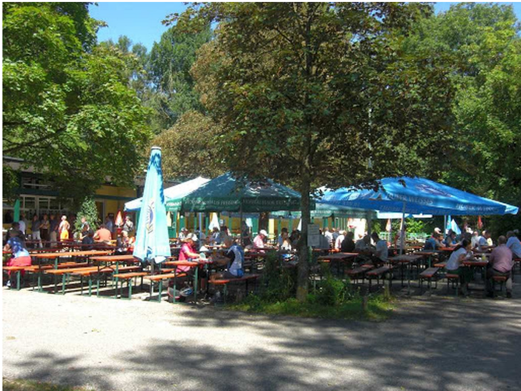
Poschingerweihe 5 min zu Fuß