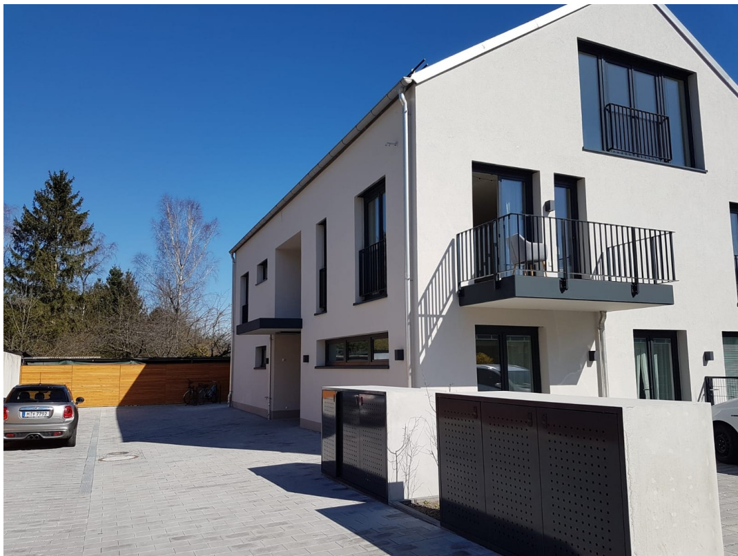
Haus von Außen 2