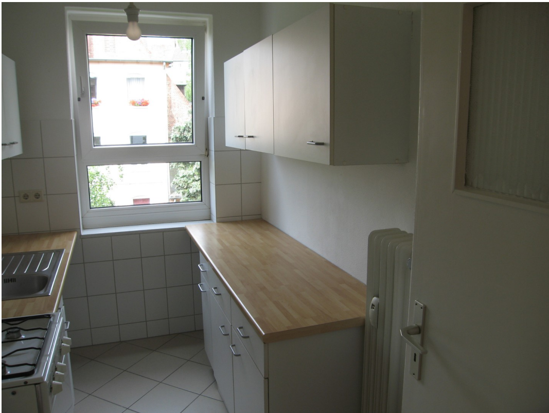
Einbauküche mit Gasherd