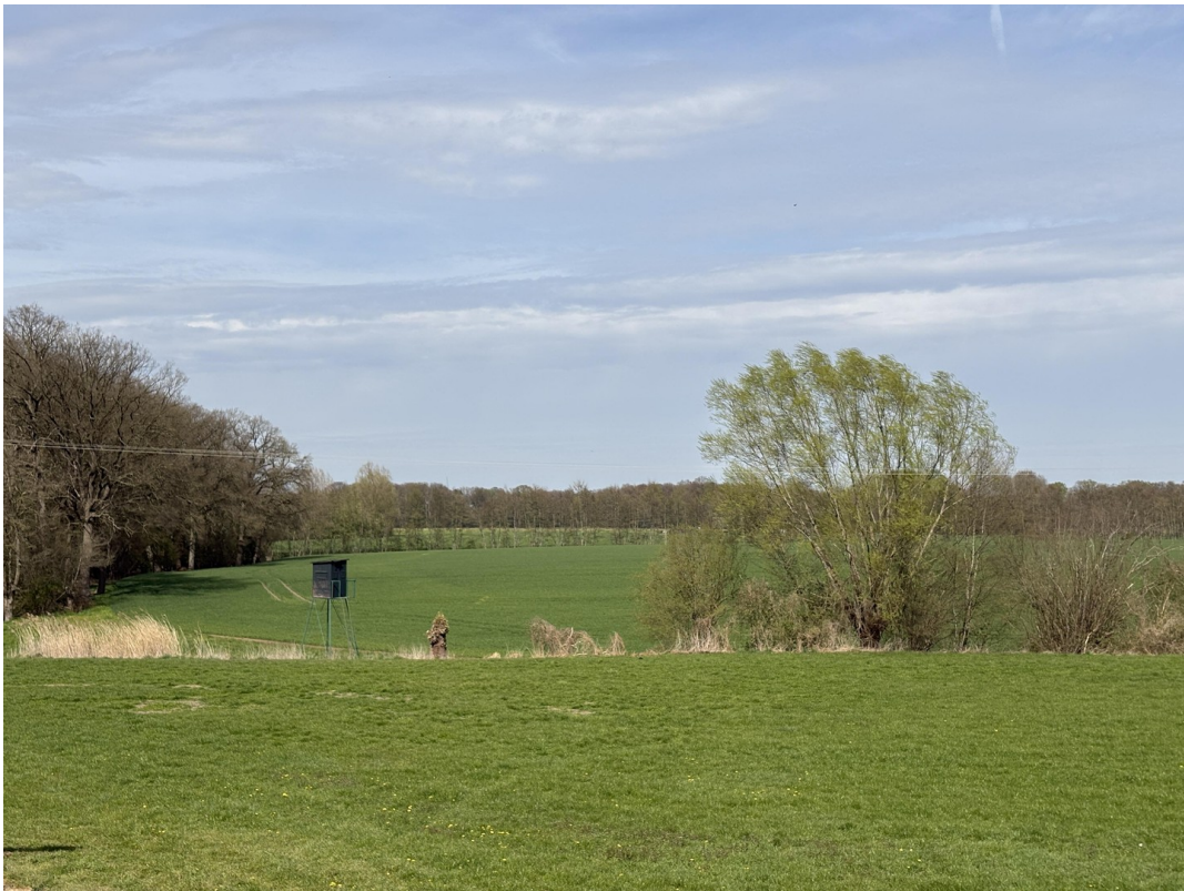
Fantastischer Blick ins Grüne