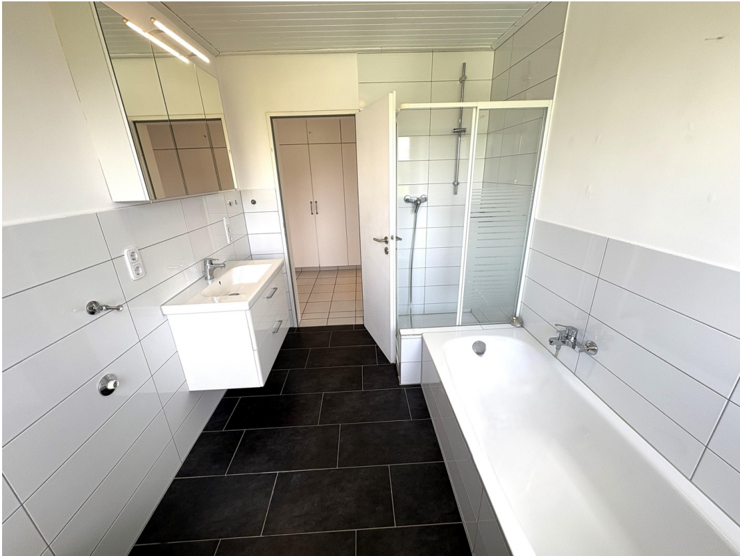
Blick in das neue Vollbad