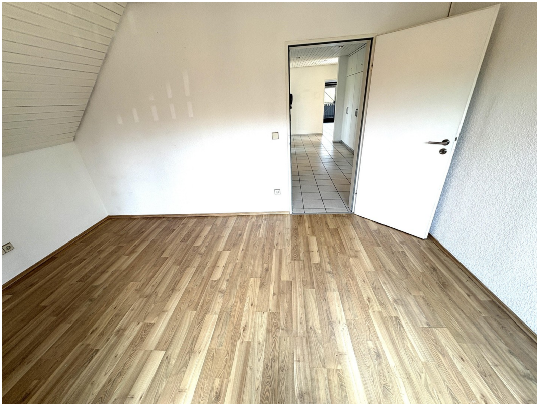
Gästezi. Blick z. Innenflur