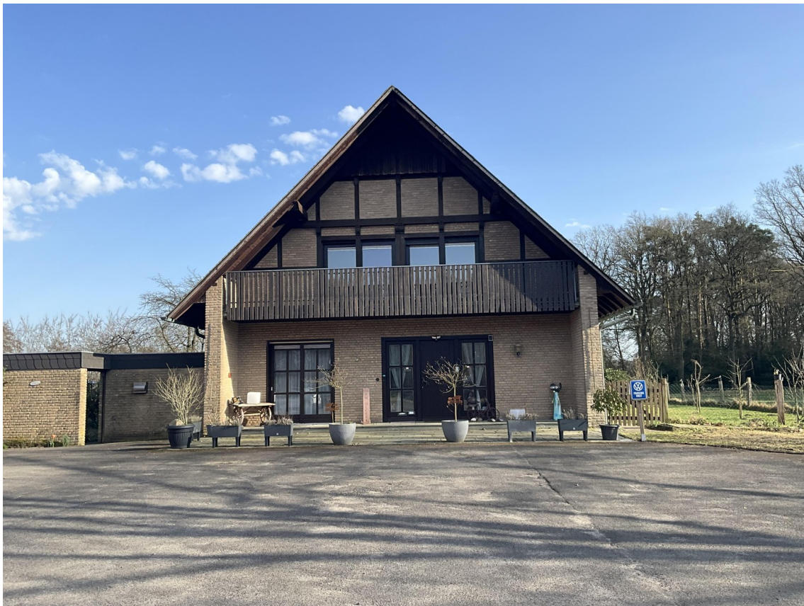
Hausansicht OG Woh.Südbalkon