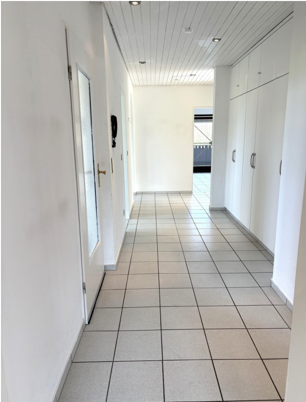
Heller Flur zu den Zimmern