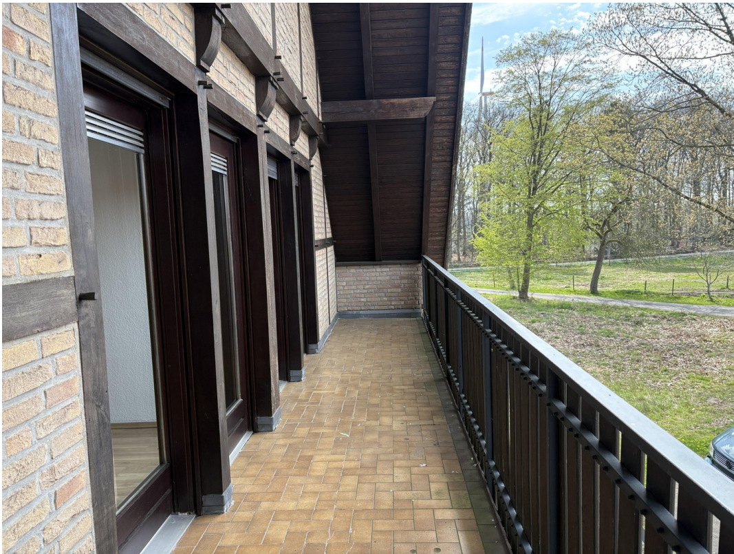
Balkonansicht zur Hofeinfahrt