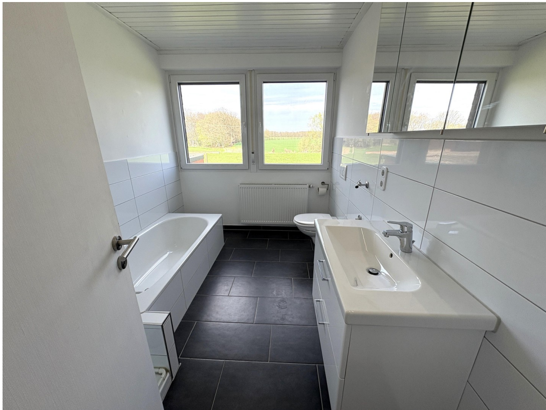
großz.Vollbad mit Fensterfront