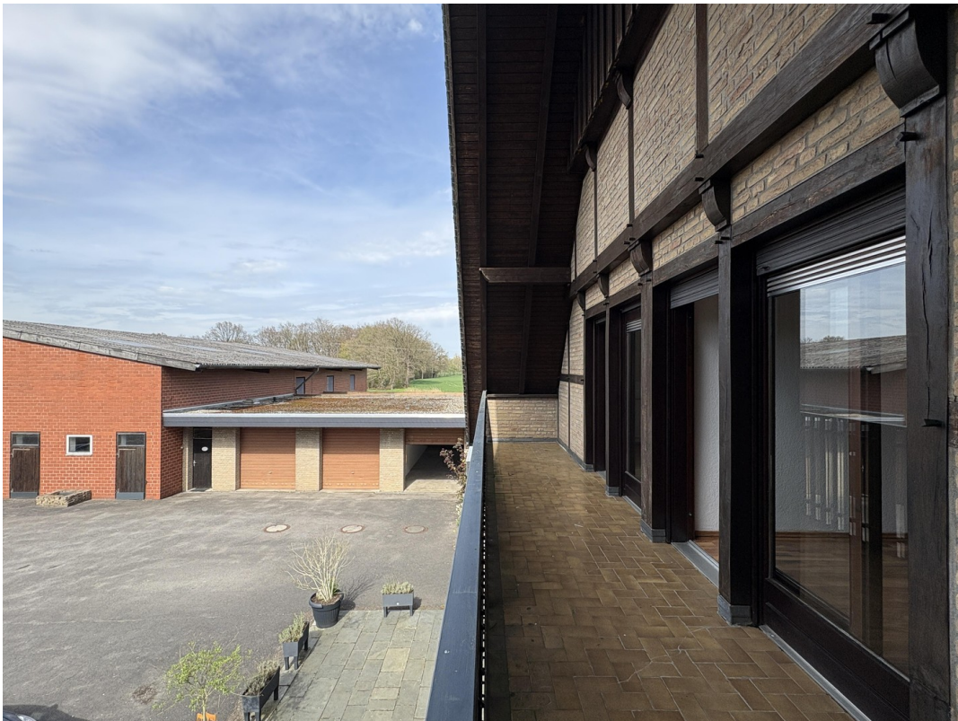
Balkonblick in die Natur