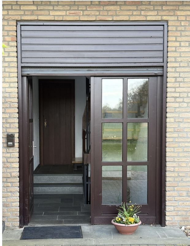
Ihr OG Eingangsbereich