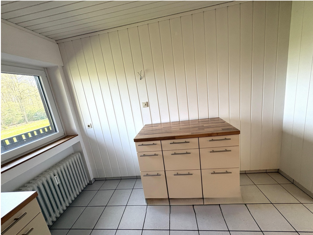
Küchenblock m. Kühlschrankschrank