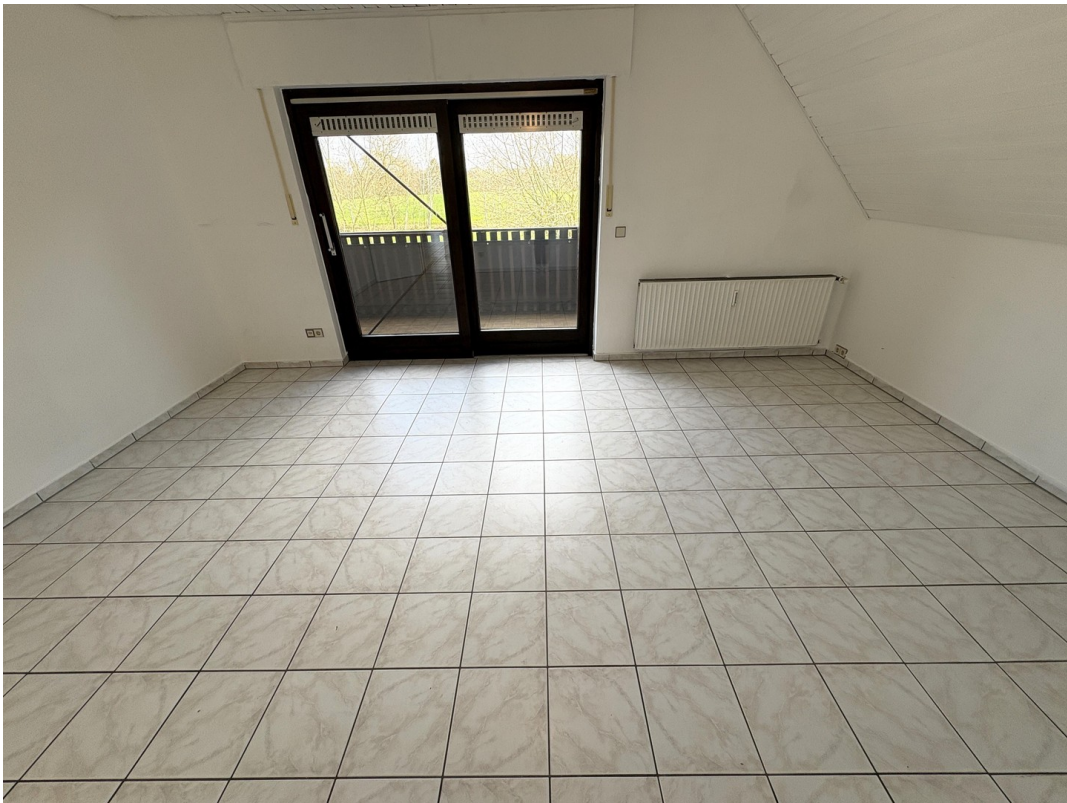
geräum. Wohn-Eßzi. m. Balkonz