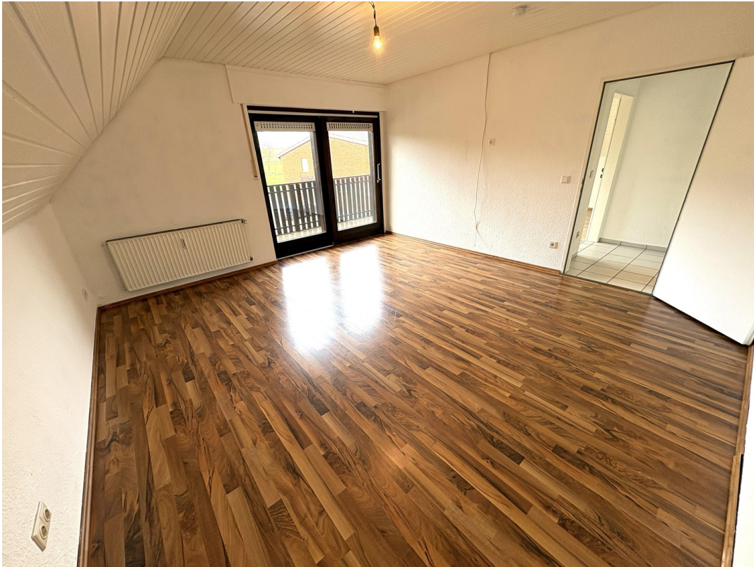
Homeoffice Zi.Blick ins Grüne