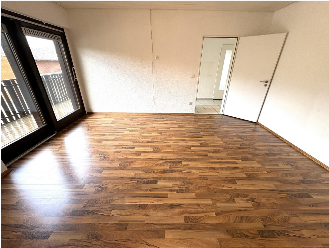
Eingang Homeoffice Zi.