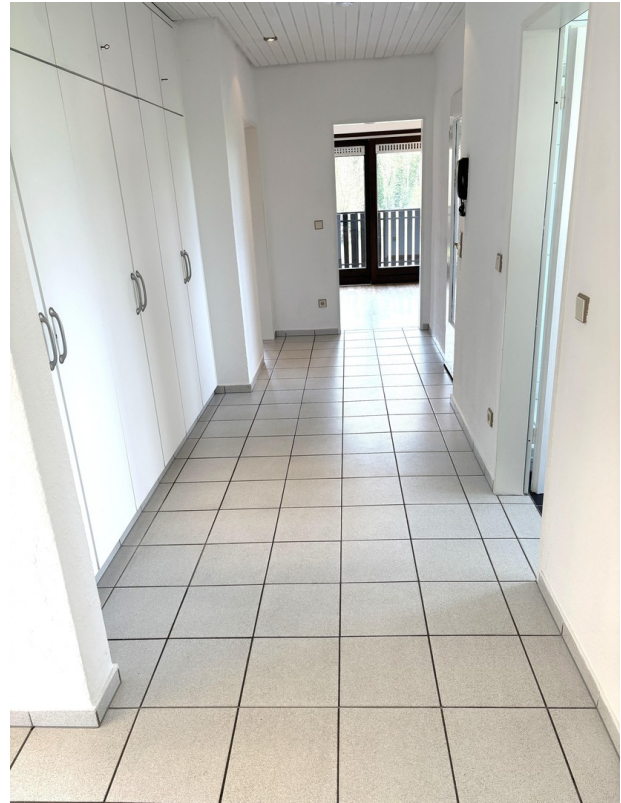
Heller Flur m. Einbauschränken