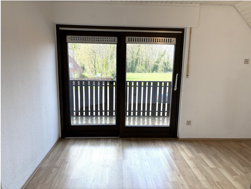
Gästezi. Blick zur Hofansicht