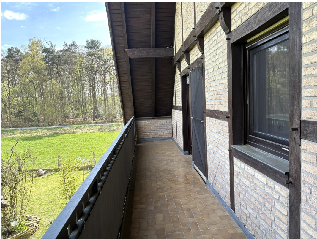
Balkonblick in die Natur