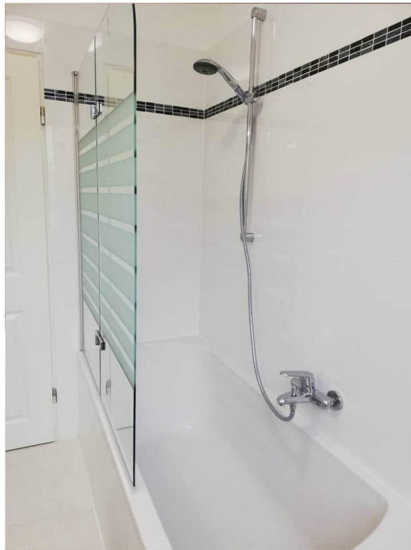
Badezimmer wird saniert