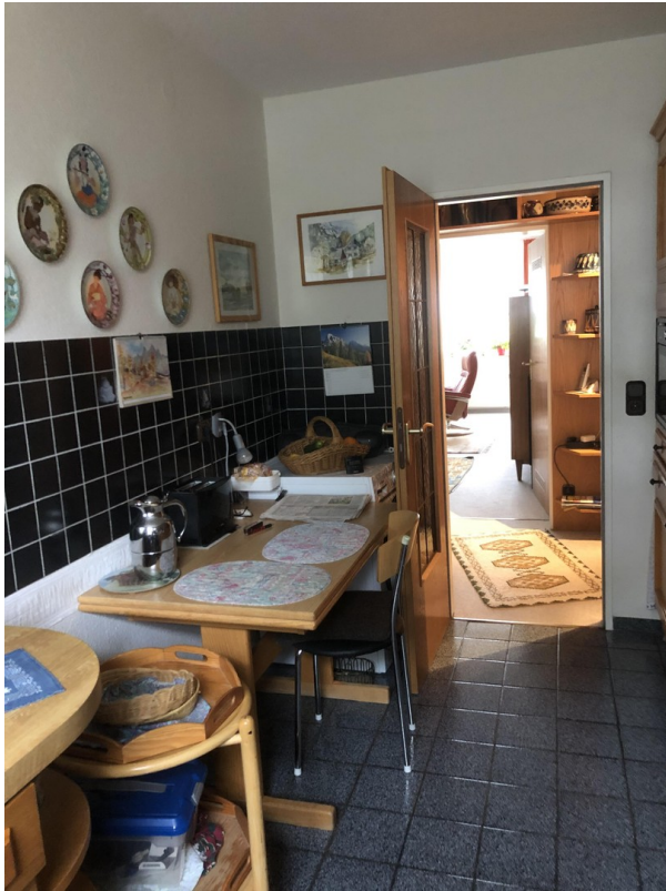
Küche Türen alle neu in Weiß