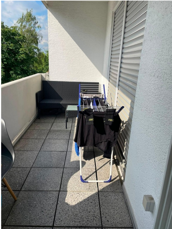
großer Balkon Wohn+Schlaf.