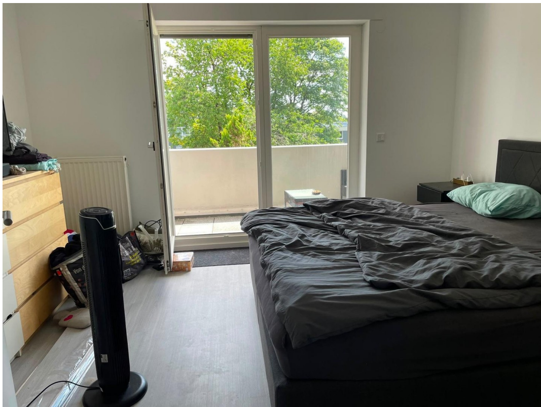
Schlafzimmer / Zugang zum gr.