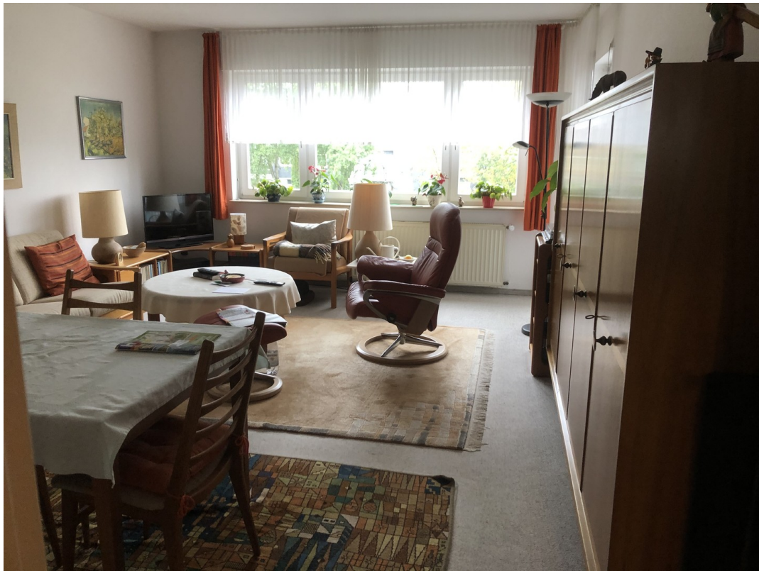
Wohnzimmer zugang Balkon