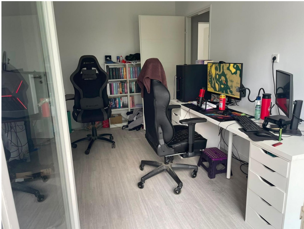
Kinder/ Arbeitszimmer/ Balkon