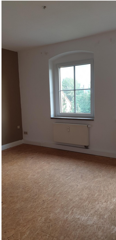
Blick in die Stube