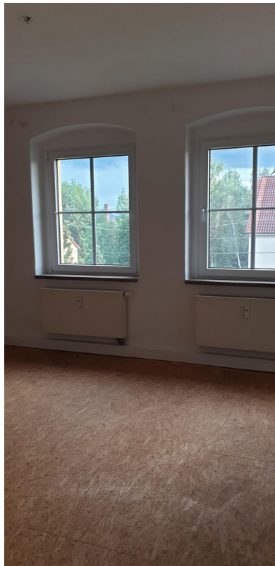
Blick in die Stube