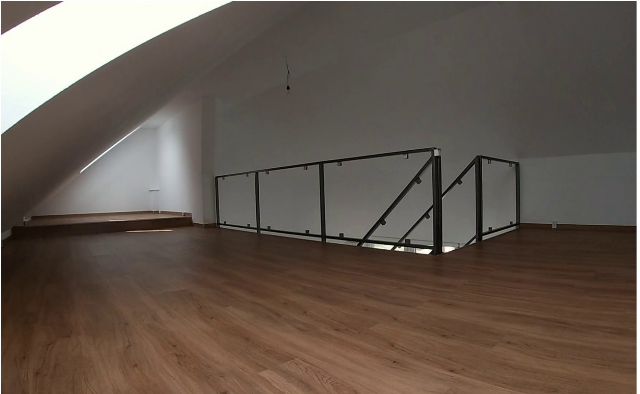
Galerie / Wohnraum