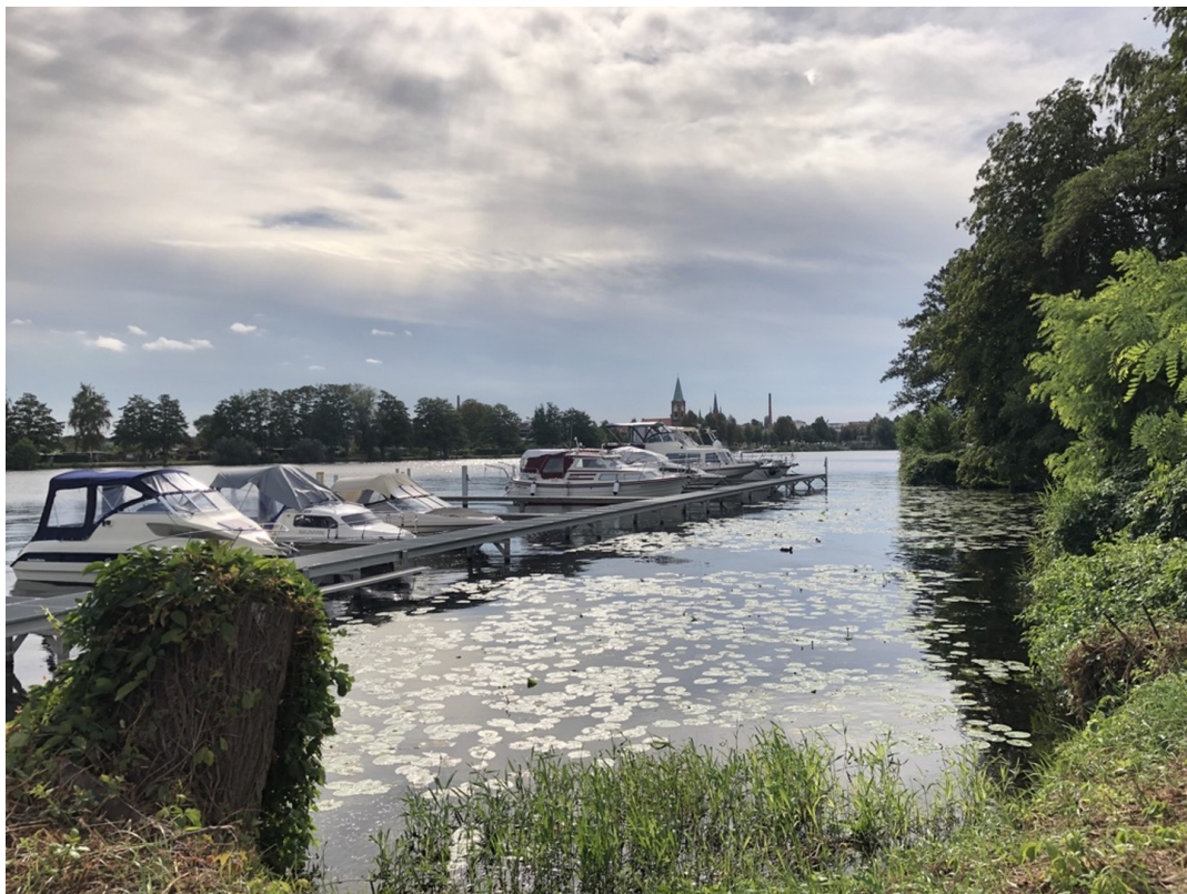
Uferzone der Havel