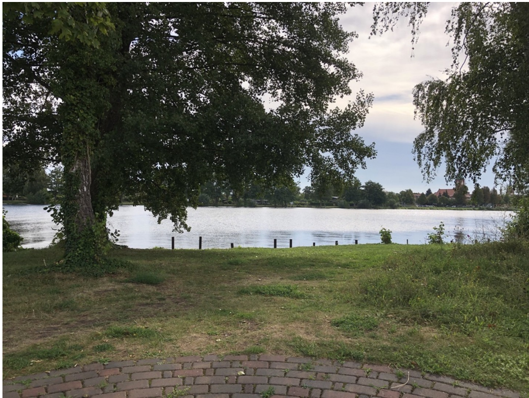
Uferzone der Havel