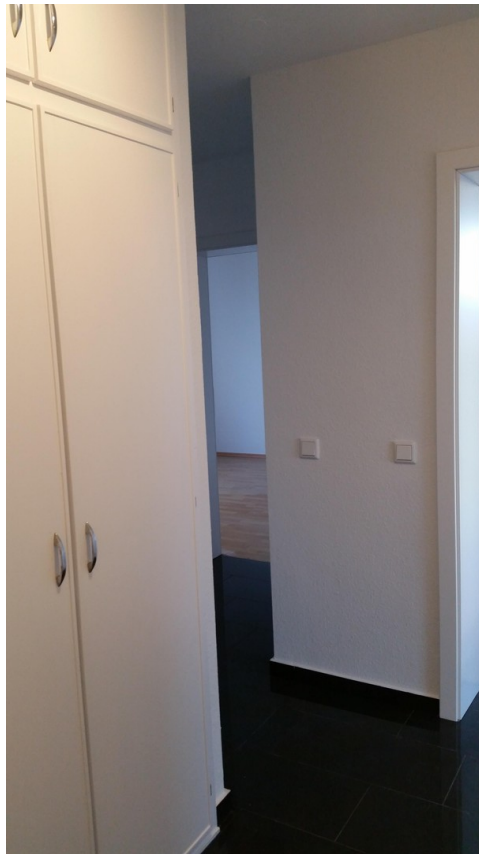
Diele mit Einbauschränk