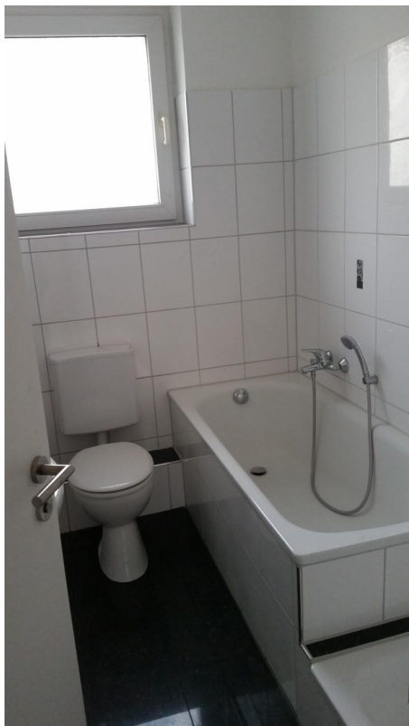
Tageslichtbad mit Wanne und Du