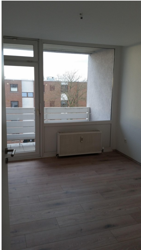
Zimmer mit Sonnenbalkon