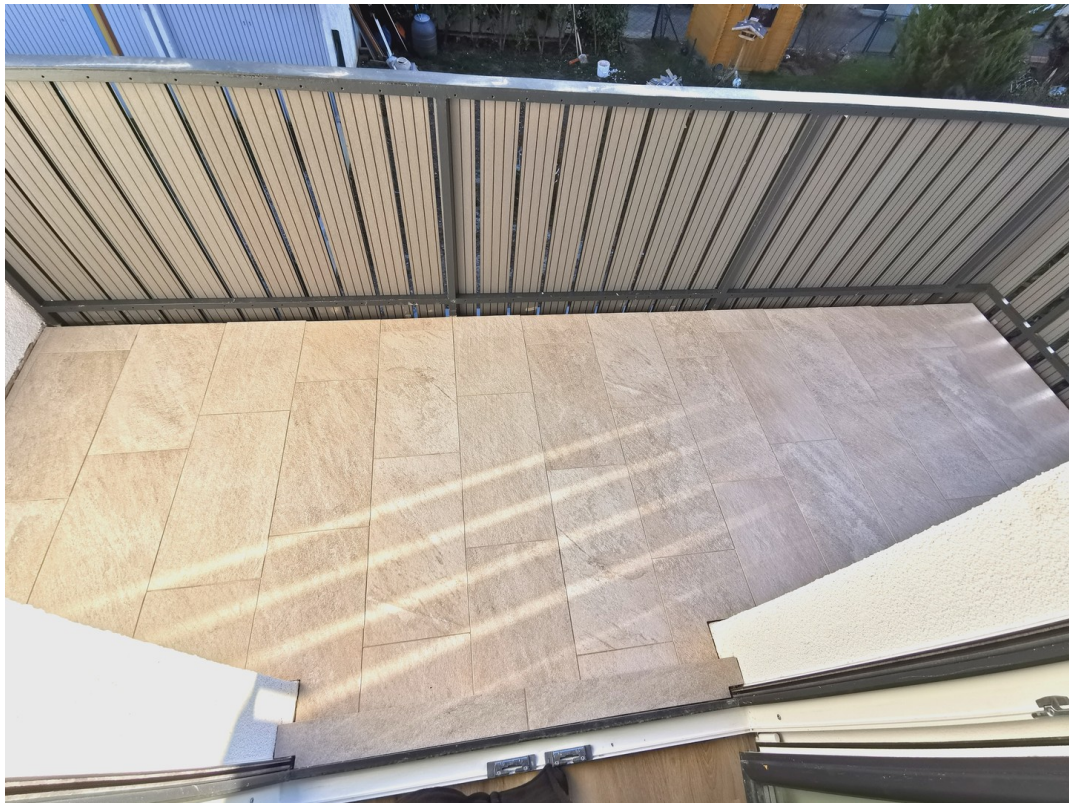
Balkon mit Italien. Fliesen