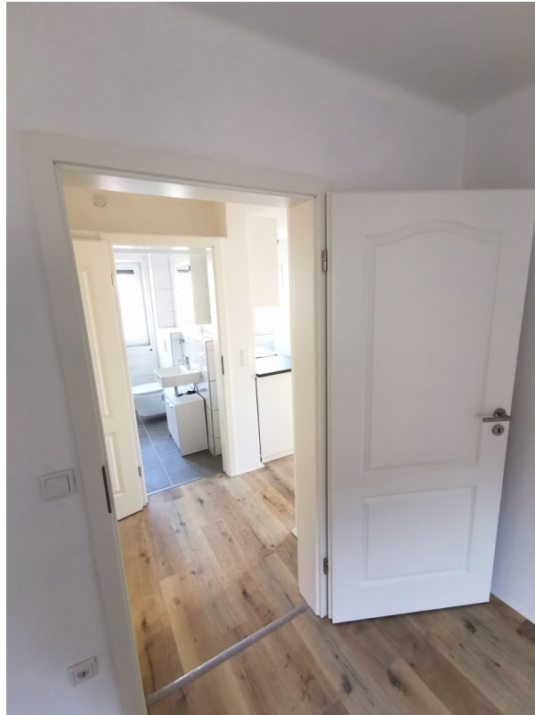
Blick vom Schlafzimmer ins Bad