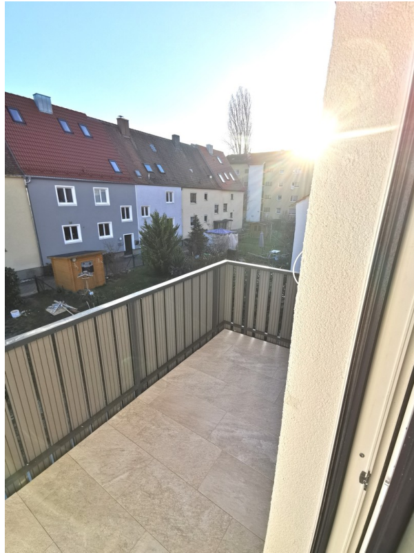
Balkon mit Südausrichtung