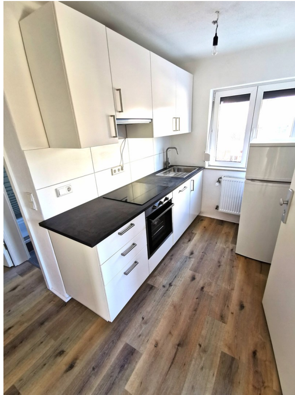
Nagelneue EBK mit Kühlschrank