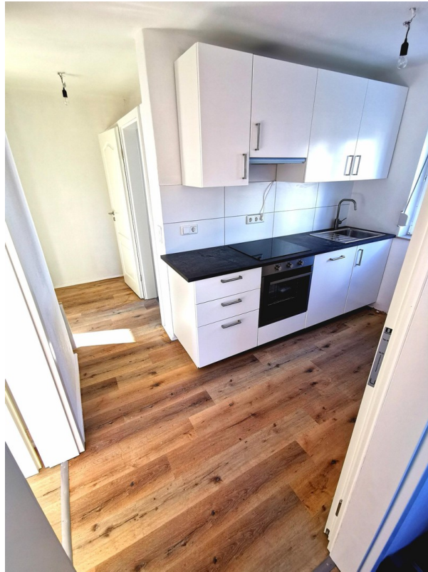
Eingang und Küche