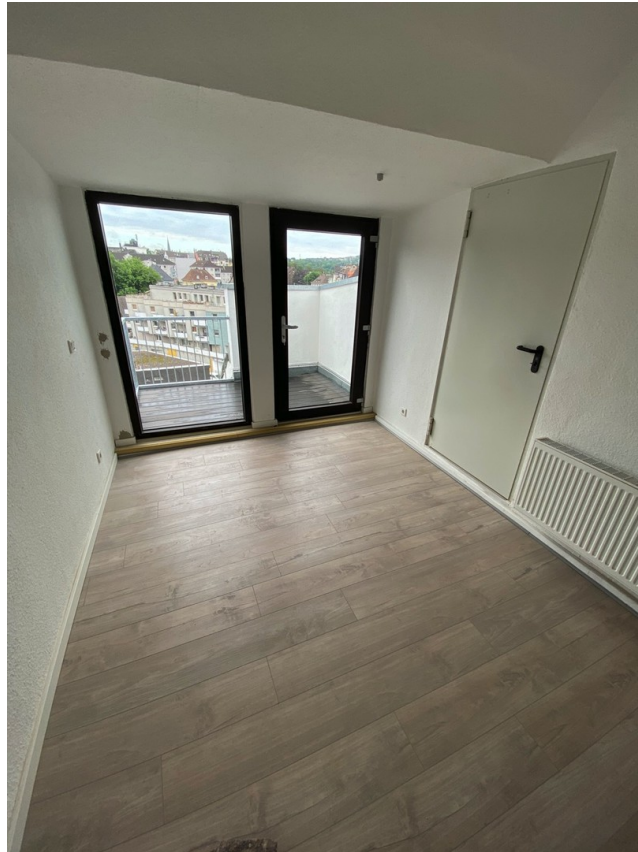
Zimmer mit Balkon