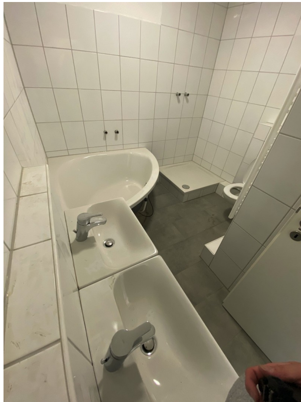
Bad mit Wanne, Dusche und WC