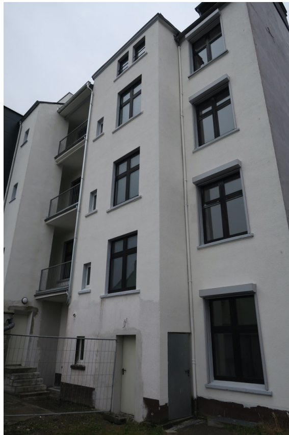
Aufzugzugang vom Garagenhof