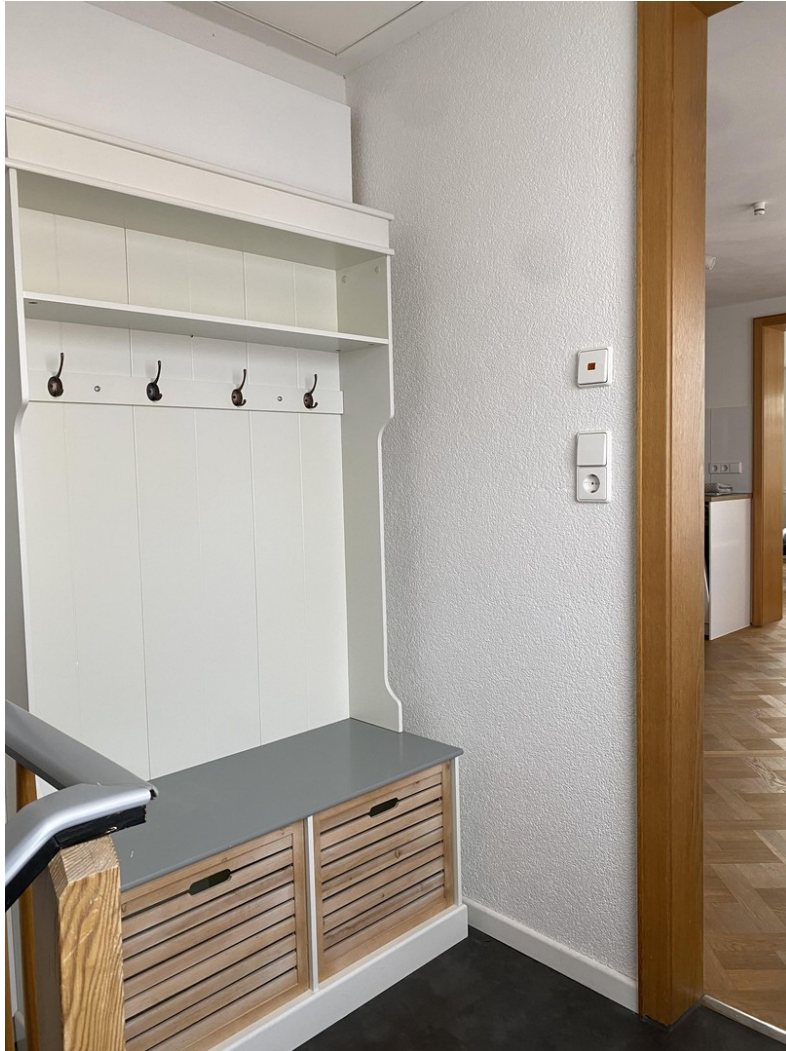
Garderobe vor Wohnungseingang