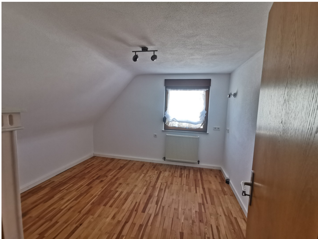
Kinderzimmer v. Türe