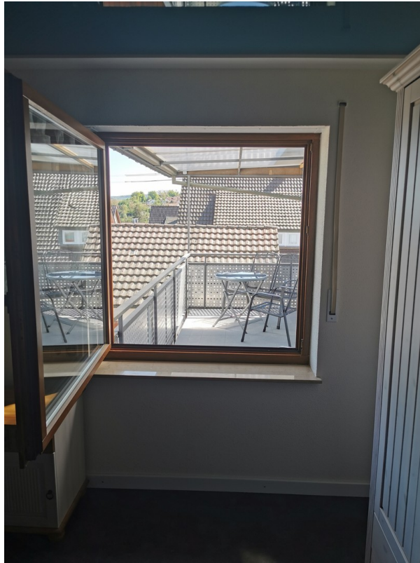
Sicht auf Balkon v. Schlafz.