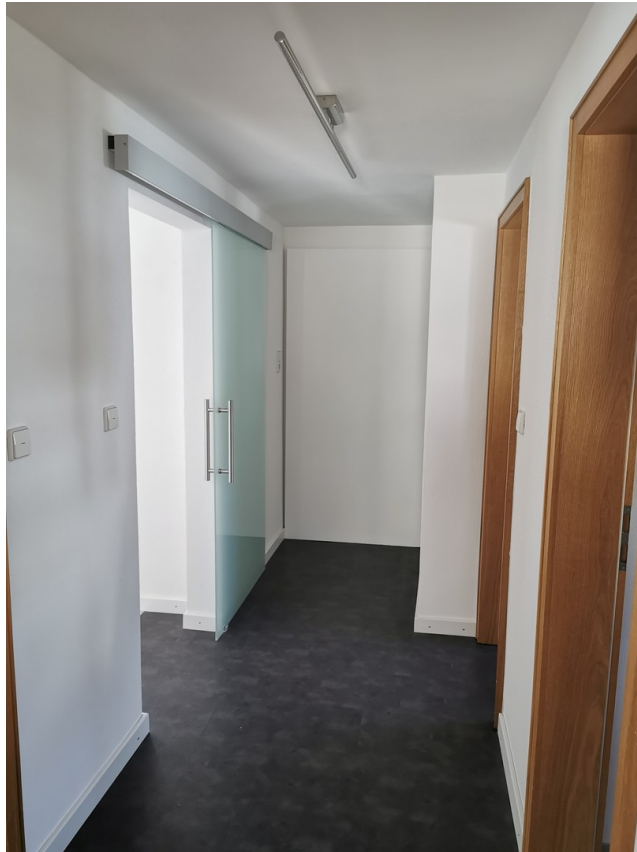
Flur Sicht v. Kinderz.