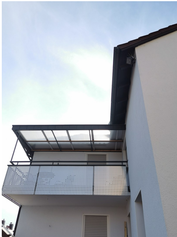
Balkon / Türe Wohnzimmer