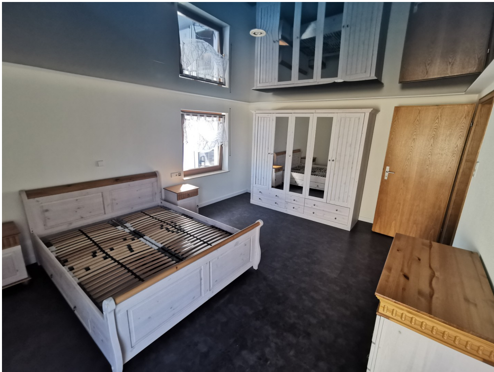
Schlafzimmer Fenster u. Balkon