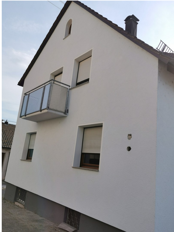
Balkon / Türe Schlafzimmer