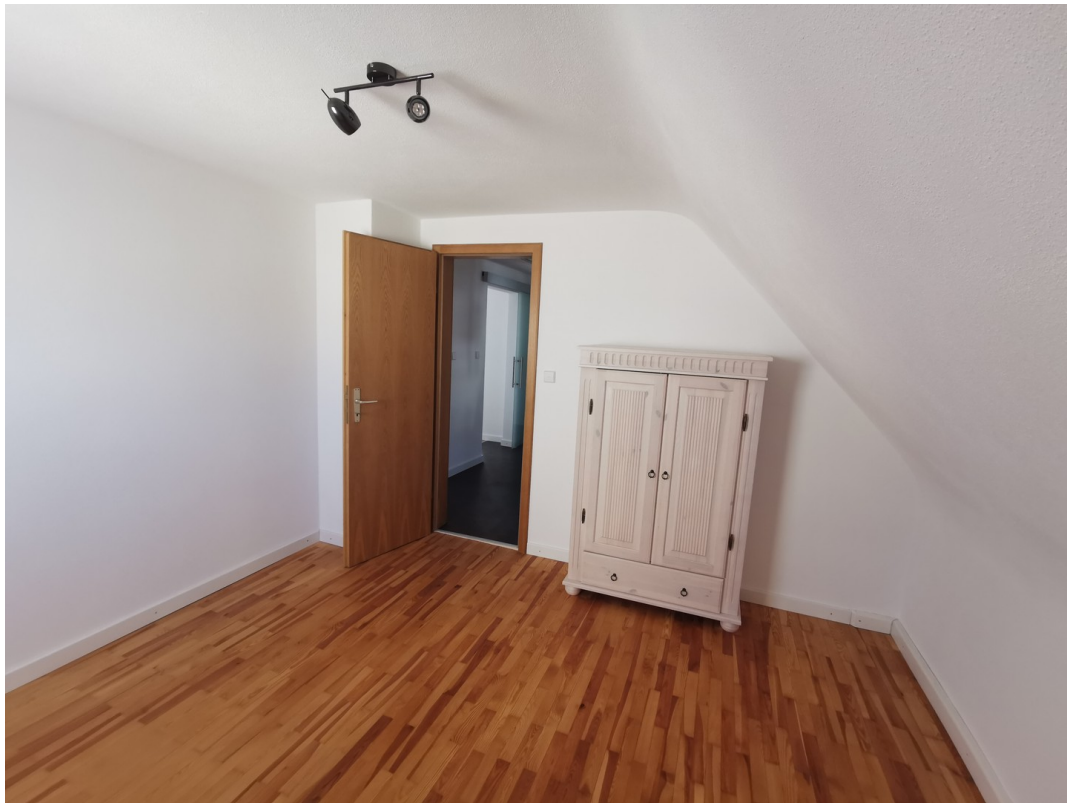
Kinderzimmer v. Fenster