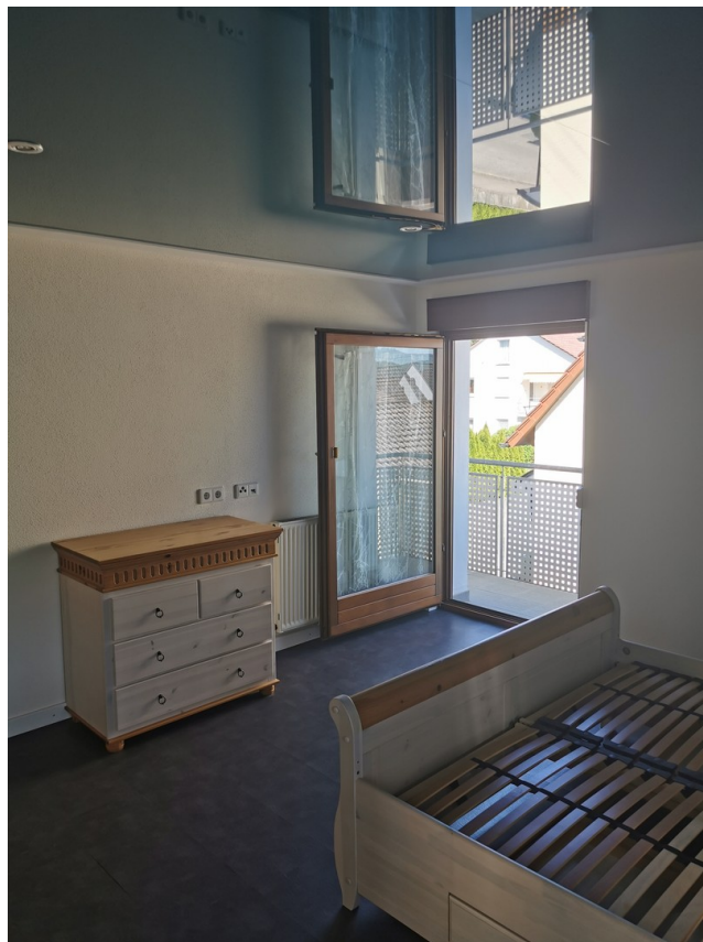
Schlafzimmer Balkon Giebel