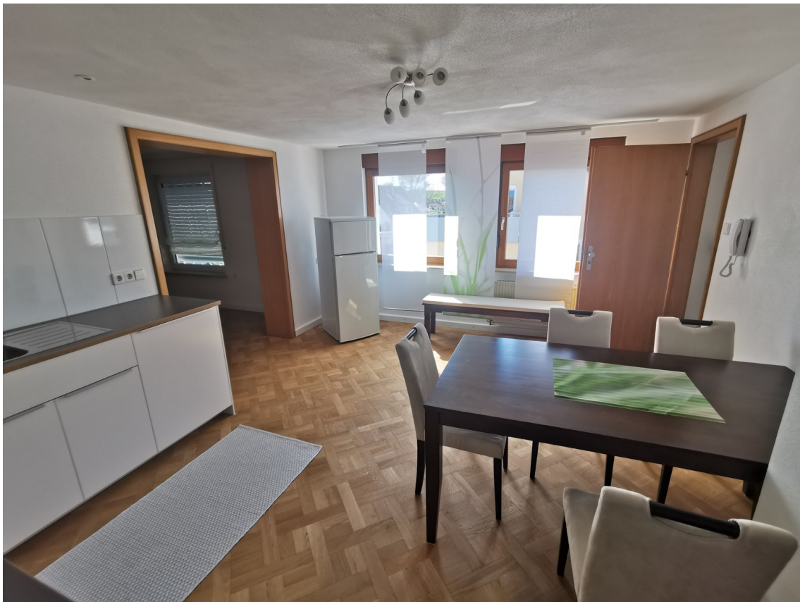
Rechts hinten Wohnungseingang