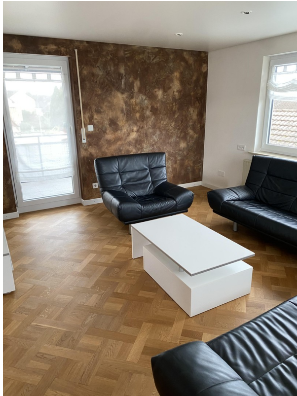
Wohnzimmer Blick Balkon