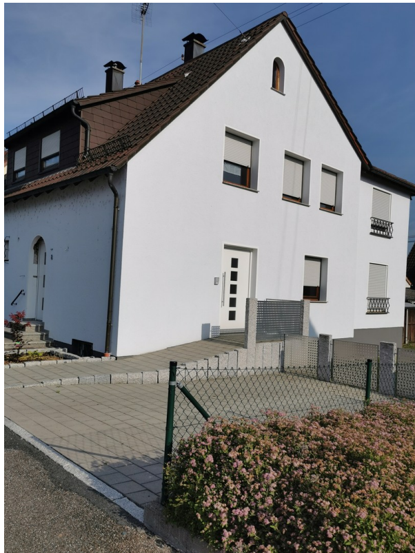
Hauseing. Whg. OG u. Stellplatz