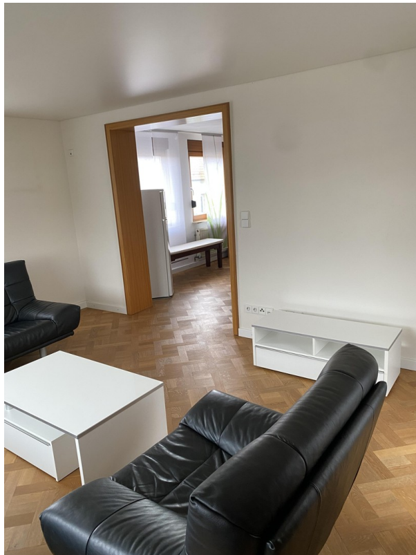
Wohnzimmer Blick Küche/Essz.