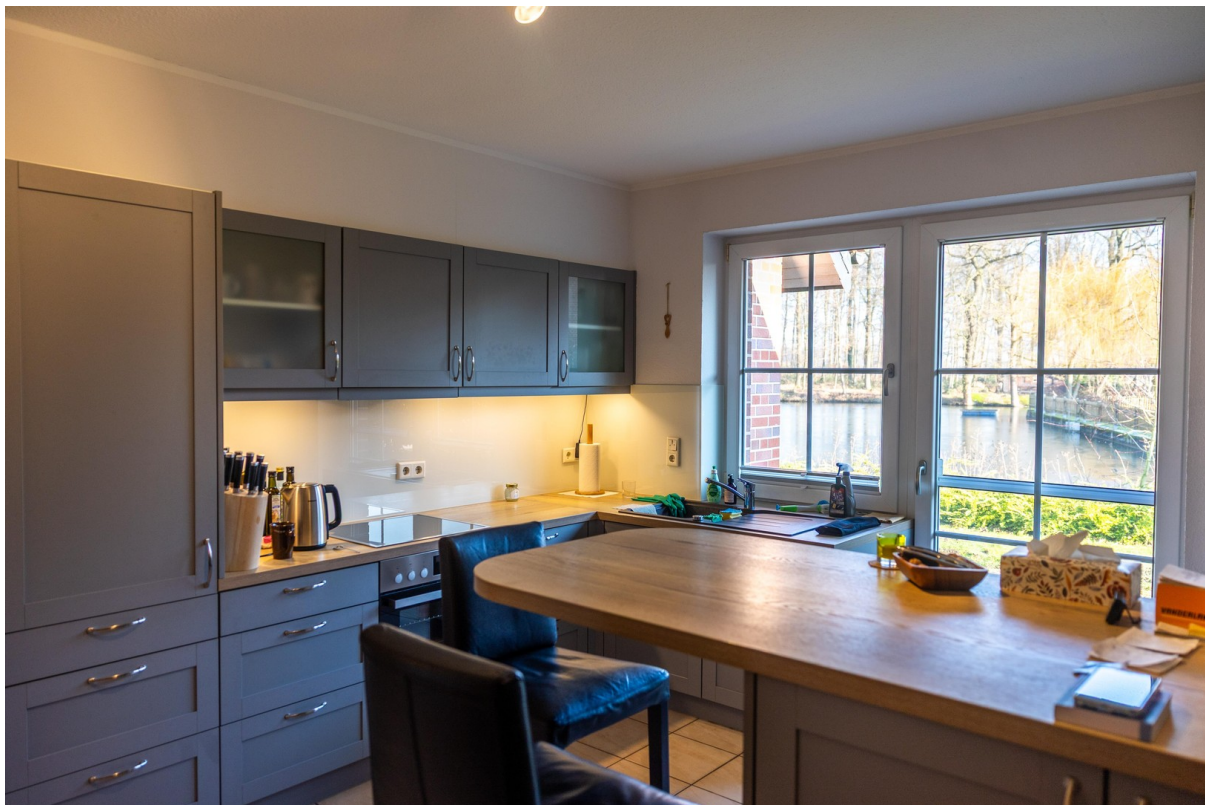
Essbereich in der Küche