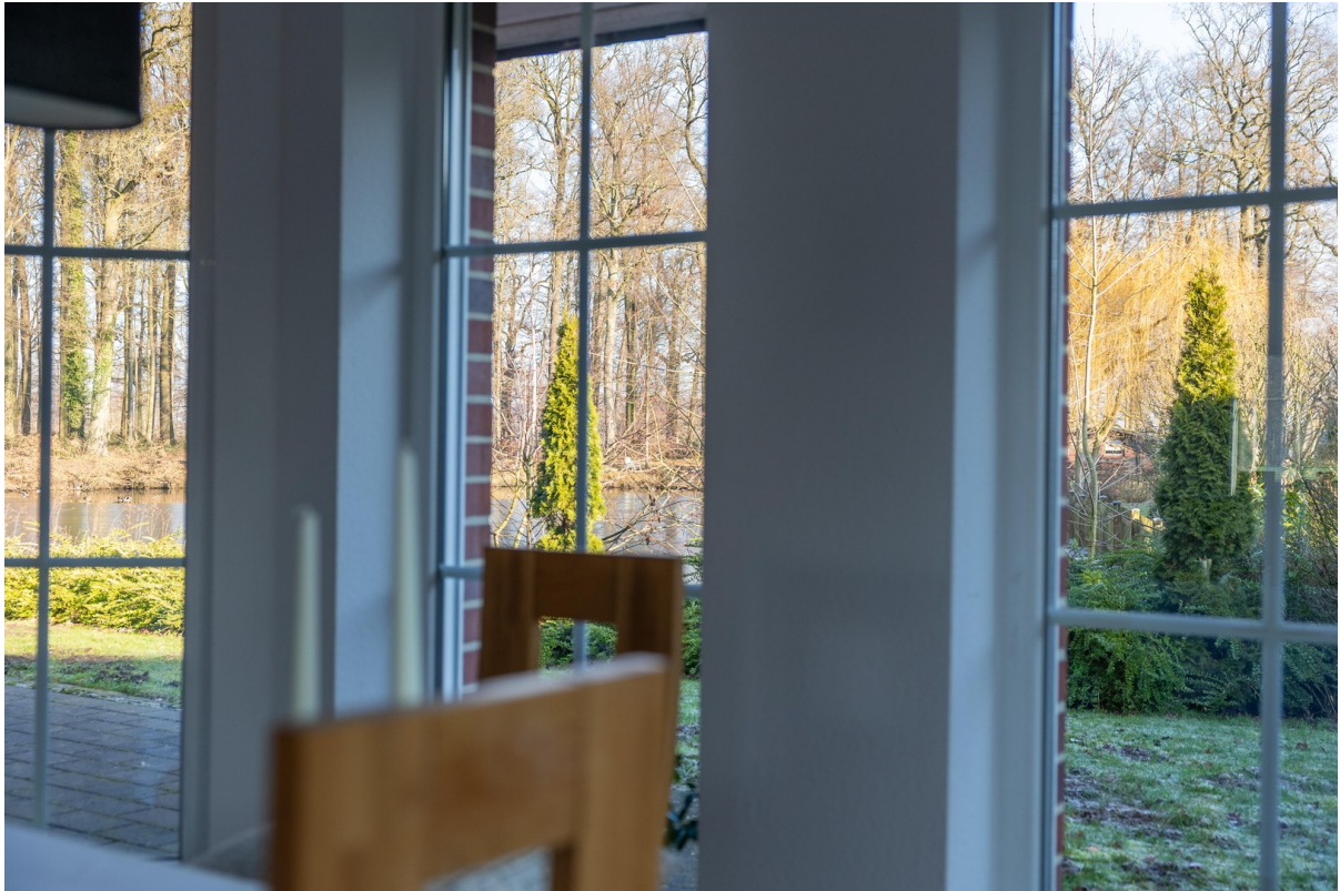
Blick aus dem Wohnzimmer