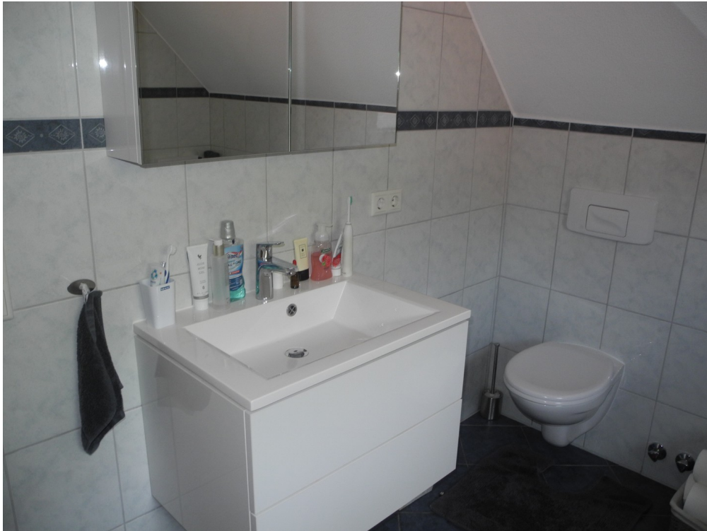
Bad im Obergeschoß