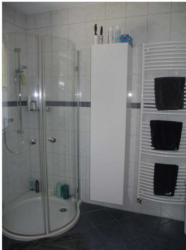
Bad im Obergeschoß