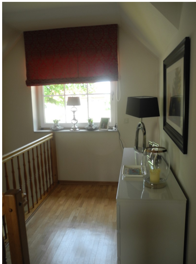
Flur im Obergeschoß