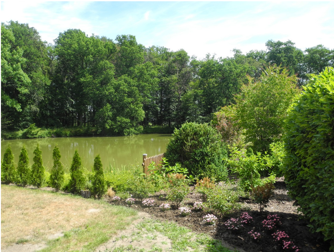
Blick aus dem Garten