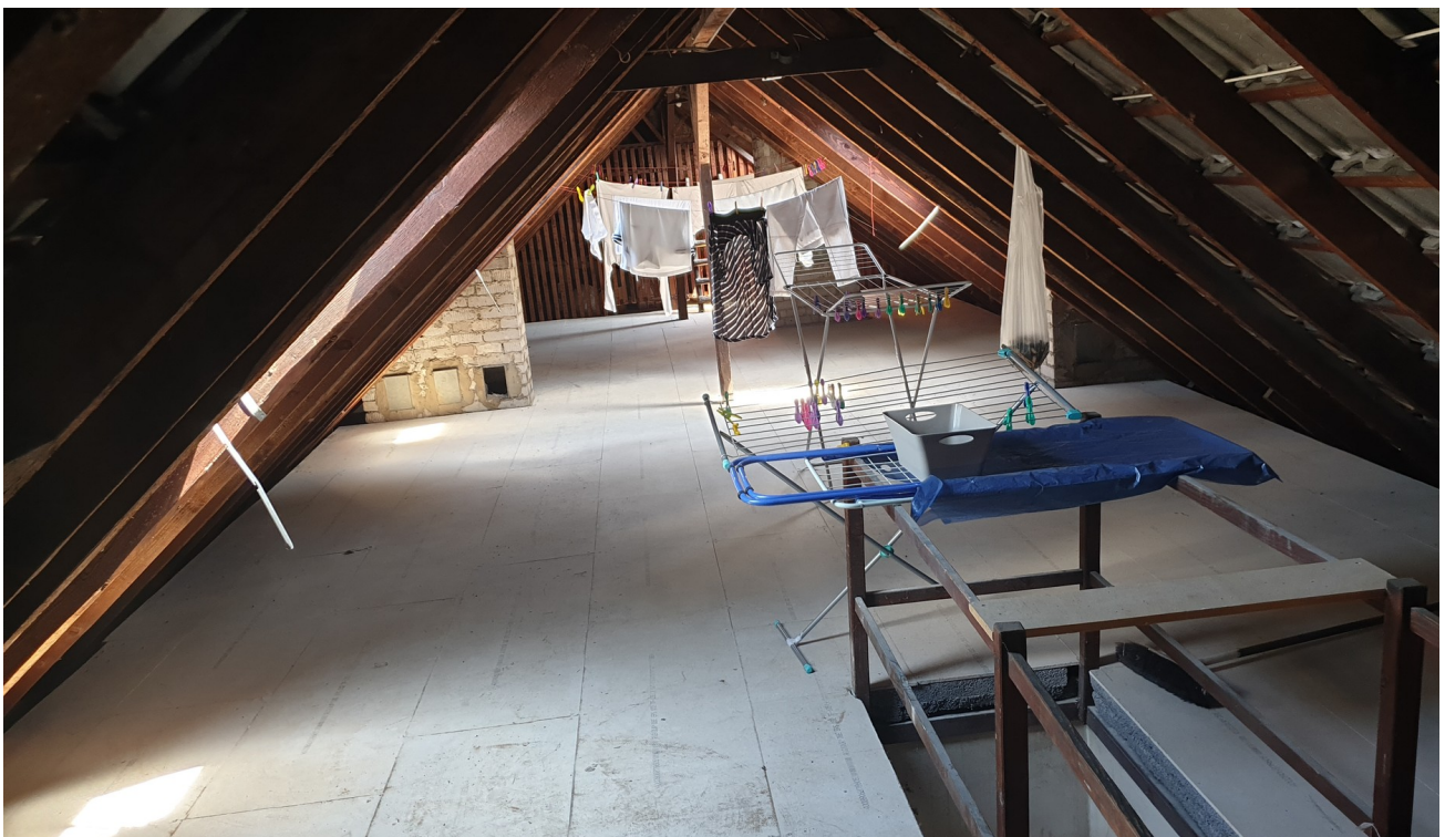
Dachboden, zum Wäsche trocknen