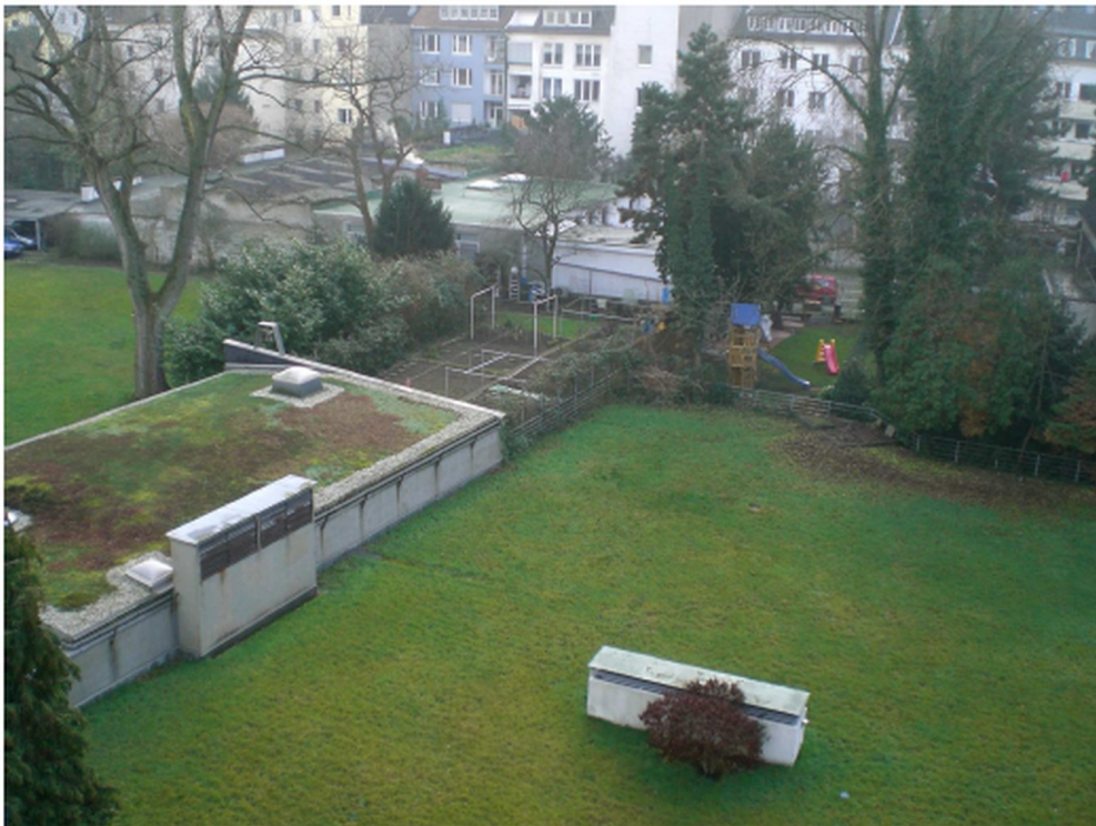
Aussicht / View