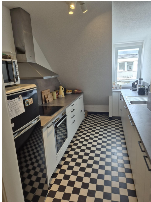
Küche mit Geräten