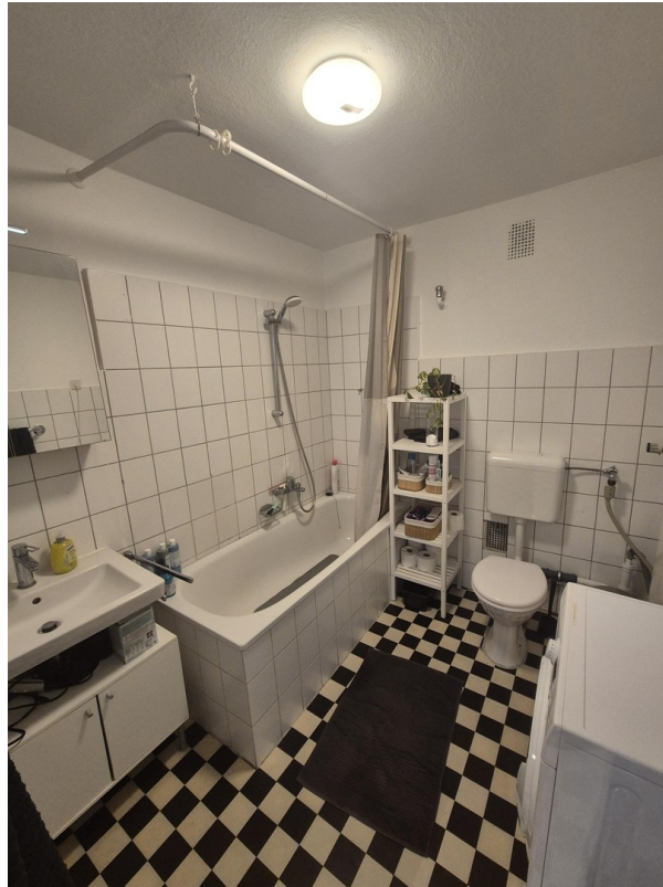
Bad mit Waschmaschine