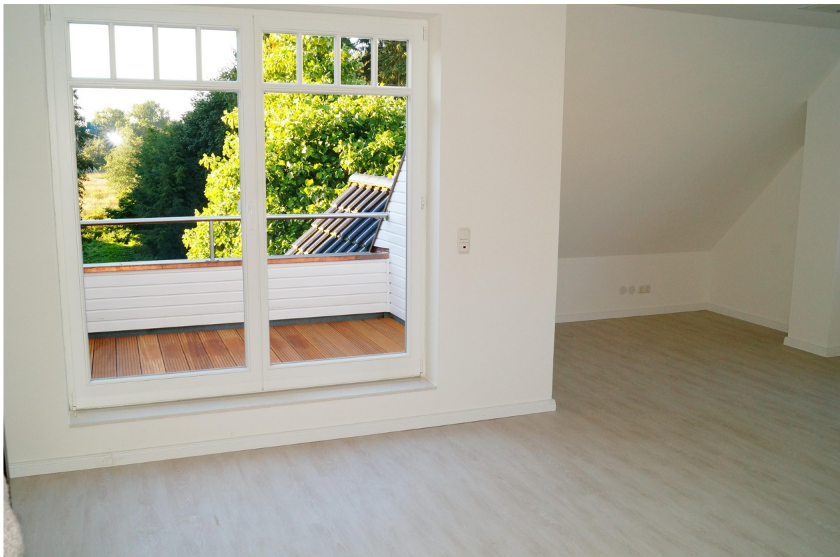
Wohnzi mit gemütlicher Loggia