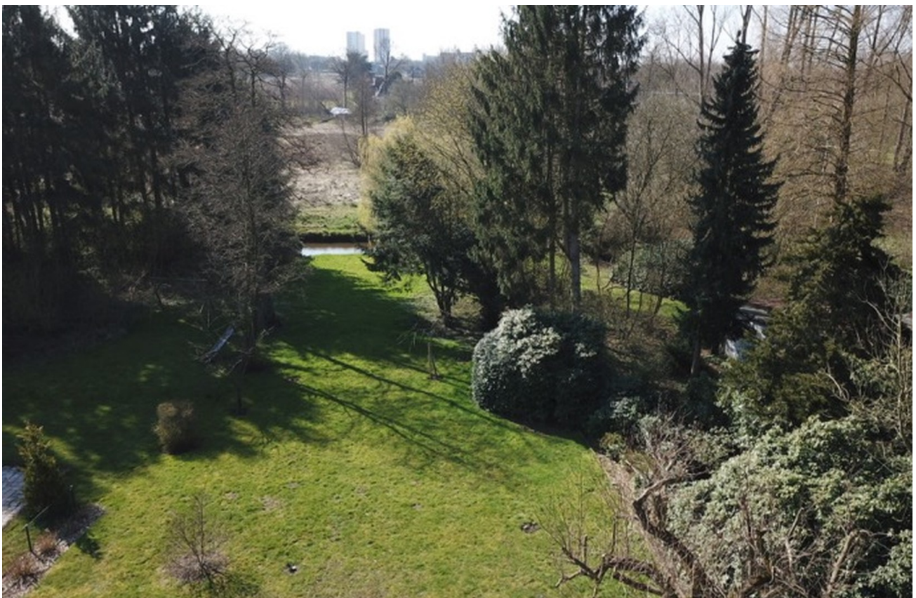
Blick aus dem Wohnzimmer