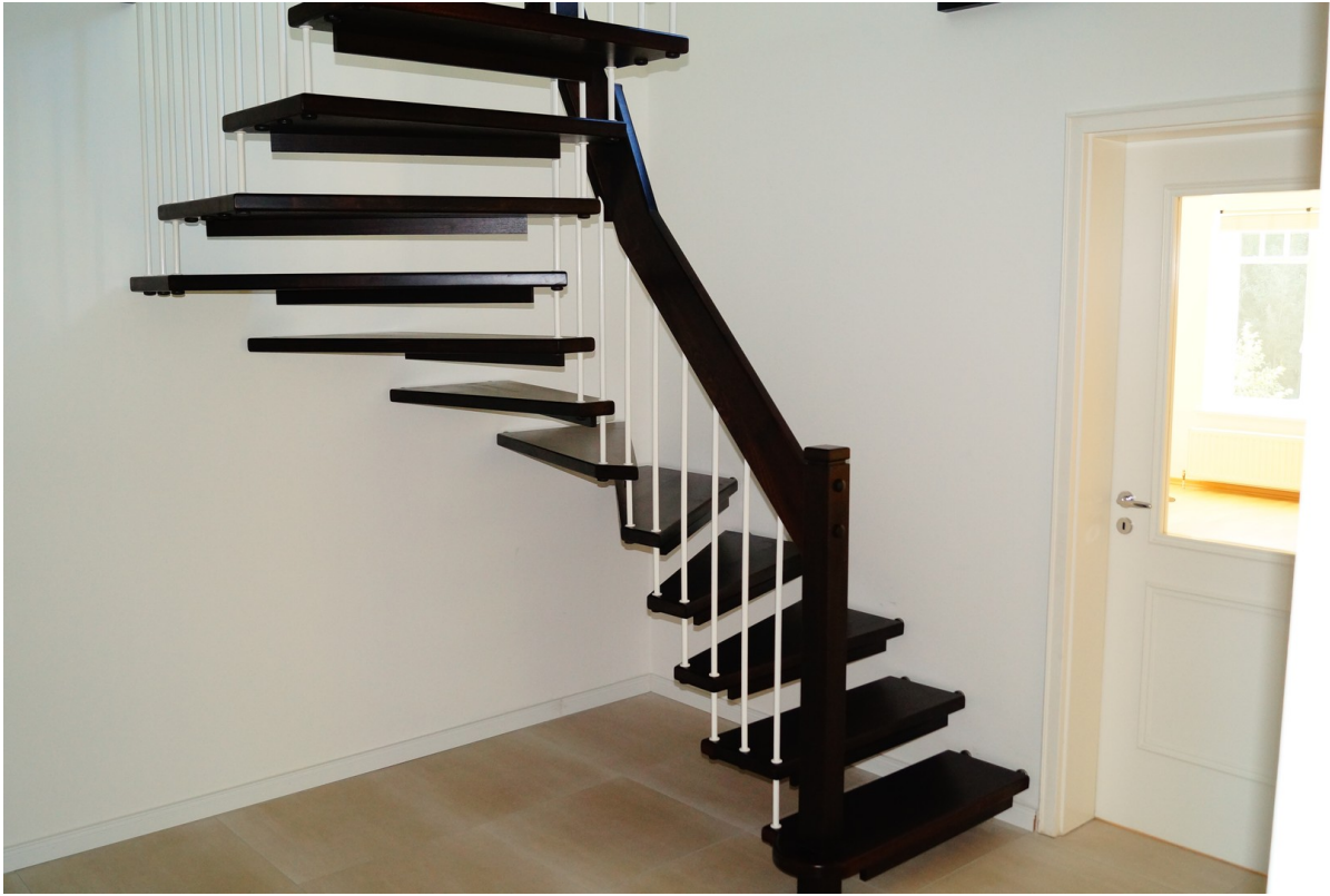
Treppenaufgang zum Wohnzimmer