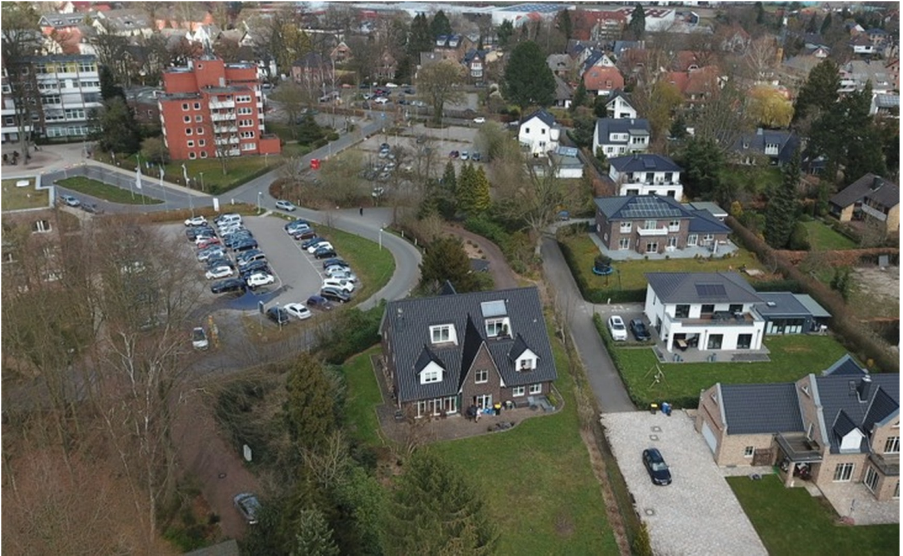
Blick von Süden