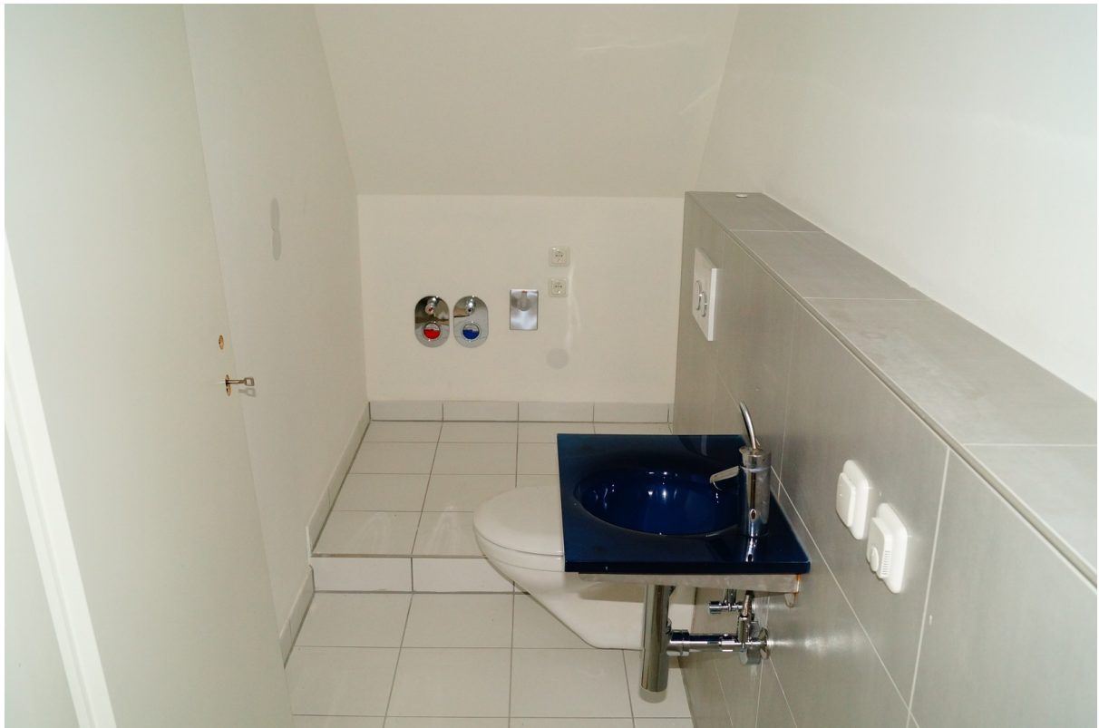
Gäste-WC mit Wamaanschluss