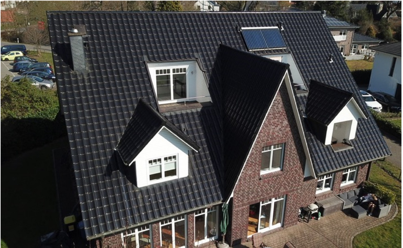
Whg links mit Giebel + Loggia