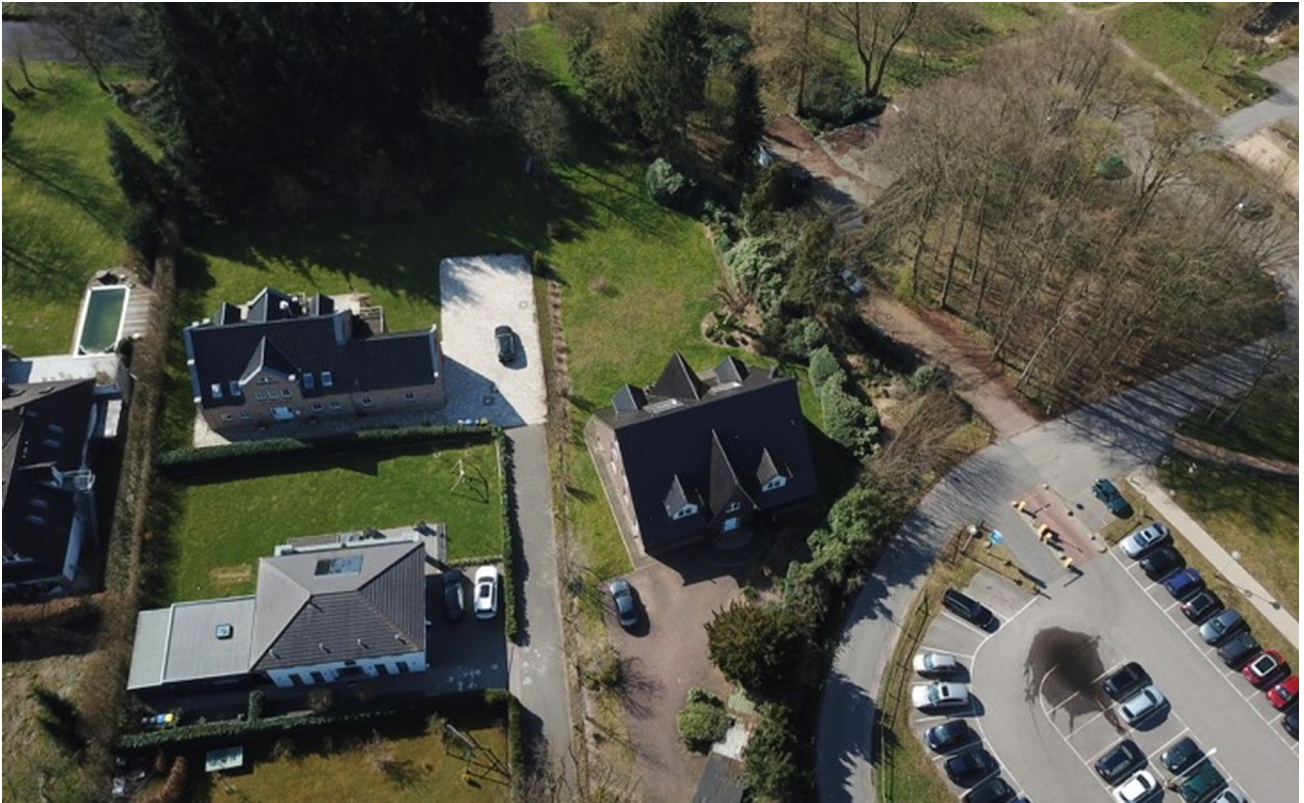
Blick aus Norden