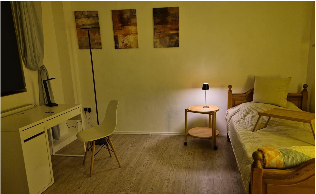
Zi 2, 2026