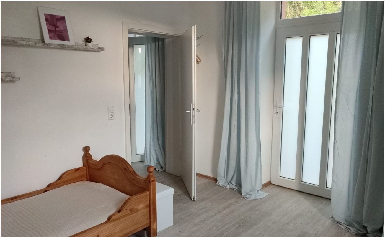
Zi 2 mit Ausgang