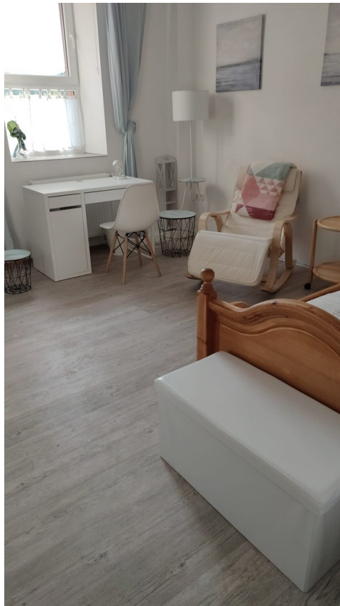
Zi 2 mit Storage-Box