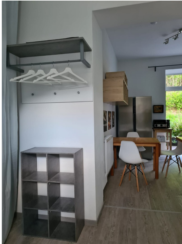
Eingang mit offener Küche