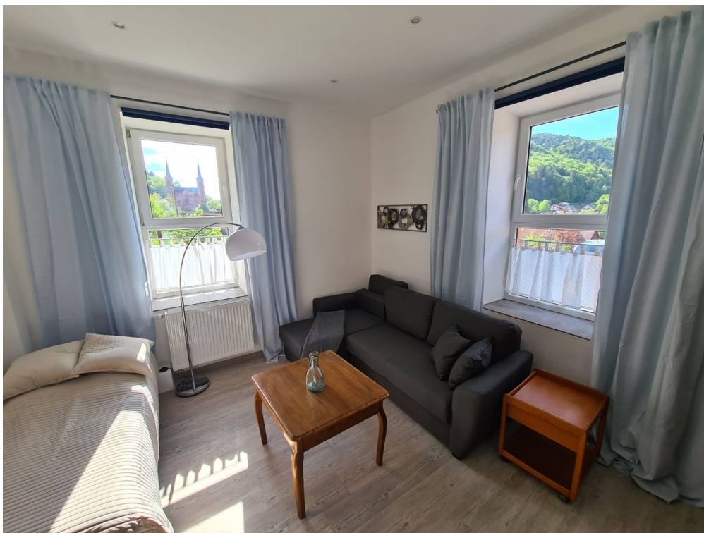
Zi 1: Tagesbett + Schlafcouch