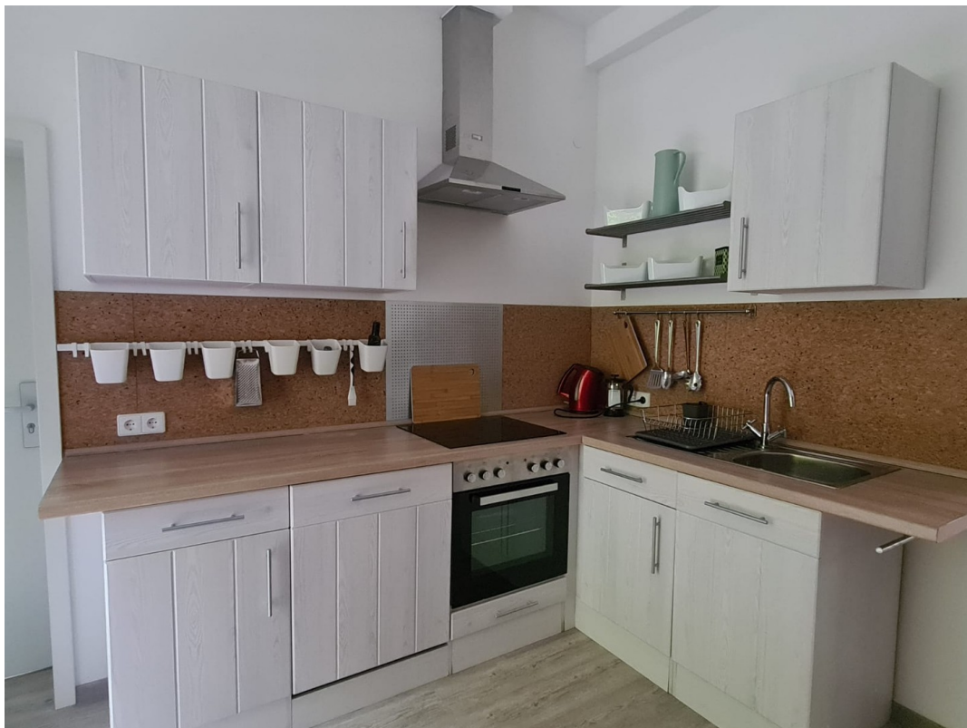
Küche L Form