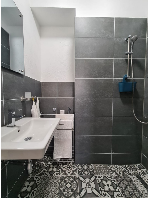
Dusche und Waschplatz