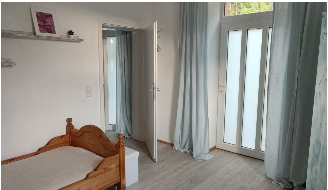
Zi 2 mit Ausgang