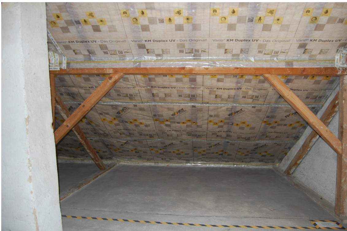
Stellfläche auf dem Dachboden